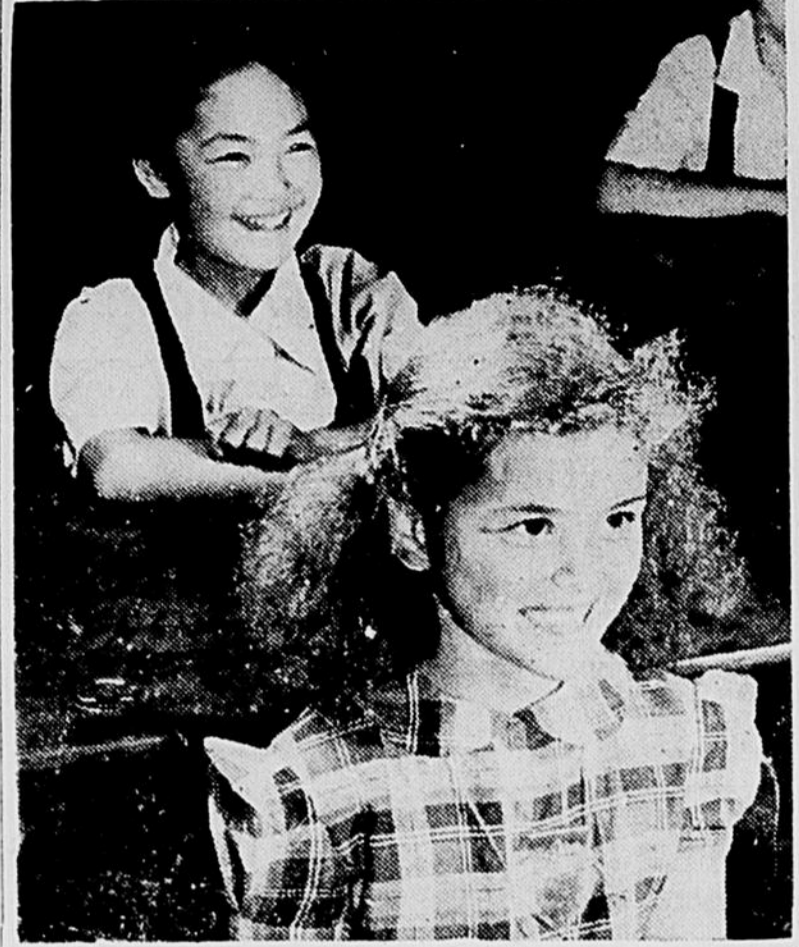
Ces enfants reçoivent une bonne éducation dans une école modèle. Ils grandissent heureux tandis qu'on les prépare à affronter l'avenir. Scène extraite d'un documentaire de l'Office National du Film intitulé: BAMBINS — (série En Avant Canada).

VRAIMENT MacLean rapporte que durant les neuf premiers mois de 1946, seulement un tiers de la construction, au Canada, est allé pour la résidence et la manufacture. Les deux autres tiers ont été pris par la construction non essentielle: night clubs, hôtels et cinés. C'est là le résultat d'un contrôle trop strict du prix des loyers résidentiels et du prix des articles ouvrés par la manufacture.