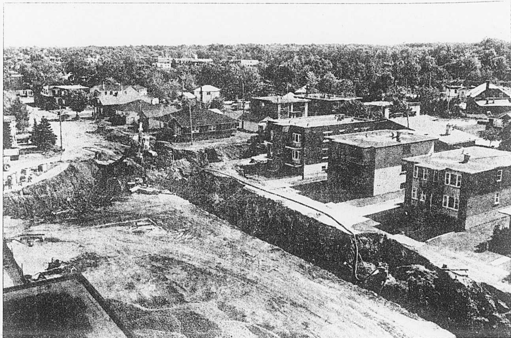
Les plaies de ce quartier seront bientôt cicatrisées, mais l'«Operation pétrole» est devenue célèbre. Des visiteurs d'une trentaine de municipalités sont venus tant prêter main forte qu'observer les moyens mis en oeuvre pour contrer la menace d'une catastrophe urbaine.

Le «grand dérangement» provoqué par la découverte de cette dangereuse nappe d'or noir à Saint-Eustache devrait prendre fin d'ici le 31 juillet. Revoilà son échéancier de travail, le gérant municipal et coordonnateur des mesures d'urgence, Ronald Biard, se dit satisfait de