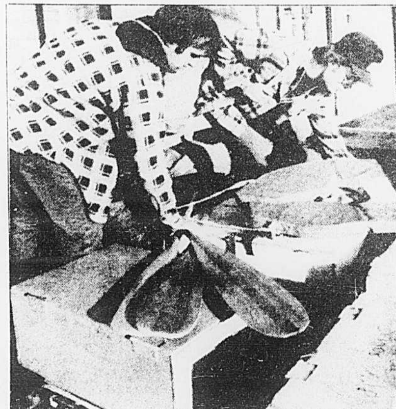
Un autre groupe d'étudiants de l'école St. John's qui effectuait une excursion en canot près de Wawa est rentré à Toronto en apprenant la tragédie survenue dimanche au lac Témiscamingue. Après la cérémonie commémorative qui aura lieu demain à l'école, les autorités décideront si l'expédition se poursuivra.