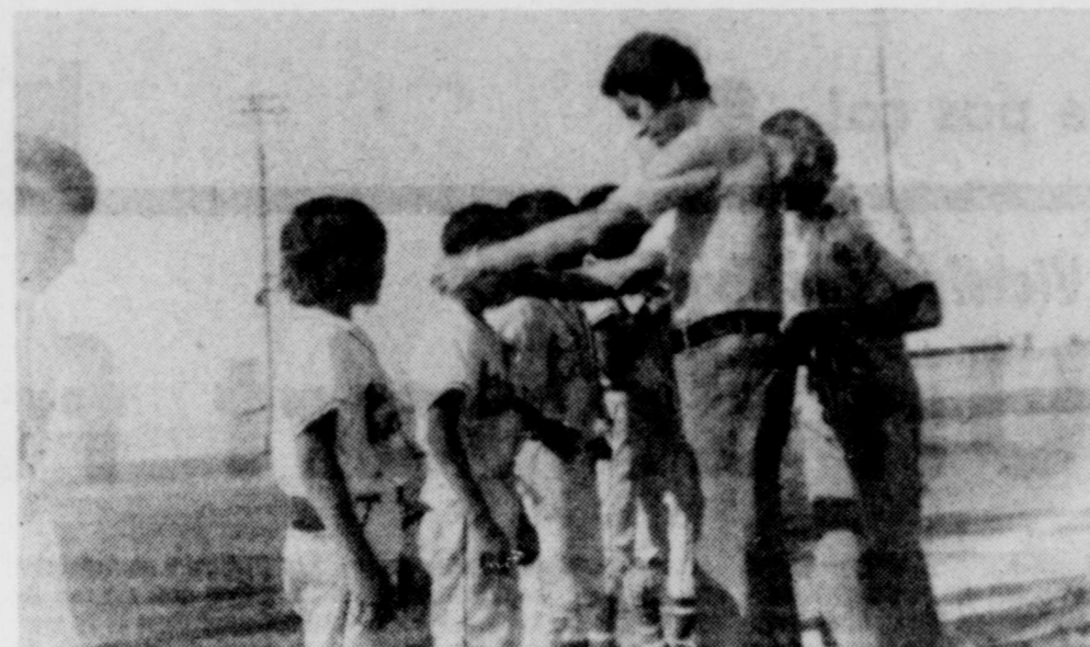
Un tournoi de baseball de catégorie "pee-wee" a été un plein succès, à Plessisville. Cette compétition était une initiative de l'Association du baseball mineur locale et les équipes participantes venaient de toute la région du Centre du Québec. C'est le club d'Arthabaska qui a remporté les grands honneurs de la compétition.