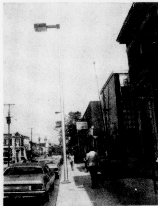
On installe actuellement de nouveaux lampadaires plus modernes sur le côté sud de la rue Notre-Dame, à Victoriaville. On sait qu'il y a quelques semaines, on avait élargi le trottoir en prévision de ces lampadaires. Par ailleurs, lorsqu'on aura

Initier les jeunes à la vie scoutie était le but visé par l'accueil à une trentaine de garçons et cet objectif a été pleinement atteint si l'on en juge par les témoignages d'appréciation donnés par les invités à la fin du camp. Les parents de ces jeunes ont également été accueillis au début de la période alors qu'ils étaient venus conduire les garçons au camp. Un autre but de "camp initiation" était de sensibiliser les adultes aux activités scouties en vue du recrutement de responsables qui pourraient aider à la formation d'autres branches.