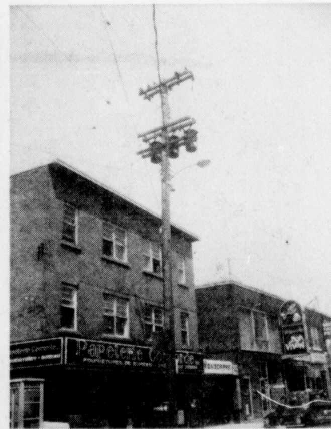
fait disparaître ces poteaux de bois qui se trouvent sur le côté nord de la rue Notre-Dame, l'artère principale de Victoriaville sera grandement rafraîchie. (Photo LeRo).