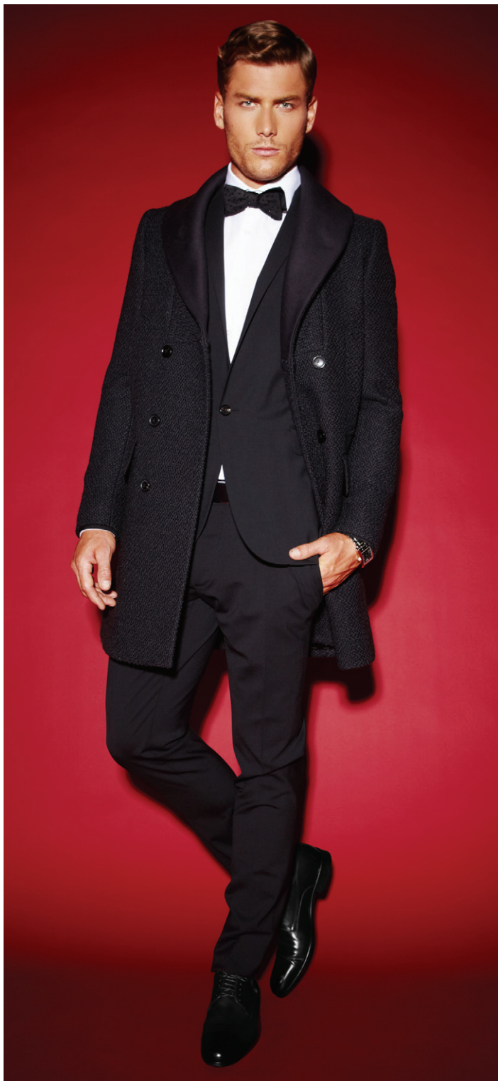
Complet Dsquared (1255$), chez Duo. Manteau Paul Smith (1200$), chez Simons. Chemise Bill Tornade (245$), chez Duo. Nœud papillon Title of Work (295$) chez Simons. Montre Emporio Armani (305$), chez Simons. Chaussures Hugo Boss (425$) chez Browns.

Simons : 977, rue Sainte-Catherine Ouest, Montréal 514 282-1840 Duo : 30, rue Prince Arthur Ouest, Montréal 514 848-0880 Browns : 1191, rue Sainte-Catherine Ouest, Montréal 514 987-1206