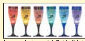
Les coupes lumineuses de la Nuit des Galeries