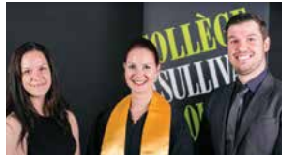
ASSURANCE DE DOMMAGES ET EXPERTISE EN SINISTRES