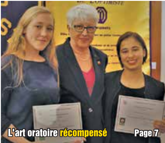
L'art oratoire récompensé Page 7