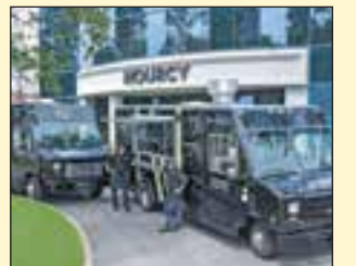
Les deux camions de rue de NOURCY Comptoir & Traiteur

L'entreprise de Québec, NOURCY Comptoir & Traiteur, annonçait fièrement il y a quelques semaines la mise en route officielle de son... DEUXIEME camion de rue! C'est pour répondre à la grande demande de la part du public et afin de pouvoir mieux desservir les événements privés et corporatifs que ce second camion a été créé (à l'image du premier) pour servir des plats et gourmandises partout dans la région. En agrandissant ainsi sa flotte de foodtrucks, NOURCY promet de pouvoir dorénavant nourrir encore plus de bouches grâce à son menu qui peut être aussi santé que décadent, selon les goûts de chacun! Alors le premier camion NOURCY sera installé en tout temps à partir du 25 juillet au Village Vacances Valcartier lors des prochaines semaines, le nouveau et deuxième camion se promènera quant à lui aux quatre coins de la région pour différents événements.