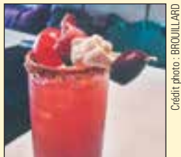
Le CAESAR Copyright Cap-Rouge