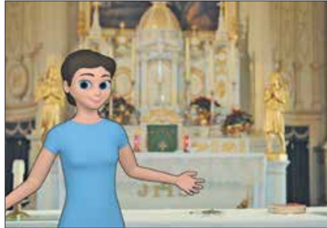
Le personnage principal du court-métrage : Augustine.

Le court-métrage a été visionné en classe par les élèves de quatrième année du primaire dans le cadre de la visite du Chemin du Roy organisée par la Société d'histoire de Saint-Augustin-de-Desmaures. Le court-métrage est l'œuvre de Nicolas Robitaille (Nixart.ca), Pierre Breton (facebook.com/PierreBretonMonteur), Éric Dorion (LeStudioEDC.com) et Laurence Bernard-Fontaine. Le court-métrage est également disponible en ligne pour ceux et celles qui souhaitent le visionner : vimeo.com/195404238. ■