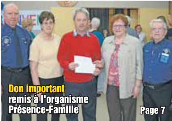
Don important remis à l'organisme Présence-Famille Page 7