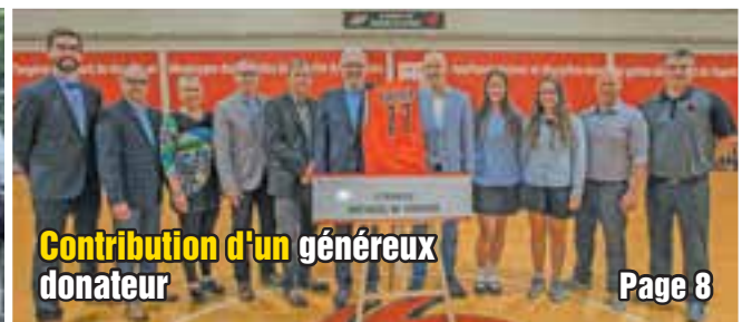
Contribution d'un généreux donateur Page 8