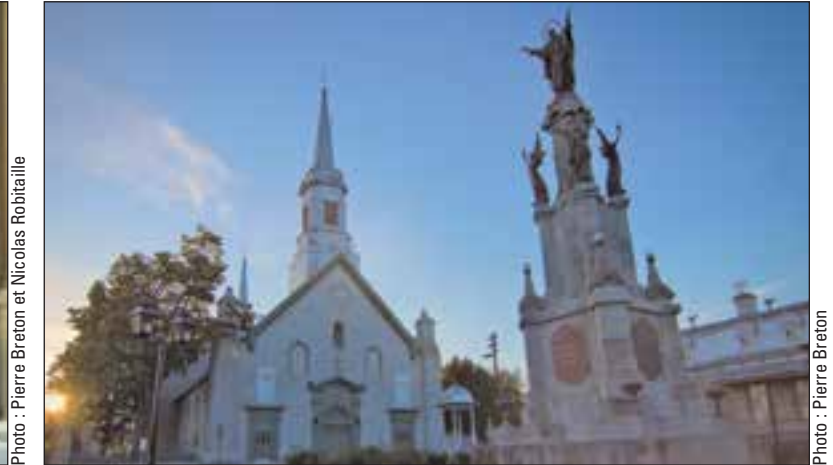
L'église de la ville de Saint-Augustin-de-Desmaures.