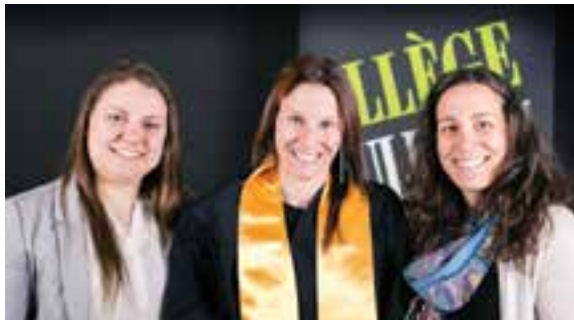
ASSURANCE DE DOMMAGES ET EXPERTISE EN SINISTRES

Les quelques 250 diplômés du Collège O'Sullivan ont été conviés à la Soirée des finissants 2017, le 16 juin dernier, à la salle de bal du Hilton Québec. Lors de cette occasion, une quinzaine de bourses ont été décernées à des étudiants qui ont su se démarquer par leur savoir-être, leur persévérance, leurs résultats et leur attitude tout au long de leur formation. Plus de 400 personnes étaient présentes afin de féliciter et d'encourager les finissants dans leur projet respectif.