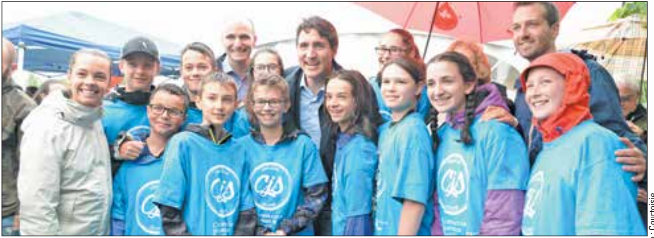
Le premier ministre du Canada, Justin Trudeau, a fait un passage remarqué et grandement apprécié par les citoyens de Saint-Augustin-de-Desmaures.

L'évènement a été présenté en collaboration avec la Caisse Desjardins de Saint-Augustin, commanditaire officiel, Proludik et Sélection Saint-Augustin. Les employés de la ville ont également collaboré, de près ou de loin, à la réussite de l'évènement. ■