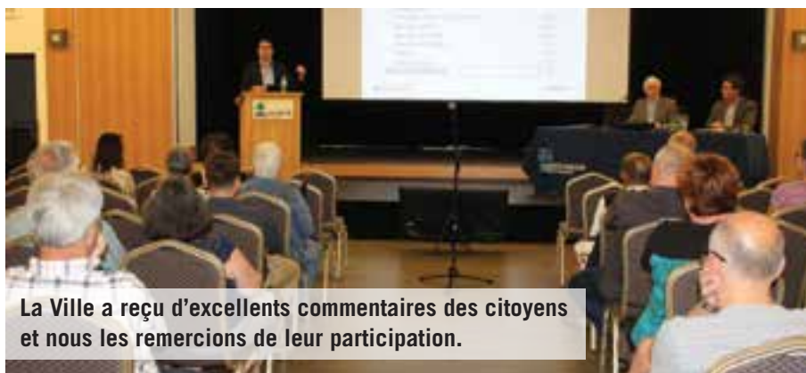
La Ville a reçu d'excellents commentaires des citoyens et nous les remercions de leur participation.