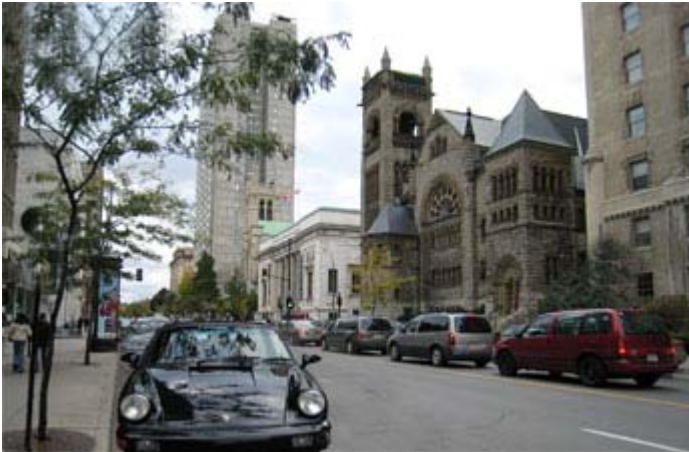
Rue Sherbrooke à Montréal

Le quartier du Musée à Montréal, mieux connu sous le nom de Golden Square Mile , essaie de regagner son lustre d'autrefois. Depuis les dernières années, plusieurs commerçants importants comme Cartier ont quitté ce secteur dû à l'absence de clientèle. Mais voilà que l'on veut changer cette situation et en particulier les responsables du Musée des Beaux-arts . L'acquisition d'une ancienne église permettra notamment de créer une sorte de triangle entre trois de leurs édifices.