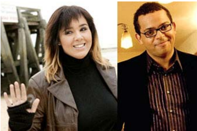
Chimène Badi et Gregory Charles