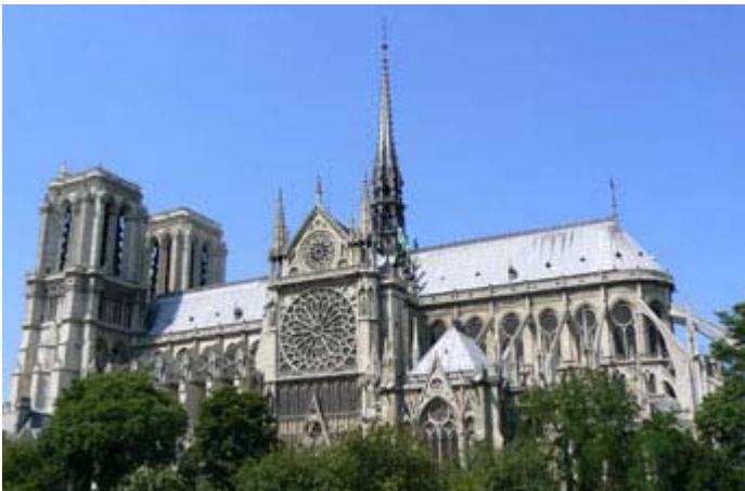
Cathédrale Notre-Dame de Paris

La visite des églises en France est devenue une activité touristique. On compte près de 100 églises uniquement dans la ville de Paris. «Visiter Notre-Dame de Paris c'est comme entendre une symphonie de la pierre» disait Victor Hugo. Le journal The New-York Times a récemment publié un magnifique