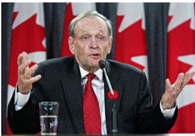
Jean Chrétien - Ex-Premier ministre du Canada

L'ex-Premier ministre du Canada, Jean Chrétien , ne veut pas être en reste devant ses collègues chefs