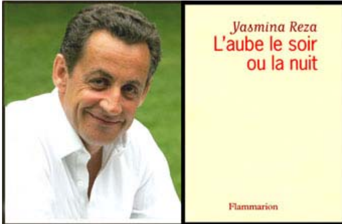
Nicolas Sarkozy - Président de France

Le livre de l'heure en France et à lire par tous ceux que la vie politique intéresse " L'aube le soir ou la nuit " par Yasmina Reza.