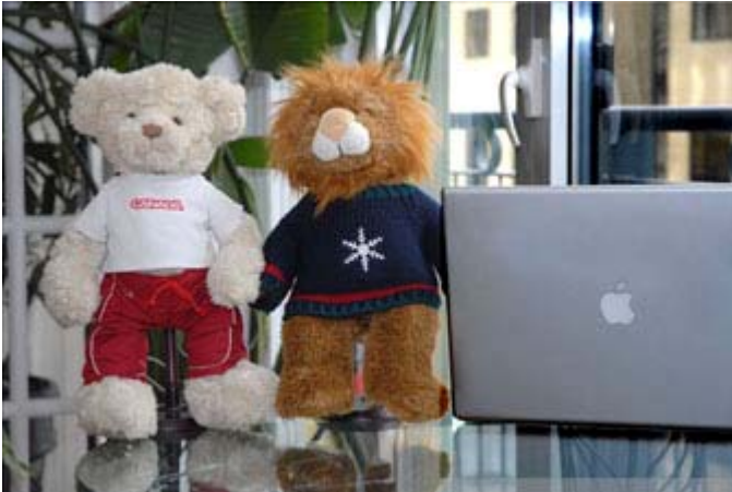
Miss Gym et Monsieur X