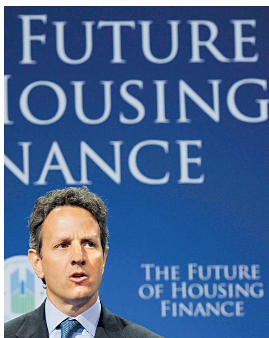
Le secrétaire américain au Trésor, Timothy Geithner