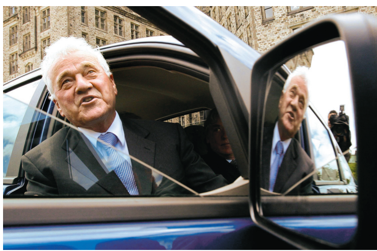
Frank Stronach, fondateur de Magna International

L'entente est cependant contestée par une minorité d'actionnaires estimant que la prime versée à M. Stronach est trop élevée, contrairement aux autres actionnaires, qui croient qu'elle aura pour effet d'ac-