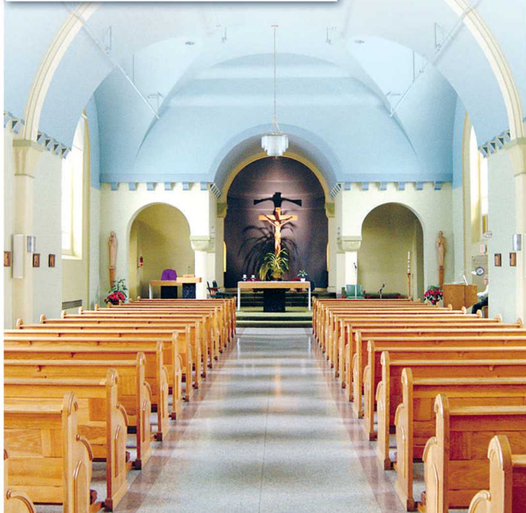
Chapelle, Domaine du Château de Bordeaux