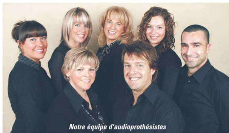
Notre équipe d'audioprothésistes