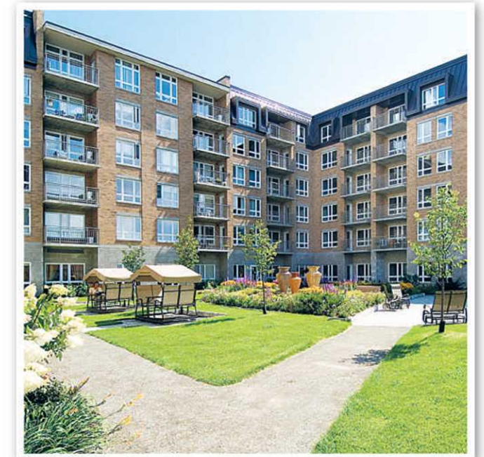
Cour intérieure, Les Appartements du Château de Bordeaux

Chartwell-Québec fait partie de Chartwell Senior Housing REIT qui représente le plus important réseau de résidences au Canada. Chartwell-Québec compte 25 résidences et héberge plus de 6500 personnes partout en province. Chartwell-Québec a pour mission de créer et d'administrer des communautés de résidences modernes, offrant une qualité de vie qui répond aux besoins des retraités. Les habitations évolutives pour retraités de Chartwell-Québec proposent une variété de styles de vie, incluant des résidences pour personnes autonomes, semi-autonomes et des résidences offrant des soins complets de longue durée.