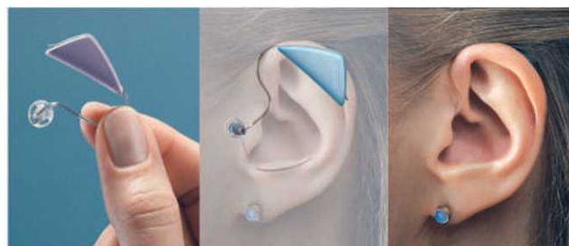
Prothèse avec technologie mains libres

Mais la technologie n'est qu'une partie du succès de l'appareillage. C'est ainsi que les audioprothésistes vous guideront pour faire le meilleur choix possible en tenant compte de vos besoins, de votre niveau de perte auditive, de vos goûts et de votre budget. Ensuite, ils veilleront à ce que vos appareils soient adaptés de la façon la plus précise possible et qu'ils répondent adéquatement à vos objectifs de communication.