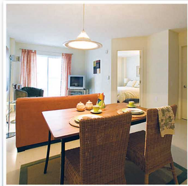
Appartement modèle, Domaine du Château de Bordeaux

On y retrouve des chambres, studios et appartements aménagés avec des cuisines complètes.