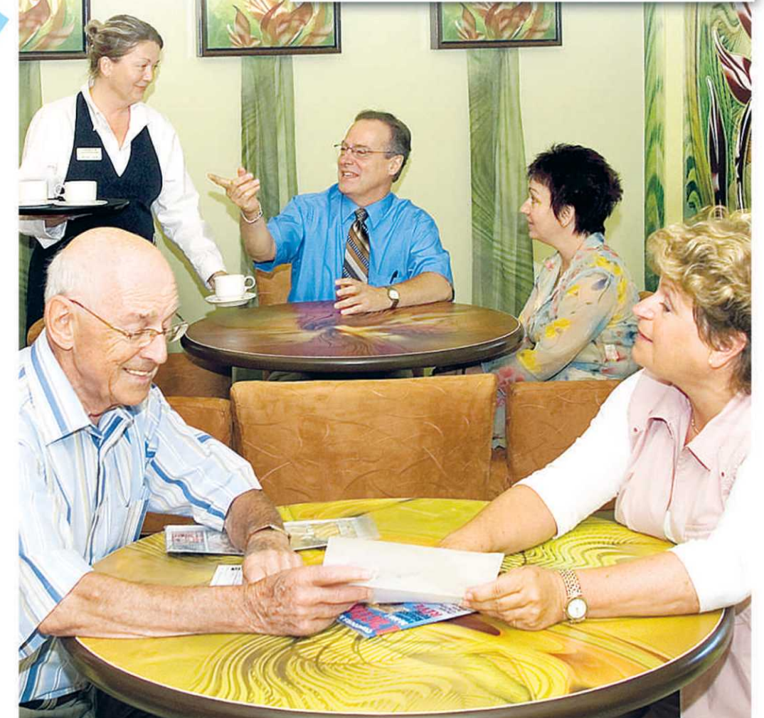
Café-bistro, Les Appartements du Château de Bordeaux