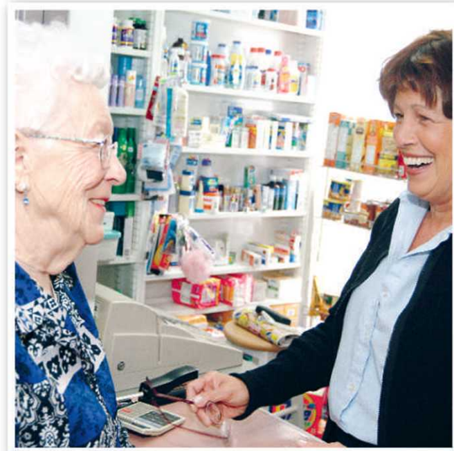
Comptoir pharmacie, Résidence Ste-Geneviève

Dans la région de la Capitale-Nationale, Chartwell-Québec est également propriétaire et gestionnaire de deux autres résidences, soit le Domaine du Château de Bordeaux, situé dans le secteur Sillery, ainsi que la Résidence Ste-Geneviève sise dans le secteur Neufchâtel. La dernière acquisition du groupe porte ainsi à plus de 500 unités de logements offerts à la population âgées dans la région.