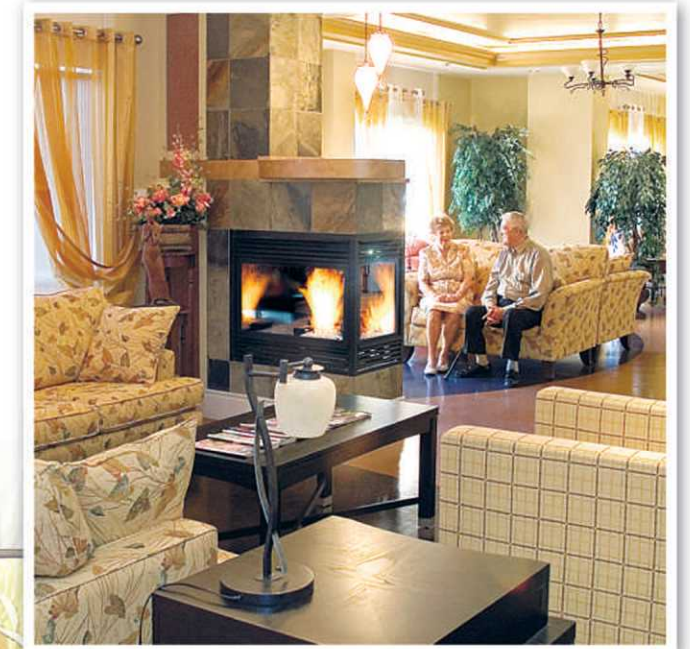
Grand salon, Les Appartements du Château de Bordeaux