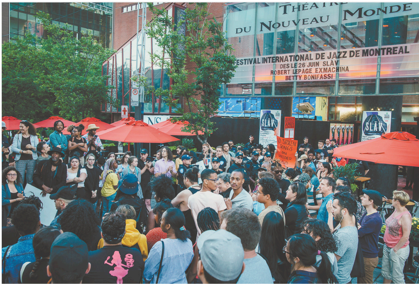
Mardi, des manifestants se sont invités à la soirée de première du spectacle SLAV, pour protester contre ce qu'ils ont dénoncé comme étant de l'appropriation culturelle. Depuis, le débat s'est poursuivi sur les réseaux sociaux.