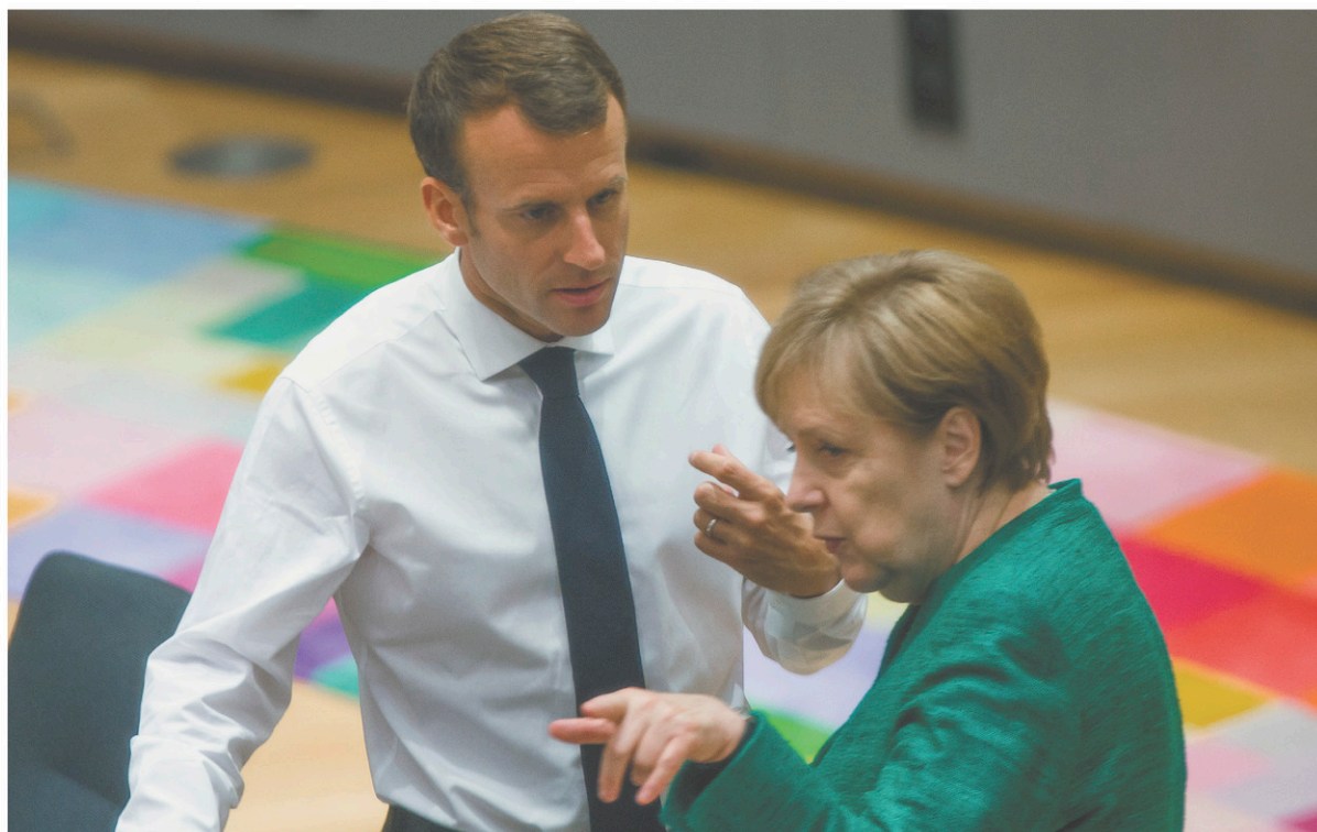
La semaine dernière, la chancelière a accepté une demande venant d'Emmanuel Macron de créer un budget de la zone euro, en échange d'une aide sur la question des migrants.

Les dirigeants de la CSU ont beau affirmer qu'il n'est pas question de rompre l'alliance historique avec la CDU, dans les couloirs du Bundestag on pense que cette éventualité n'est plus à écarter. Il faut dire que, depuis sa première élection en 2005, Angela Merkel a infléchi le programme de la CDU vers la gauche à un point tel que l'écart est aujourd'hui