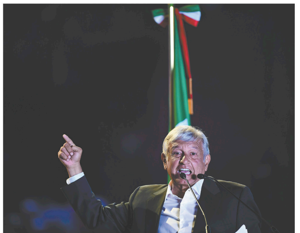
Celui que l'on surnomme AMLO s'adressait à une foule conquise d'avance mercredi.

Le président Enrique Peña Nieto et ses prédécesseurs contemporains laissent derrière eux un pays meurtri par une guerre du narcotrafic qui a fait plus de 200 000 morts et des milliers de disparus. 133 personnes — dont des candidats — ont été assassinées au cours des huit derniers mois, selon la firme mexicaine d'analyse de risque Etelekt. Plus de 53 millions de Mexicains vivent dans la pauvreté, et la corruption endémique, qui gangrène aussi bien les hautes sphères du pouvoir que le policier qui remet les constats d'infraction, semble incurable. Arpentant sans garde du corps les coins les plus reculés des campagnes mexicaines, le candidat du Tabasco, État du sud du Mexique, a promis de remédier à tous ces problèmes en démantelant la « mafia du pouvoir ». « Andrés Manuel a