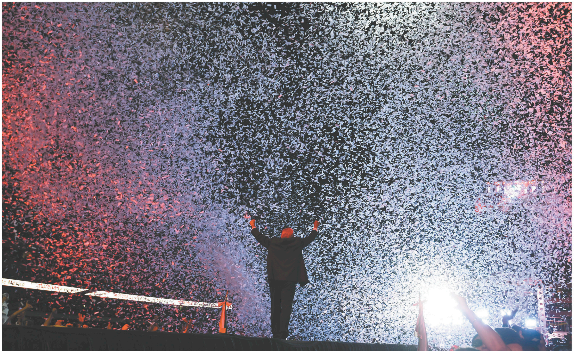
Mercredi soir, pour souligner la fin de sa campagne électorale, Andrés Manuel López Obrador a tenu un grand rassemblement au stade Azteca — le plus vaste de la capitale.

IDÉES Des raisons de renommer le prix Sir- John-A.-MacDonald B 9