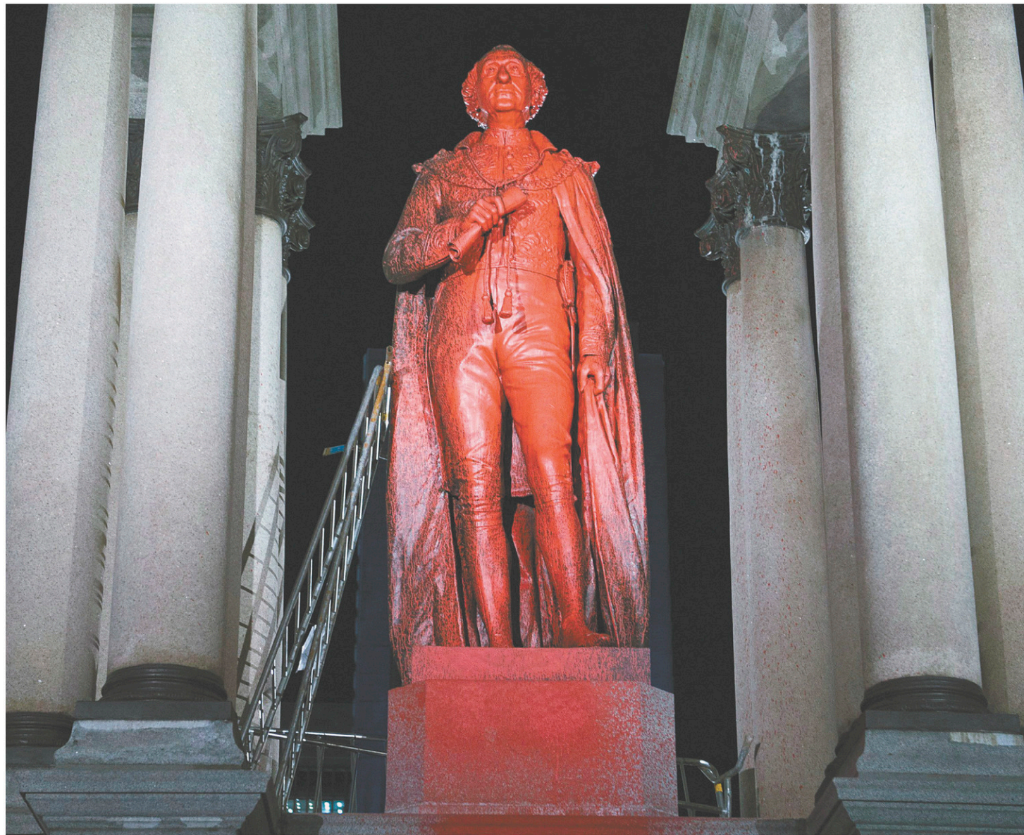
Une statue de John A. Macdonald avait été recouverte de peinture rouge sur la place du Canada, à Montréal, en novembre dernier.