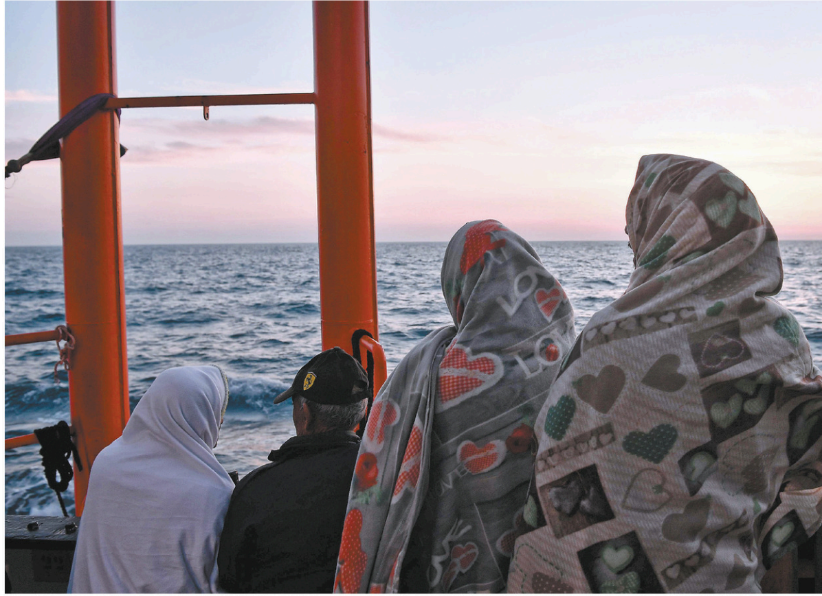
Un nouveau drame est survenu vendredi : trois bébés sont morts et une centaine de personnes sont portées disparues après le naufrage d'un canot pneumatique au large des côtes libyennes.

« L'Italie n'est plus seule », s'est réjoui le chef du gouvernement populiste italien, Giuseppe Conte, après les « conclusions » du sommet approuvées à l'unanimité à 4 h 30 du matin, au bout de neuf heures de tractations tendues.