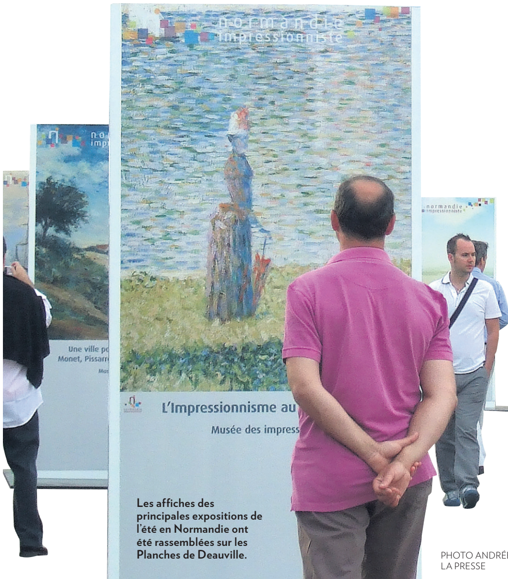
Les affiches des principales expositions de l'été en Normandie ont été rassemblées sur les Planches de Deauville.