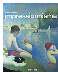
Impressionnisme (de Karin H. Grimme, éditions Taschen, 96 pages, 13,95 $). C'est complet sans être indigeste.

Normandie Carto (éditions Gallimard, 15,95 $). J'adore les guides de la collection Carto. Ils sont légers, précis et faciles à consulter.