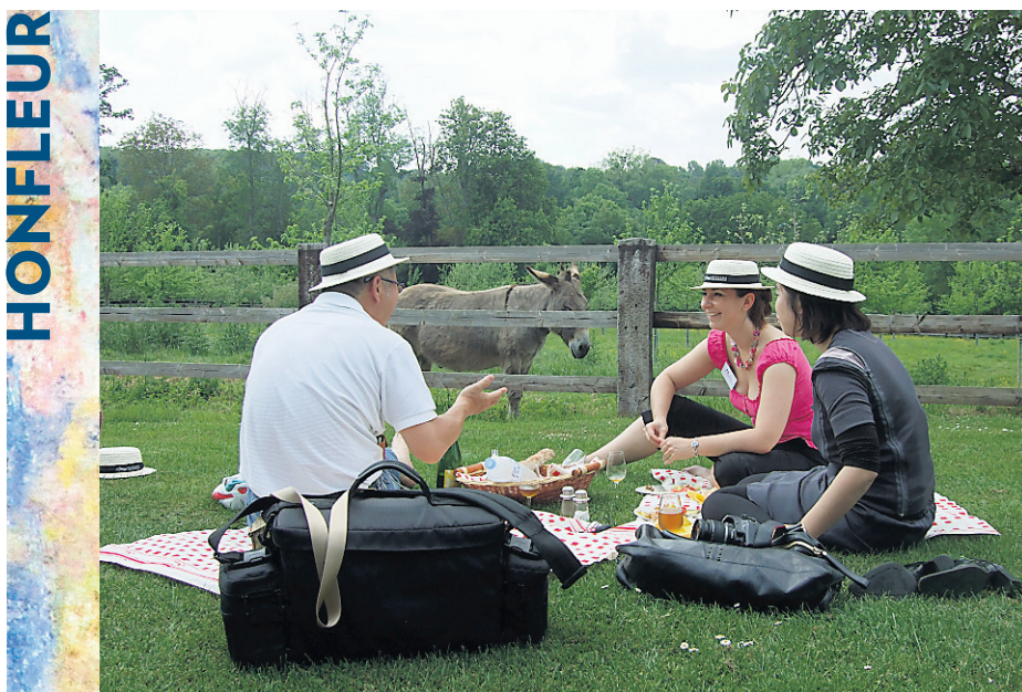
Un pique-nique au Domaine d'Apreval.