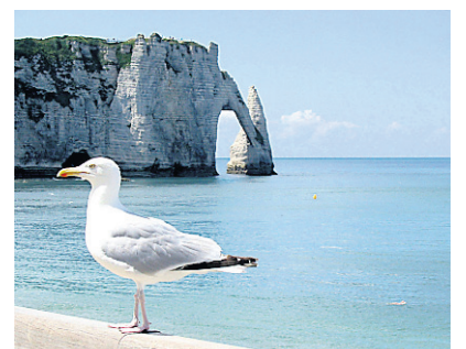
La falaise d'Étretat.

Près du port, le musée Malraux, tout en verre et en acier, compte l'une des plus belles collections impressionnistes en dehors des musées parisiens. Plusieurs des tableaux ont été achetés directement des peintres par l'amateur d'art havrais Olivier Senn, dont la collection a été offerte au musée par sa petite-fille. Le musée possède aussi 70 œuvres de Raoul Dufy, né au Havre.