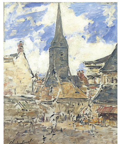
Le clocher Sainte-Catherine, peint vers 1867 par Monet.