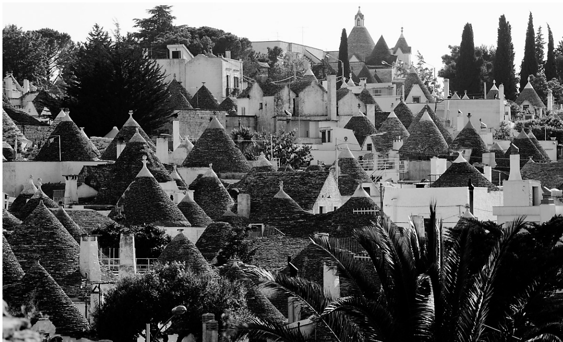
Les trulli d'Alberobello.

Cela dit, même si vous disposez de trois semaines, ce sera à peine suffisant pour avoir un bon aperçu des Pouilles, du nord de la Calabre, de la Basilicate et de la côte Amalfitaine. Je vous conseille donc vivement de réserver la Sicile (qui mériterait trois semaines à elle seule) pour un autre voyage. Comme il y a énormément de choses à voir dans les Pouilles, il faudra vous limiter aux plus intéressantes qui, outre le Gargano, sont, à mon avis, la région des trulli , ces espèces de huttes circulaires à toit conique construites avec les cailloux récupérés dans les champs, et la ville de Lecce, dans le talon de la botte. C'est le village d'Alberobello, qui abrite la plus grande et