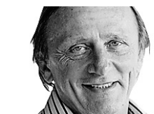
ANDRÉ DÉSIRONT COLLABORATION SPÉCIALE

Q Mon conjoint et moi prévoyons visiter le sud de l'Italie du 18 septembre au 5 octobre. Nous avons acheté des billets d'avion aller-retour pour Naples et allons réserver une voiture. Au programme, nous avons inscrit la côte Amalfitaine, y compris l'île de Capri, les Pouilles, peut-être la Basilicate et le nord de la Calabre. Nous avions aussi pensé à la Sicile: pensez-vous que ce serait trop? Est-il préférable de débiter ou de terminer par la côte Amalfitaine? Nous envisageons de dormir dans des gîtes: devrions-nous les réserver tous avant notre départ? Combien de temps recommandez-vous de passer dans chacune de ces régions? Quels sont les endroits à visiter absolument? Quelles plages de la mer Adriatique et quelles randonnées nous recommanderiez-vous? — Claudette Boulet