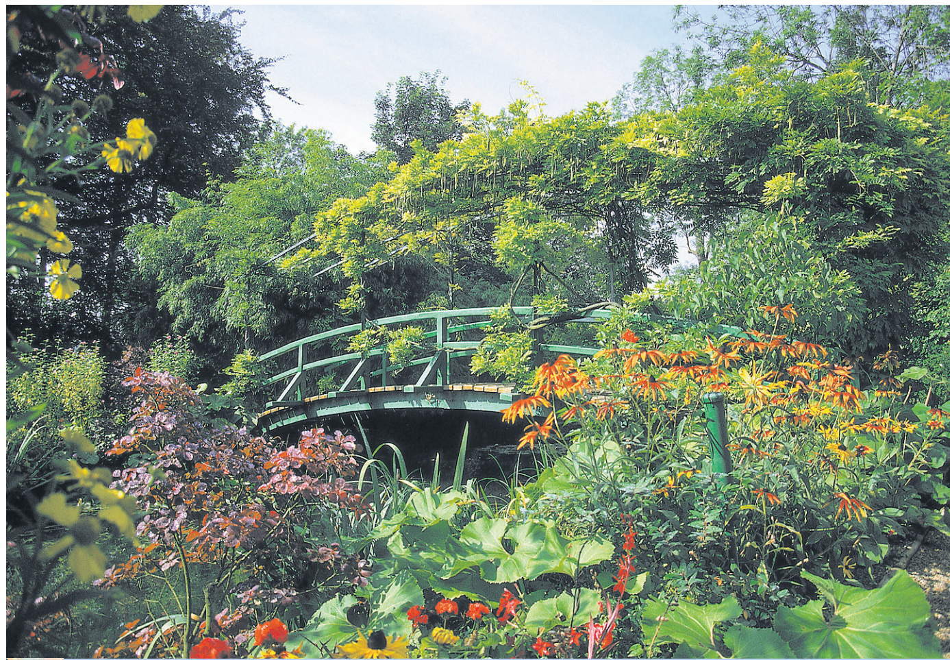
Le célèbre pont japonais du jardin de Monet, à Giverny.