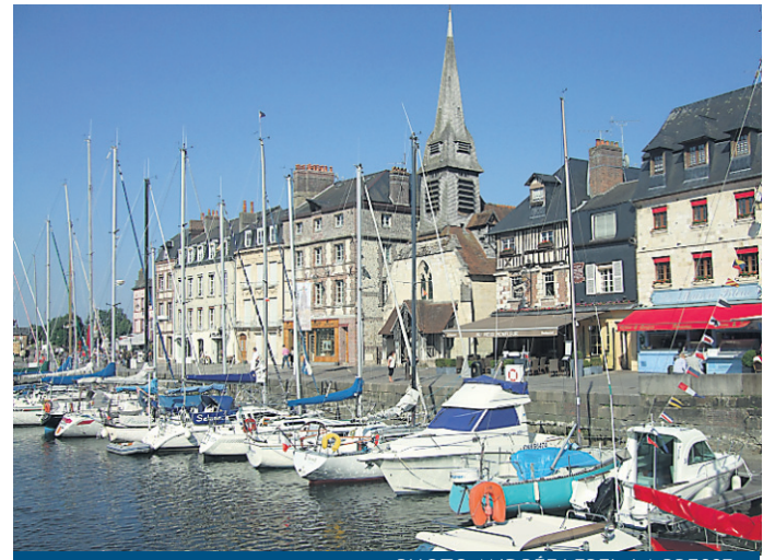
Le Vieux Bassin de Honfleur.

Voici les principales étapes d'un parcours impressionnant.