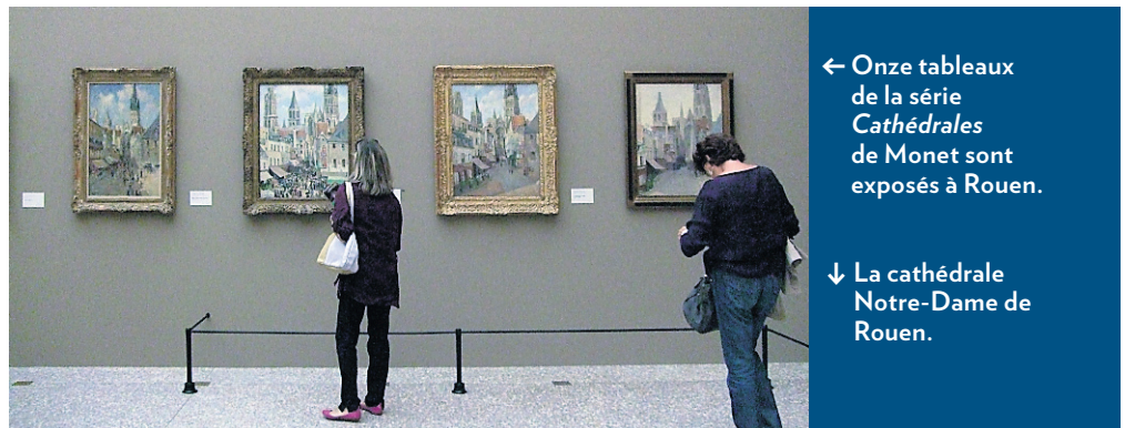
← Onze tableaux de la série Cathédrales de Monet sont exposés à Rouen.

Le Vieux Rouen est très pittoresque autour de la rue du Gros Horloge et les vitraux de l'église Sainte-Jeanne-d'Arc sont l'un des plus beaux ensembles d'Europe. On peut aussi se rendre à La Bouille, dont le nom revient souvent dans les titres des peintures. À partir de ce charmant petit village, on offre des croisières d'une heure et demie jusqu'à Duclair. Ce trajet sur l'une des plus belles boucles de la Seine m'a permis de comprendre la passion de Sisley et de Pissarro pour les reflets argentés qui dansent sur l'eau et les lumières diffuses qui enveloppent la vallée de la Seine.