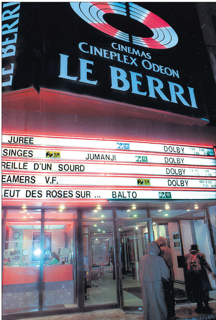
Dans notre photo de gauche, le Cinéma Berri, en 1996. La même salle, aujourd'hui, est sur le point d'être rénovée. L'actuel sous-sol du Berri abritera 680 sièges et le rez-de-chaussée servira de balcon avec 104 sièges, pour un total de 784 places assises. À l'étage, la discothèque accueillera 693 personnes avec permis de danse, bar et spectacle.