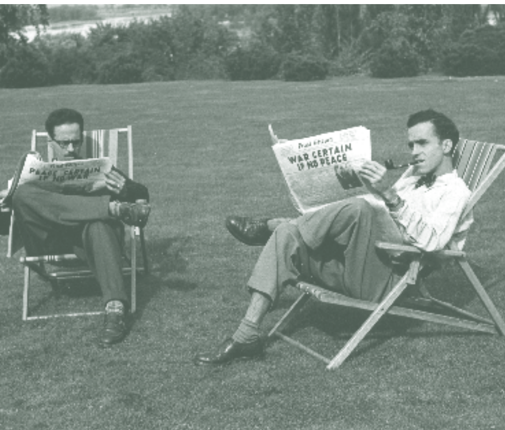
Voisins de Norman McLaren