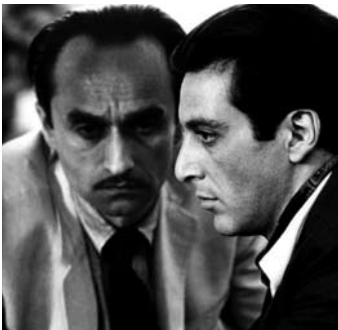
The Godfather de Francis Ford Coppola