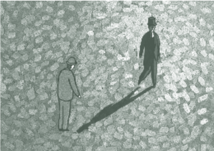
Exiled de Johnnie To L'Homme sans ombre de Georges Schwizgebel