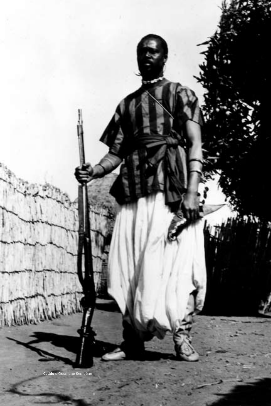
Ceddo d'Ousmane Sembène