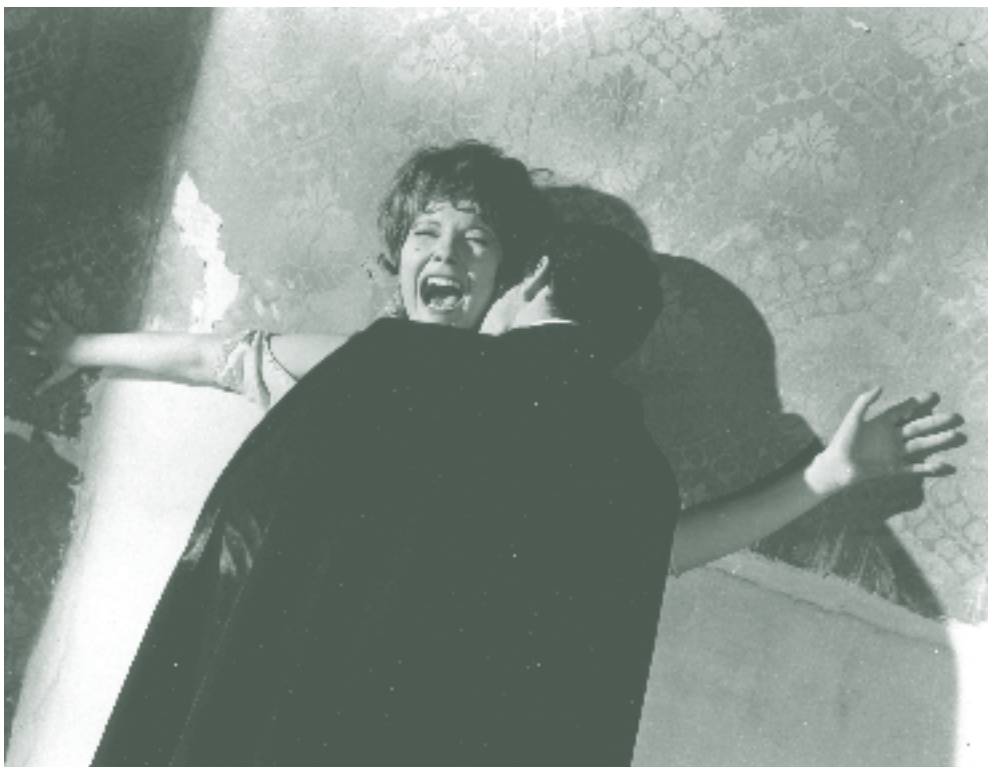
L'Horrible Docteur Orlof de Jesus Franco