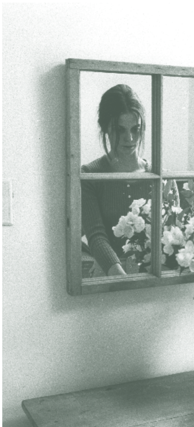
On est loin du soleil de Jacques Leduc