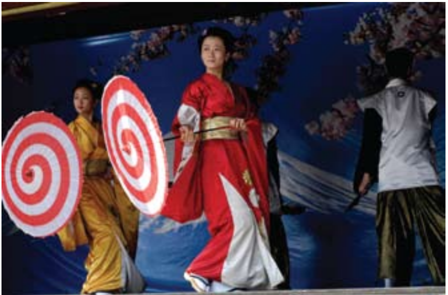
The World de Jia Zhang-ke