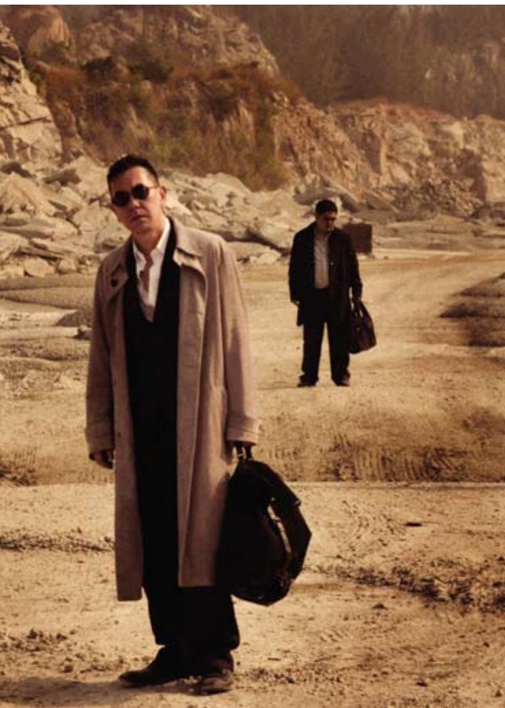
Exiled de Johnnie To