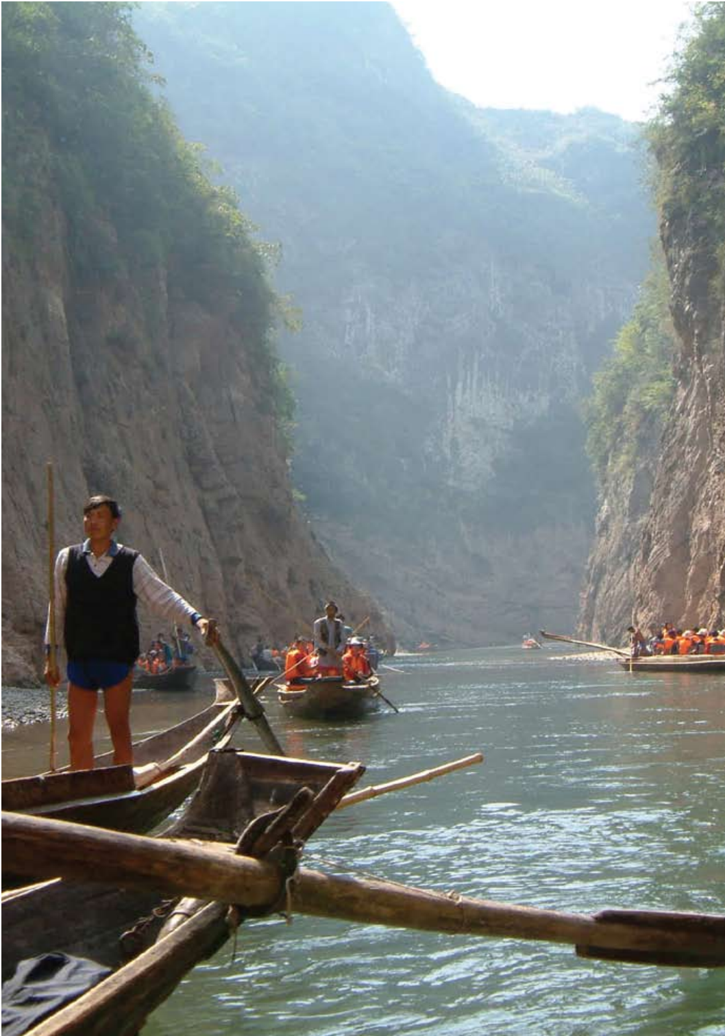
Up the Yangtze de Yung Chang