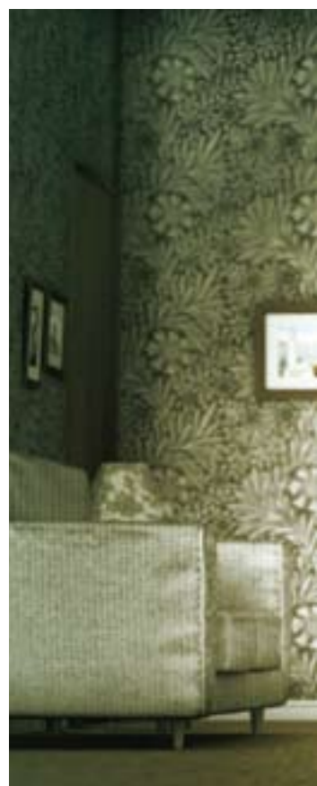
Les États nordiques de Denis Côté