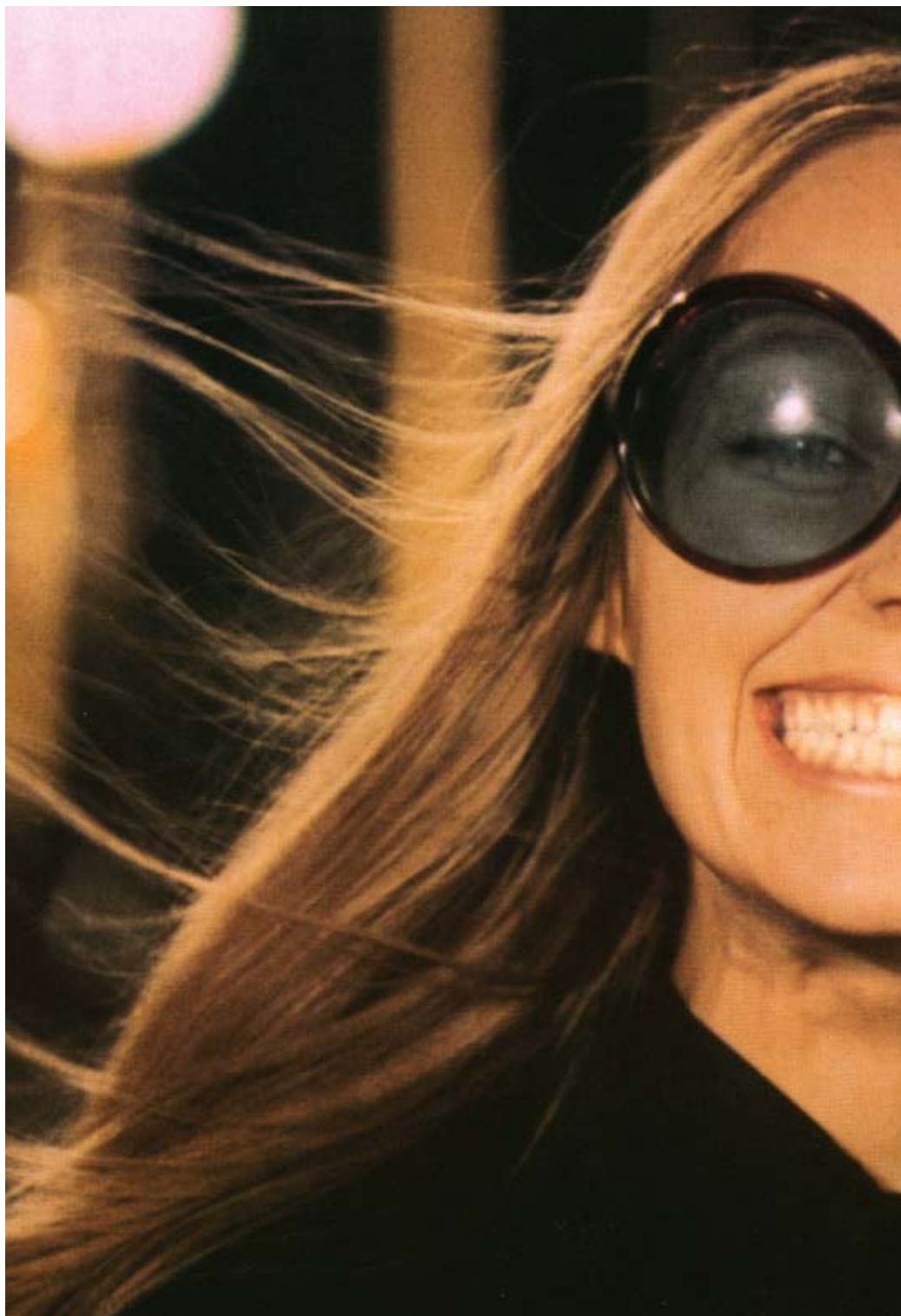
Roly Poly d'Andrzej Wadja