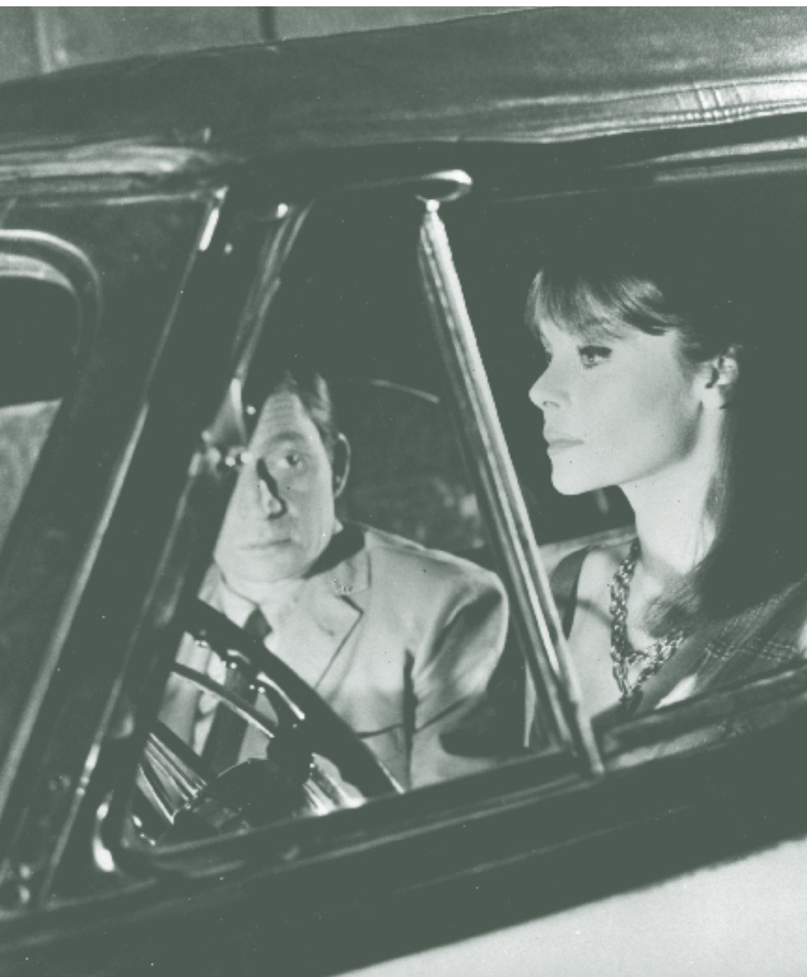
L'immortelle d'Alain Robbe-Grillet