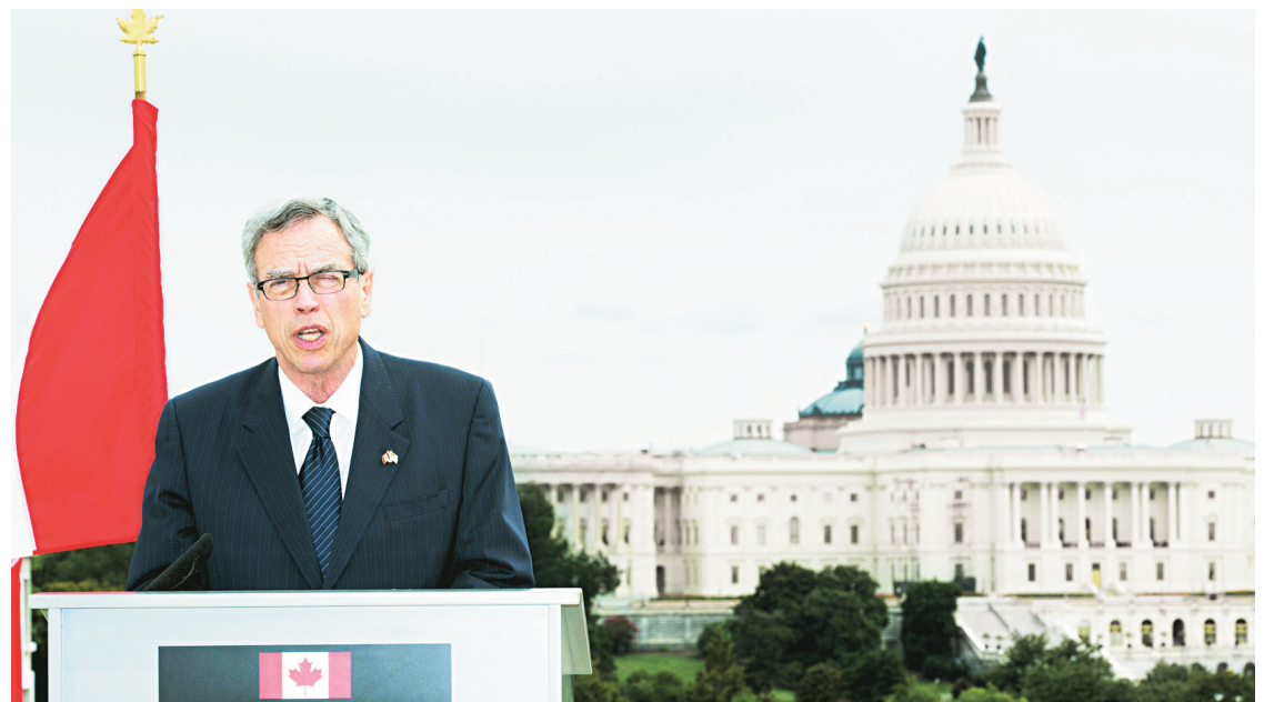
Le ministre canadien des Ressources naturelles, Joe Oliver, a rencontré lundi, à Washington, le secrétaire d'État à l'Énergie, Ernest Moniz, afin de discuter des dossiers énergétiques.

Renaud Gignac et Bertrand Schepper ont refusé de privilégier l'oléoduc au chemin de fer pour le transport du pétrole des sables