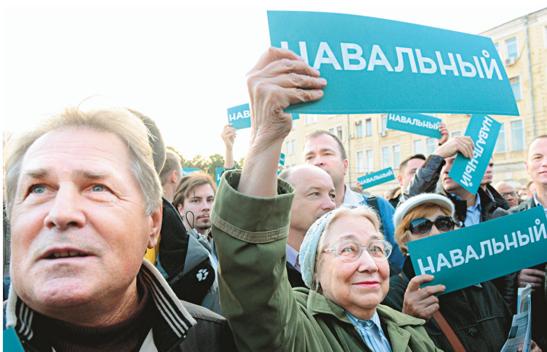
Des partisans d'Alexeï Navalny se sont rassemblés lundi à Moscou.

Dmitri Orechkin, un politologue qui a participé à la coordination d'observateurs indépendants, a estimé que des fraudes étaient plausibles. « Sobianine a obtenu aux alentours de 50% et un point de pourcentage de plus ou de moins avait pour lui une im-