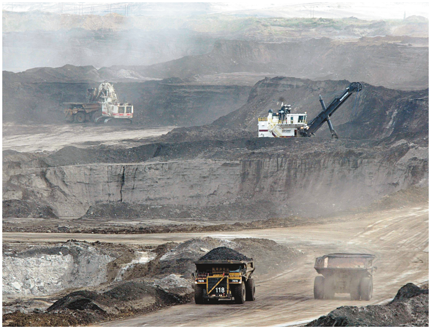
Le pétrole des sables bitumineux de l'Alberta est beaucoup plus polluant que celui que se procure actuellement le Québec, en Algérie et en mer du Nord notamment, selon l'IRIS. Et, à long terme, il ne représente pas une bonne affaire pour le Québec, disent les chercheurs.