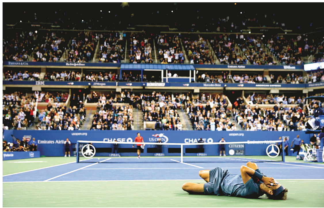
Rafael Nadal réagit à sa victoire... sur le sol de Flushing Meadows.