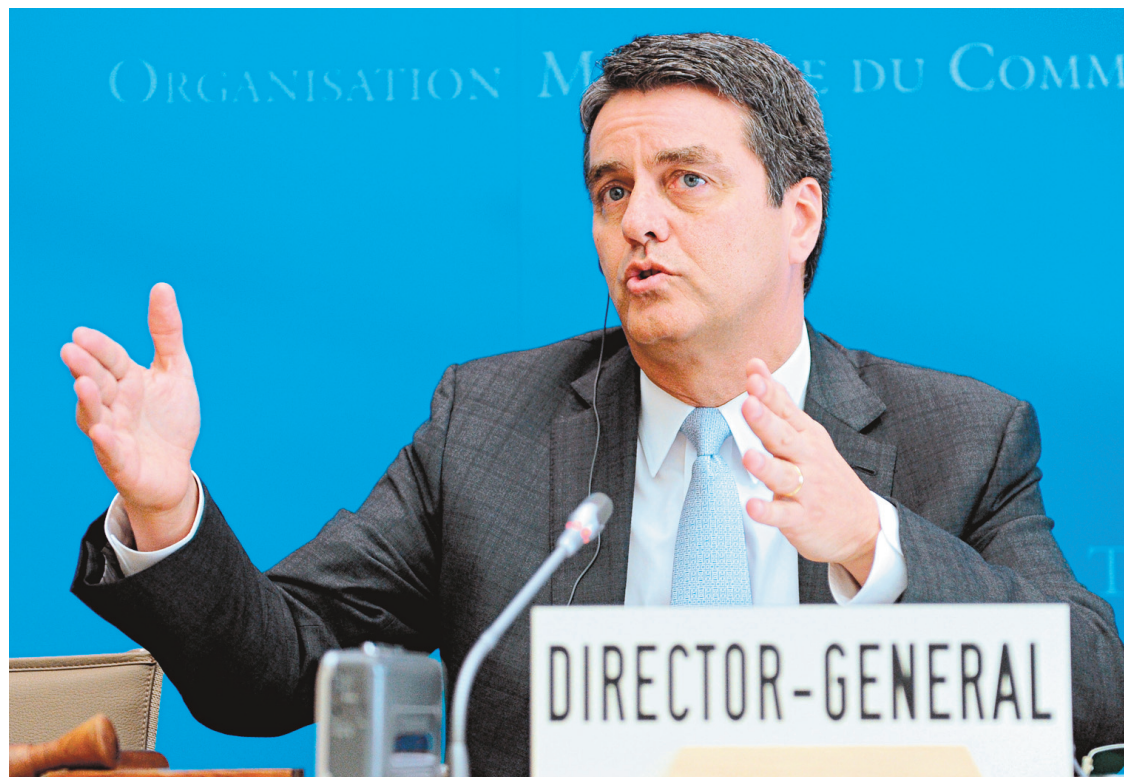
Roberto Azevêdo, le successeur de Pascal Lamy à la tête de l'Organisation mondiale du commerce