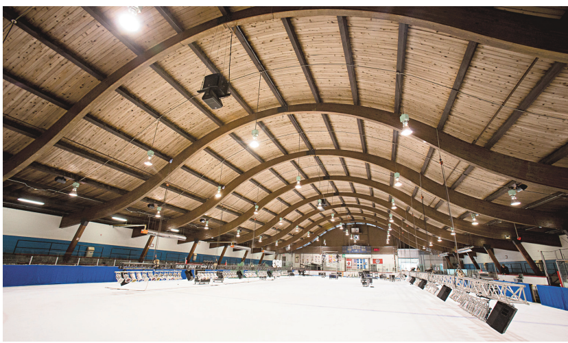
FRANÇOIS PESANT LE DEVOIR

Trois options de chantier ont été présentées aux citoyens, et toutes prévoient conserver la structure particulière du toit.