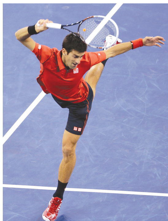
Novak Djokovic, qui a bataillé dur, préconise le même style de jeu que Rafael Nadal, qui consiste à tenter d'attraper chaque balle.

Il s'agissait du 37 e duel entre les deux joueurs — le plus haut total entre deux hommes dans l'ère moderne — et de leur troisième finale aux Internationaux des États-Unis en quatre ans. Nadal a défait Djokovic pour s'emparer du titre en 2010, et le Serbe a obtenu sa revanche en 2011. Ils se connaissent bien, et préconisent un style de jeu similaire qui consiste à tenter d'attraper chaque balle, mais au bout du compte, c'est l'Es-