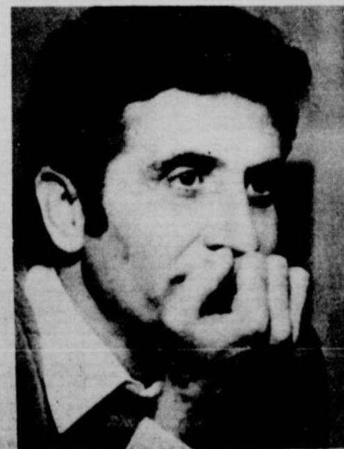
GILBERT BECAUD ...vacances en famille