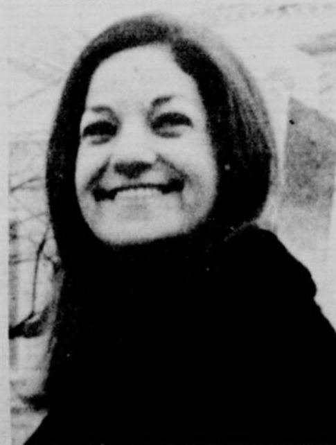
FRIDA BOCCARA ...spectacle de clôture

C'est la merveilleuse chanteuse Frida Boccara qui clôturera la saison des Concerts d'été de la Banque de Montréal, présentés avec la collaboration de CKAC. Mlle Boccara apparaîtra sur la scène de la salle Wilfrid-Pelletier les 15, 16 et 17 août et c'est Léon Bernier qui dirigera, à cette