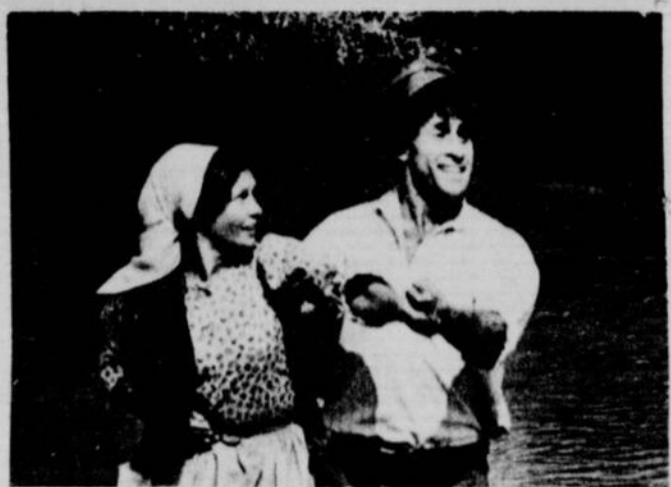
C'est ici une danse en pleine nature, prélude à un grand amour, entre la fille de Tevye et ce même étudiant.