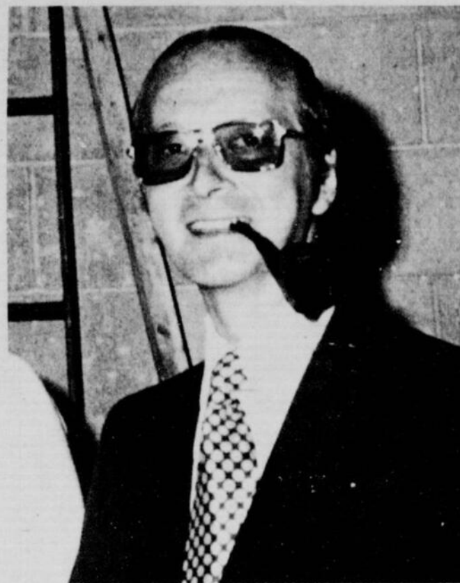
Pas de quoi inquiéter ses amis.

"C'est donc loin du drame qu'on vous a raconté."