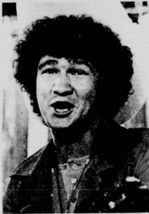
CHARLEBOIS ...à Longueuil

Andrée Champagne, son époux et leurs enfants quittent Montréal aujourd'hui, afin d'aller assister aux matches des Expos qui auront lieu à Philadelphie les 11, 12 et 13 août. La belle comédienne et chanteuse est absolument fascinée par ce sport qu'elle suit de très près, comme on peut le constater. Il va sans dire qu'avec son époux, elle parle toujours pour les Expos.