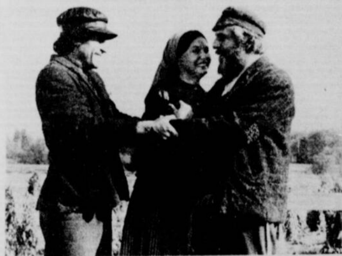
Tevye, laitier d'Anatevka, rompt avec la tradition et permet à sa seconde fille d'épouser un étudiant, alors qu'on ne l'a pas consulté, contrairement à la tradition juive.