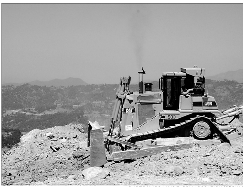
La mine est située dans les montagnes de l'ouest du pays, dans le département de San Marcos.