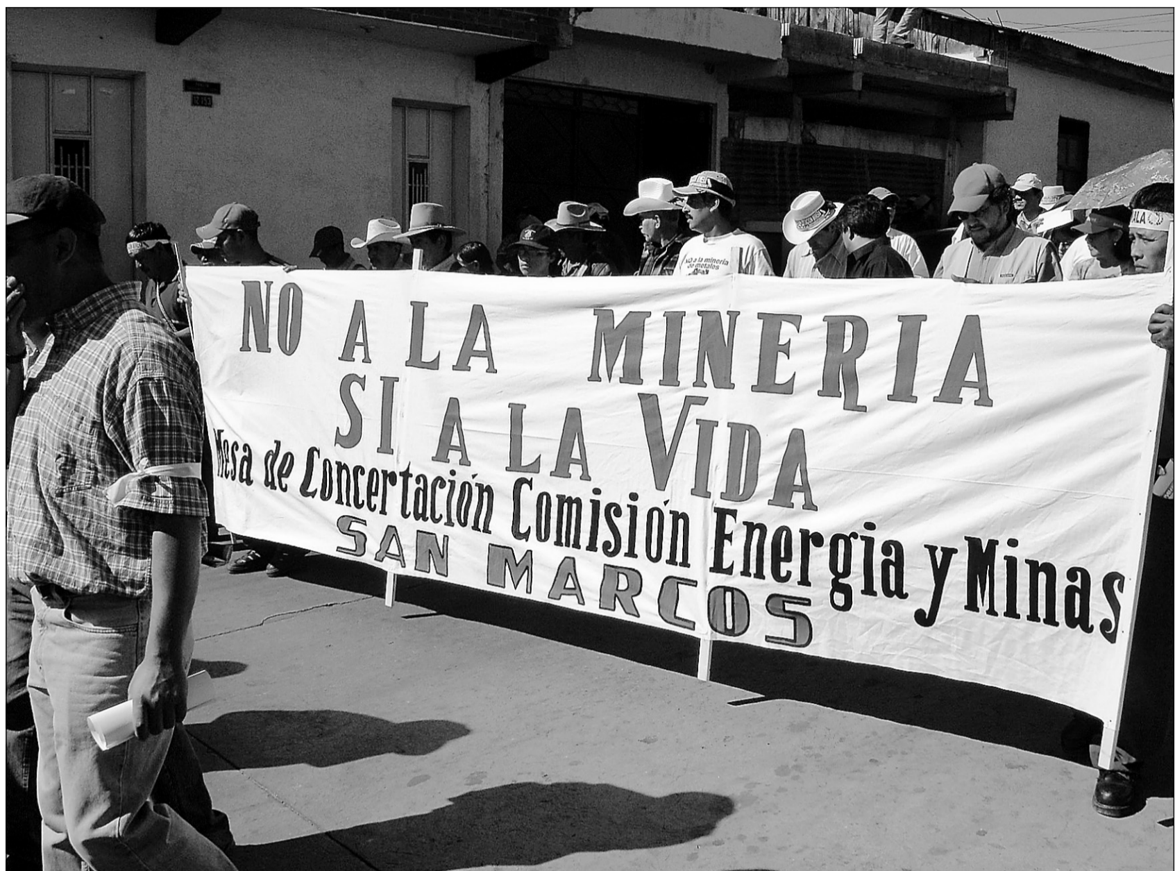
Le projet de mine canadien a déclenché toutes sortes de manifestations.

L'environnementaliste fait valoir que le Guatemala a signé la convention de l'Organisation internationale du travail relative aux droits des