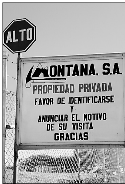
La compagnie canadienne Glamis Gold fait affaire au Guatemala sous le nom de Montana Exploradora.