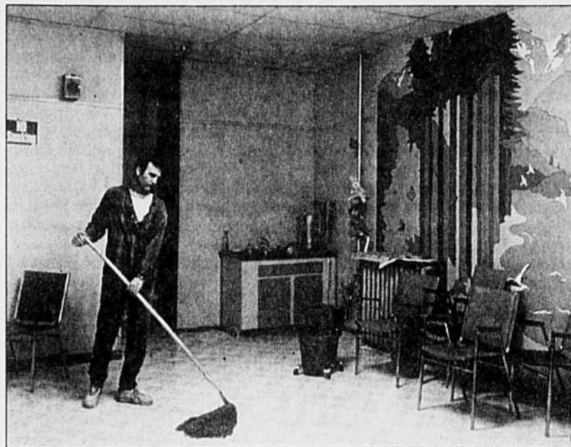
Volunteer, de Jeff Wall (1996)

Dans ces dernières années, conservant la manière qu'on lui reconnaît maintenant d'amalgamer en photographie des références aux grandes machines de la peinture classique, au cinéma et à la photographie, Wall s'est tourné du côté de la photographie en noir