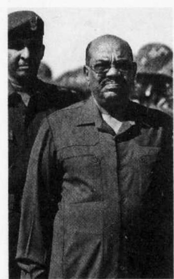
ZOHRA BENSEMRA REUTERS