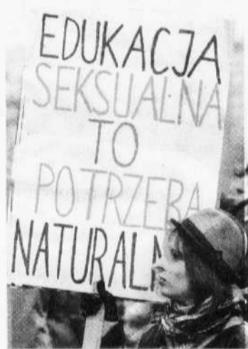
Manifestation en faveur de l'éducation sexuelle à l'école, à Varsovie

Quant au quotidien du Vatican, l'Osservatore Romano, il a célébré cette journée à sa façon en estimant que la machine à laver était l'un des objets qui a «le plus participé à l'émancipation des femmes occidentales au XX e siècle».