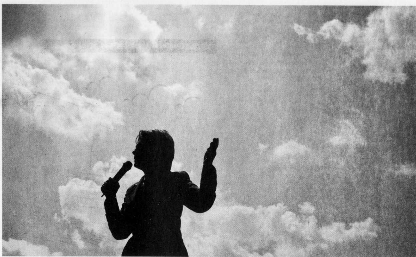
En cette période de crise financière, nous devons garder en mémoire la conclusion que nous livre une somme grandissante de travaux de recherche: la promotion de la femme est un investissement à fort rendement, débouchant sur une économie plus solide, une société civile plus florissante, des collectivités en meilleure santé et une paix et une stabilité accrues.

Dans trop d'endroits, on tolère encore aujourd'hui les «meurtres d'honneur», les sévices, la mutilation génitale et d'autres pratiques violentes et dégradantes exercées sur les femmes.