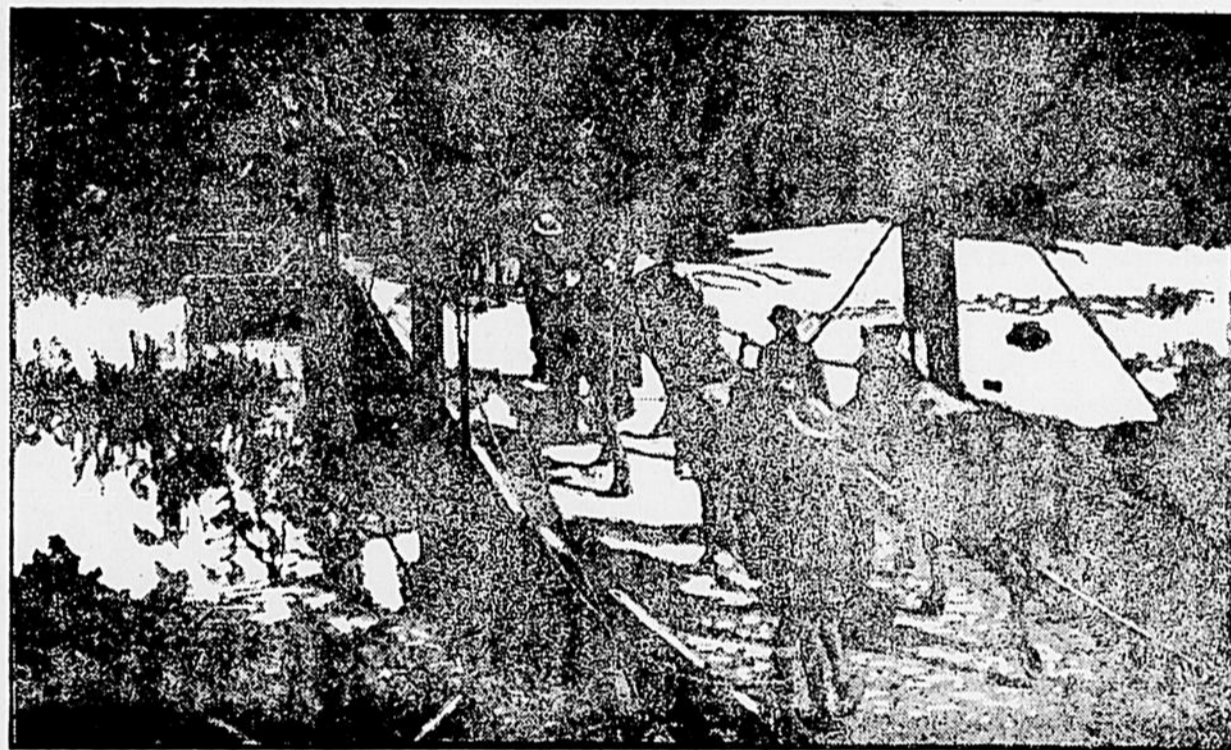
Artillerie traversant l'Yser dans les Flandres.