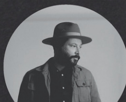
TIRE LE COYOTE