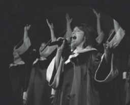
ENSEMBLE GOSPEL DE QUÉBEC

Horaire de la billetterie > les jeudis et les vendredis de 12h à 16h30