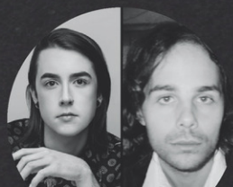
ELECTRIC NEON CLOUDS X VALENCE