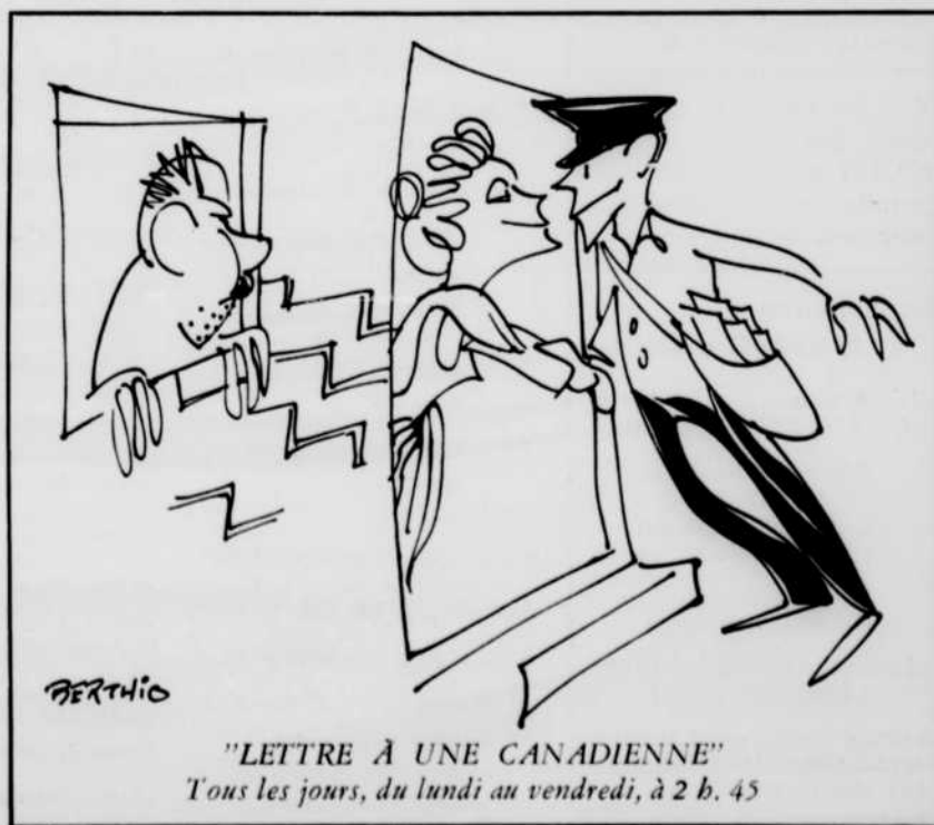
"LETTRE À UNE CANADIENNE" Tous les jours, du lundi au vendredi, à 2 h. 45

Pour compléter l'émission, on entendra un enregistrement d'une oeuvre de Mozart, Le roi berger .