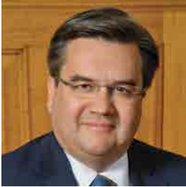
Denis Coderre Maire de Montréal