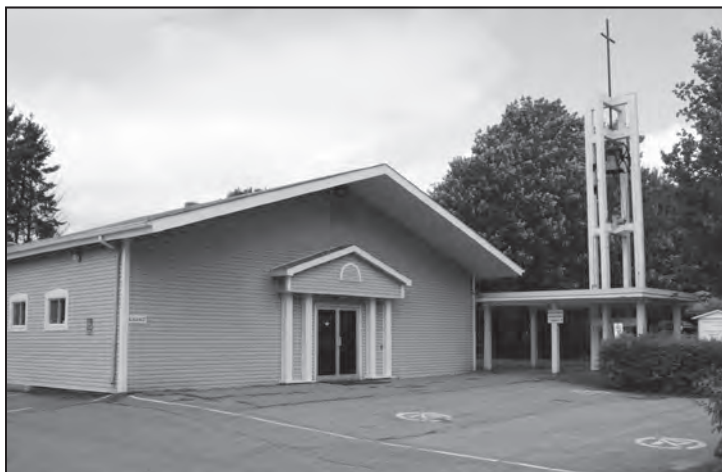
L'église actuelle sur la rue Thibault

Depuis lors, des prêtres de la Famille Marie-Jeunesse, installés à Lennoxville, y assurent un ministère. Le 1 er janvier 2011, la paroisse est réunie avec celles de Saint-Antoine-de-Padoue, de Saint-Joseph et de l'Immaculée-Conception-de-la-Très-Sainte-Vierge-Marie sous le nom de paroisse de la Bienheureuse-Marie-Léonie-Paradis. L'église du Précieux-Sang demeure cependant ouverte avec celle de l'Immaculée-Conception alors que les deux autres sont vendues.