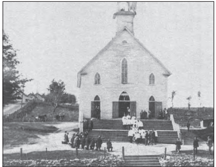
Ancienne chapelle du chemin Rodgers

Comme la construction de l'école primaire Jean-XXIII tarde et que le nombre d'enfants d'âge scolaire le justifie, la Commission