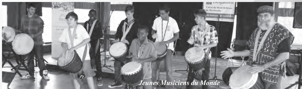
Jeunes Musiciens du Monde

Parc Belvédère de l'Arrondissement du Mont-Bellevue