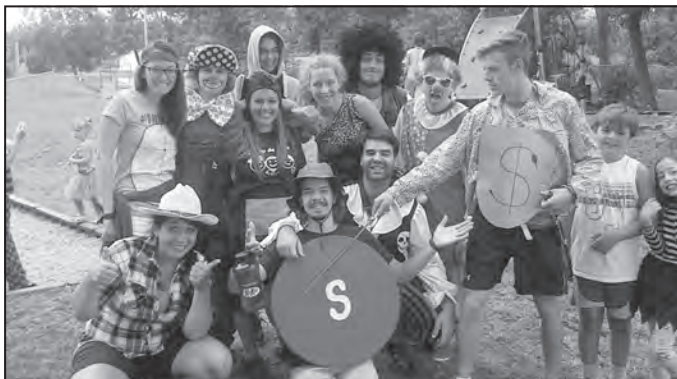
La dynamique équipe des animateurs de l'été 2014