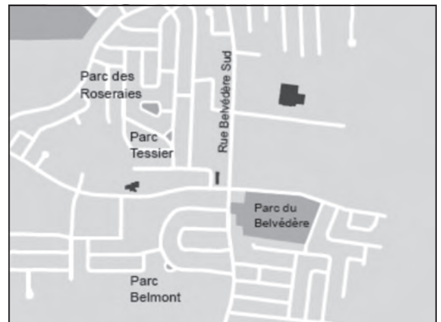
Carte du quartier Ascot