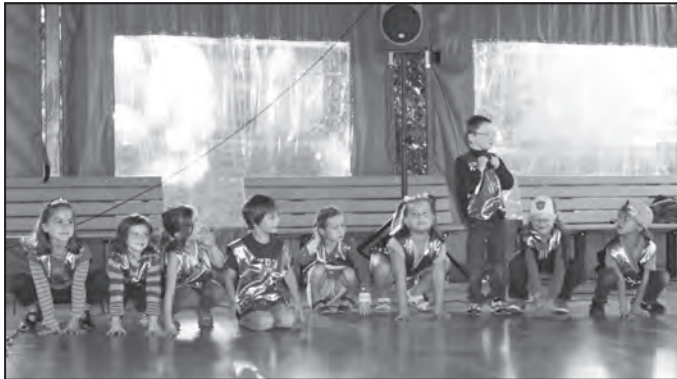
Spectacle de fin d'été... Bravo à toutes nos velettes!

Découvrez quelques moments forts de l'été 2014 :