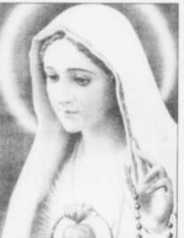
Prière à Marie, Reine des Coeurs

Souvenez-vous, O Notre-Dame-des-Sept-Douleurs, qu'on a jamais entendu dire qu'aucun de ceux qui ont eu recours à vous, implorer vos suffrages aient été abandonnés. Animé d'une pareille confiance, O Vierge des Vierges, j'accours vers vous, gémissant sous le poids de mes péchés, je me prosterner à vos pieds. Daignez, O Mère du Verbe, ne pas mépriser ma prière et daignez l'exaucer. Ainsi soit-il. En remerciement au Père Watier, de Gaspé, pour faveurs obtenus avec promesse de parution. Signé: A.B.T.