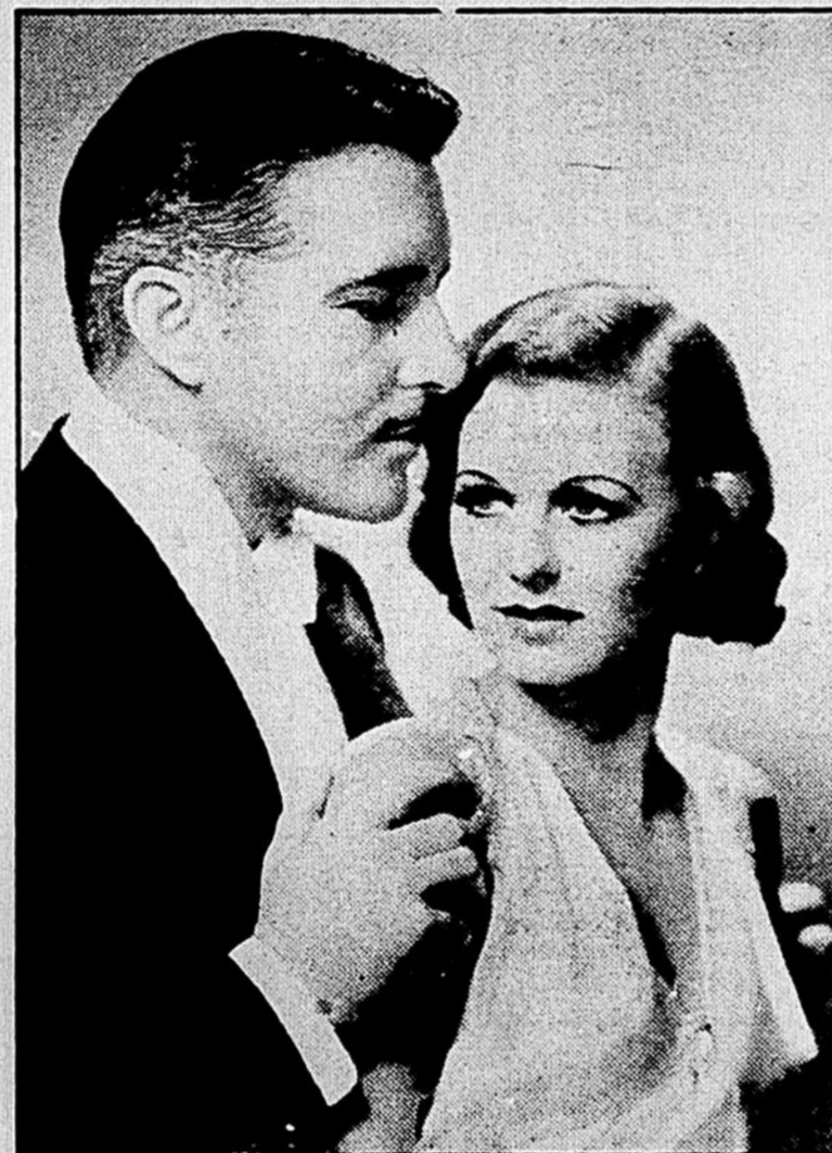
John Boles et Margaret Sullivan, en vedette dans "UNE NUIT SEULEMENT", version française du grand film "Only Yesterday", à l'affiche au Théâtre Impérial dès aujourd'hui, 18 janvier.