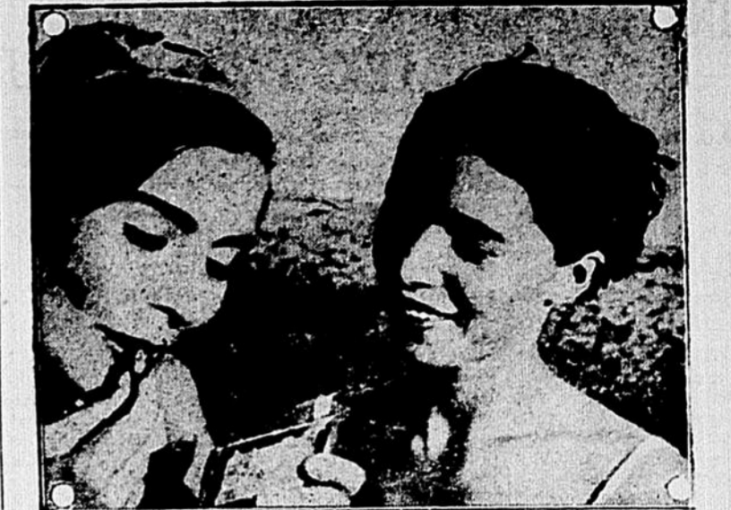
Deux jeunes sportives soviétiques, se refaisant une beauté avec du rouge sur les lèvres, après des exercices d'entraînement rigoureux.