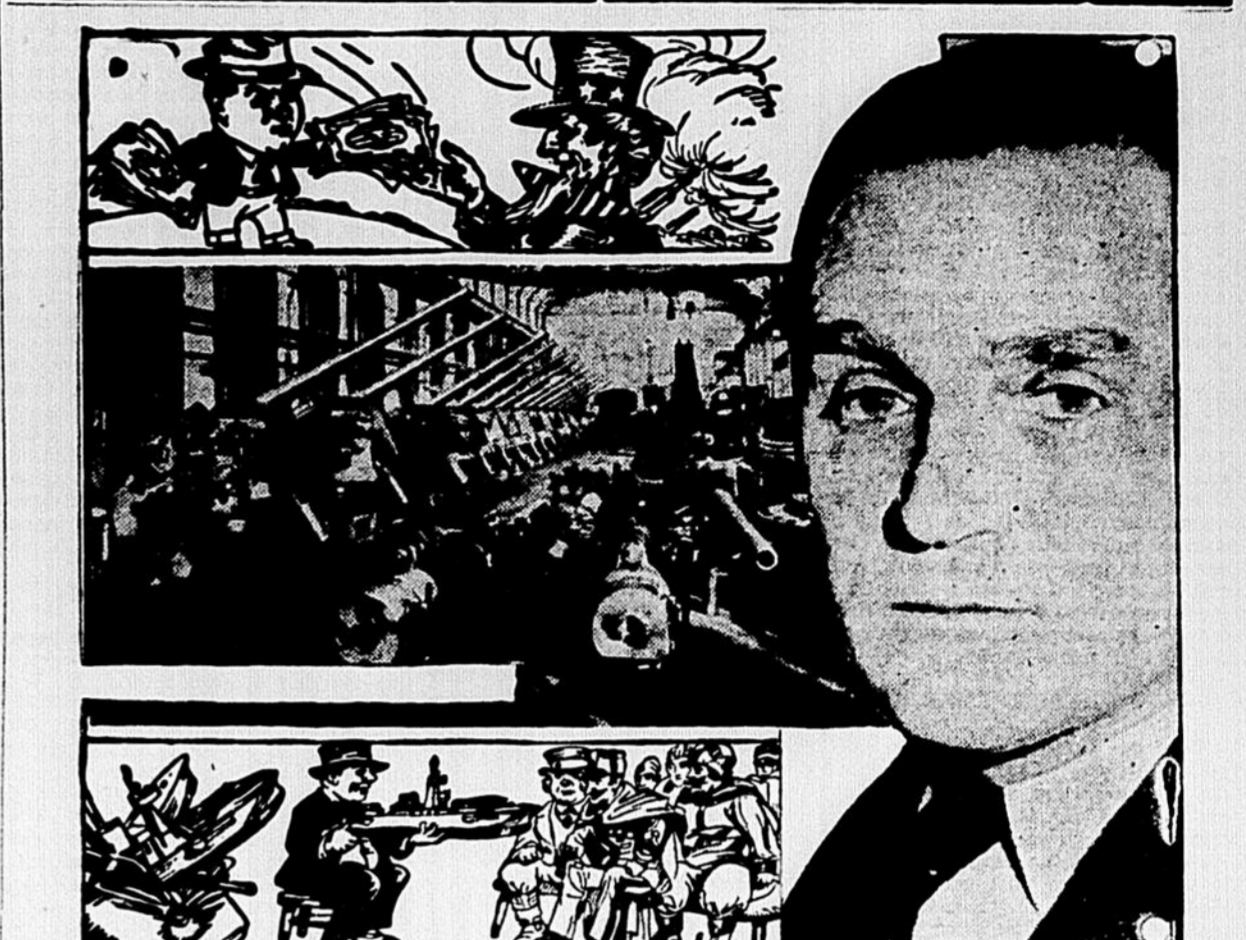
Le Sénateur Gerald N. Nye, après avoir commencé au Sénat américain une enquête sur les marchands de canons et de munitions (l'on voit ici une usine où se fabriquent ces joujoux) s'est lancé dans une charge à fond de train contre l'ex-président Woodrow Wilson.