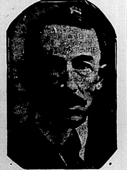
L'hon. Alexandre Taschereau, le "premier" du Québec.

UN SEUL SUJET A LA FOIS — "Ce n'est pas une question à laquelle il est facile de répondre. A l'école, j'étais consciencieusement d'être honnête et sincère avec moi-même et avec les autres. C'était là