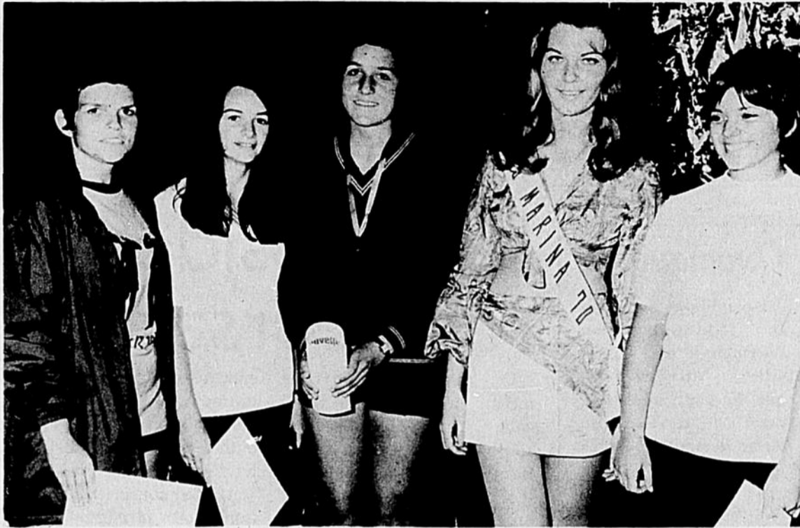
Plusieurs médailles et certificats furent remis à la suite des compétitions du Carnaval dans l'île. Un des groupes s'étant distingué entre autre, est la "Nouvelle-Dimension", au ballon-volant. Ce dernier s'en est tiré avec les honneurs