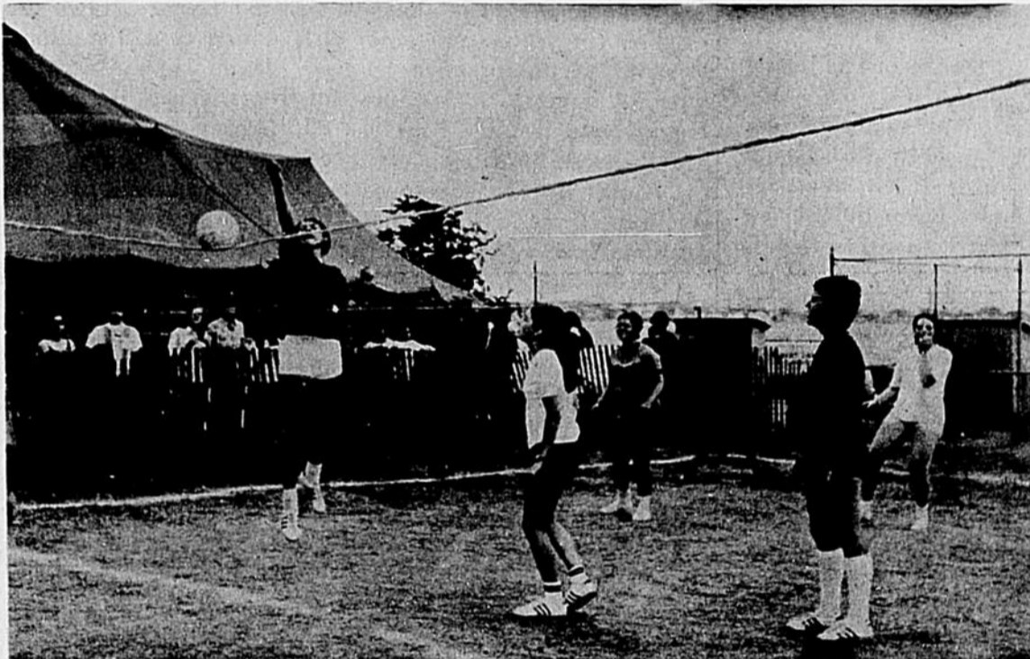
Plusieurs compétitions furent présentées, au cours de la journée de dimanche, lors du Carnaval dans l'île. L'une d'entre elles est le ballon-volant, un sport de plus en plus populaire. Nous