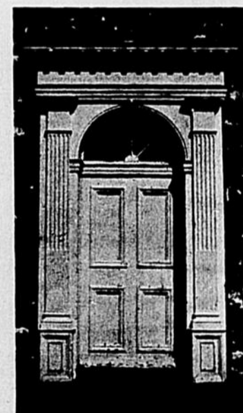
Saint-Pierre (île d'Orléans) : portail latéral en bois peint et sablé de l'église commencée en 1716.