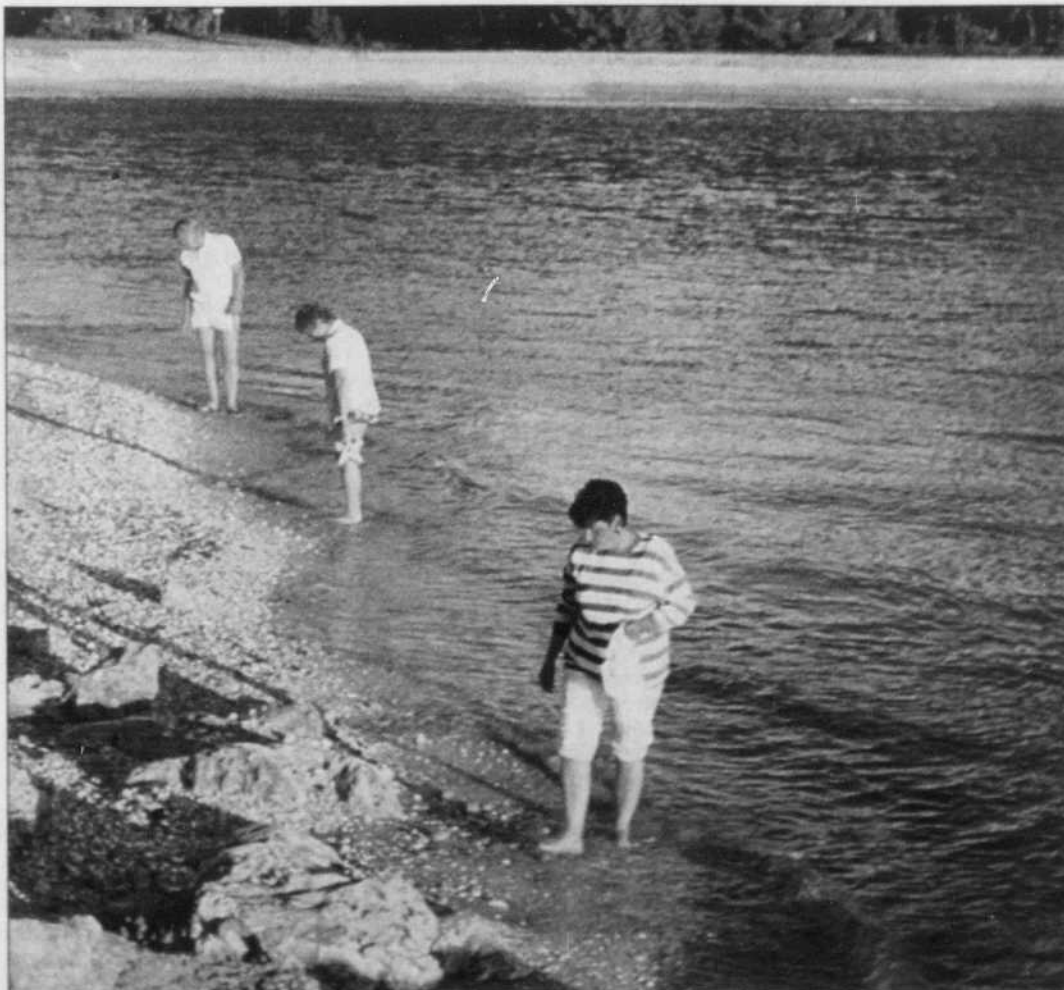
Sanibel Island, un des endroits au monde où les touristes ont des coups de soleil dans le dos puisque le sport local est la collecte de coquillages, qui s'offre par millions.

■ Renseignements sur la Floride: ☎ 1 800 268 3791, www.VISIT-FLORIDA.com .