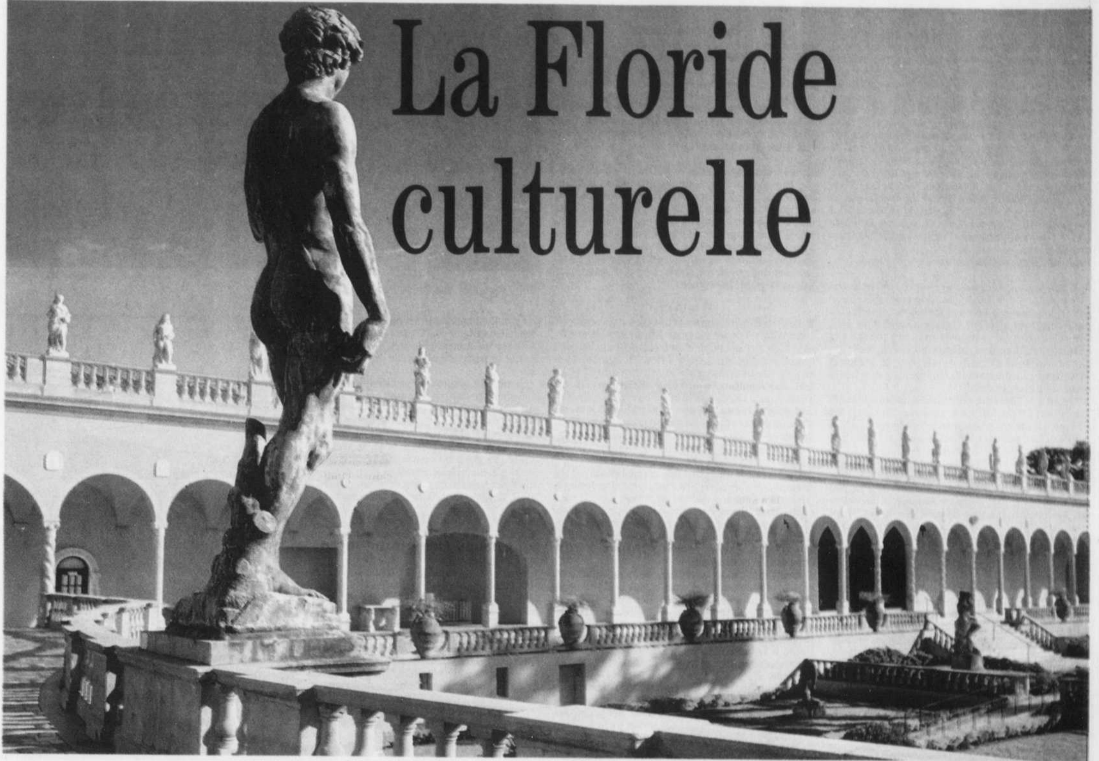
Sarasota Ringling. Les créateurs du Ringling Brothers and Barney & Bailey Circus y installèrent leurs quartiers d'hiver, faisant construire un bâtiment Renaissance en U pour en faire un musée au bénéfice de la population environnante, et ils achetèrent quelques toiles signées Rubens, Véronèse ou Poussin, pour ne citer que les plus coûteux.

La Floride souffre et jouit à la fois. Elle souffre d'une réputation qui la place dans le rôle du bac à sable réservé soit aux personnes sans âge qui fréquentent les marchés aux puces et les boardwalks animés, soit aux hordes d'analphabètes qui ont comme symbole marin les concours de wet t-shirts. Pourtant, elle jouit d'un immense parcours culturel, beaucoup moins connu.