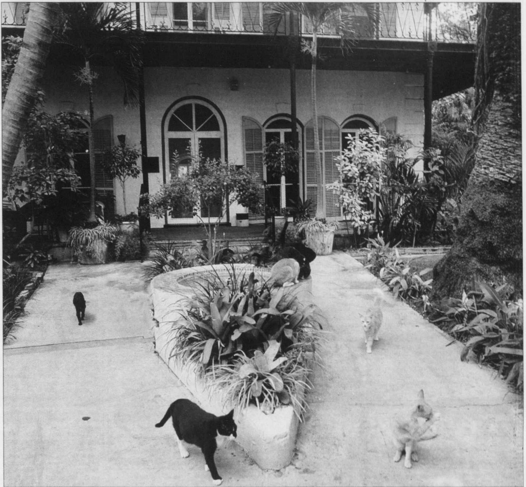
En dehors de la visite de la maison d'Ernest Hemingway, à Key West, ce sont la soixantaine de chats qui y résident, pour la plupart polydactyles, qui nous indiquent la voie des arts made in minou .

Autre bouillon de culture pour se transporter sur la côte Ouest floridienne avec un premier arrêt à Sarasota et y découvrir les désirs et passions d'un couple qui a donné tout le côté artistique à la ville: les Ringling. Les créateurs du cirque Ringling Brothers and Barney & Bailey Circus y installèrent leurs quartiers d'hiver, faisant construire à leur mesure un bâtiment Renaissance en U pour en faire un musée au bénéfice de la population environnante, et ils achetèrent quelques toiles signées Rubens, Véronèse ou Poussin, pour ne citer que les plus coûteux. Ce qui fut suivi avec quelques maîtres flamands, espagnols, français et hollandais,