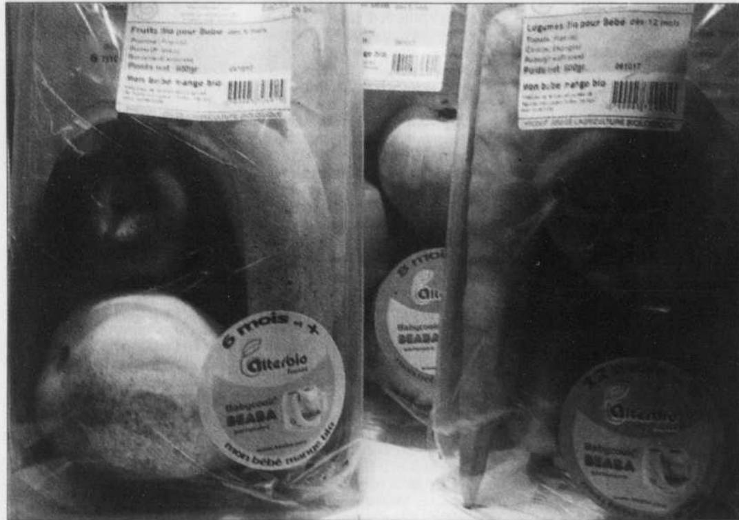
Du côté bio, on semble ralentir le pas, bien que, cette fois, on s'adresse directement aux «bons parents» avec des aliments biologiques pour bébés.