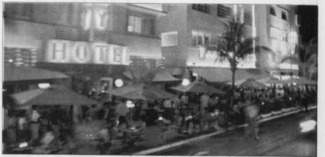
Miami by night.

En dehors de cette première introduction anthropologique du quartier, la visite de la plage attenante est