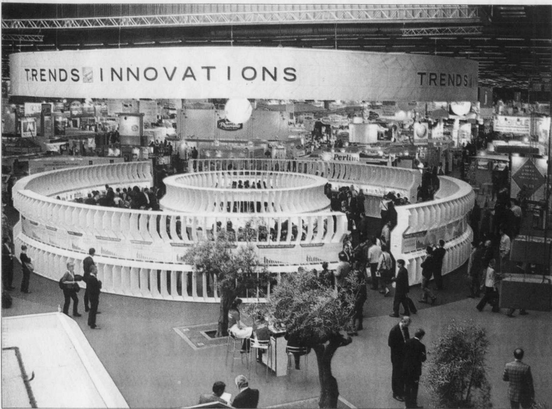
Être primé au Salon international de l'alimentation de Paris est garant d'un succès commercial.

Au SIAL de Paris, des spécialistes prennent le pouls de ce que sera notre alimentation de demain