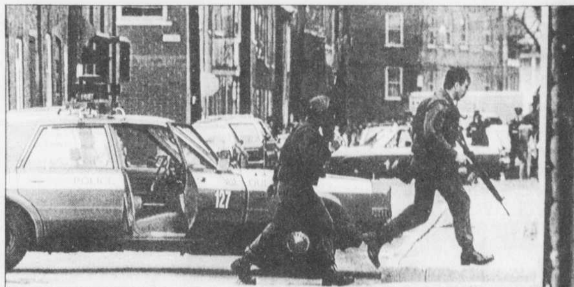
Des membres de l'escouade tactique prennent position devant la demeure du père du tireur isolé, dans la basse ville à Québec.

On a également demandé aux personnes consultées combien elles seraient prêtes à contribuer pour l'élimination des pluies acides. 35% ont répondu «pas un cent», 31% $5 par mois, 15% $10 par mois et 8% $15 par mois.