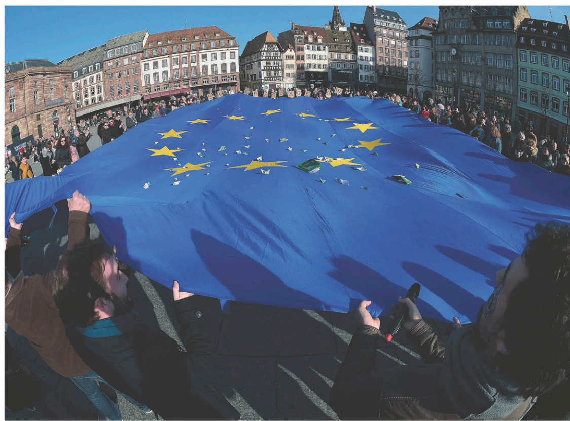
Devant des critiques comme celles adressées par Trump, l'Union européenne doit faire preuve d'unité pour empêcher la fragmentation.