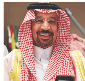
Khaled al-Faleh, le ministre de l'Énergie d'Arabie saoudite

M. Faleh a expliqué que l'objectif de ce programme est d'atteindre une capacité de 10 gigawatts d'ici à 2023 et il coûtera 30 à 50 milliards de dollars, ajoutant qu'il portera surtout sur la production d'énergie solaire et d'énergie éolienne. «10 gigawatts n'est que le début», a-t-il souligné. Le ministre de l'Énergie avait déclaré en juin que son pays serait à l'avenir un «grand compétiteur dans le secteur des éner-