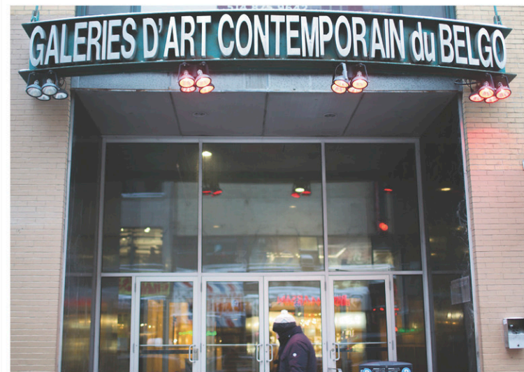
ANNICK MH DE CARUFEL LE DEVOIR

Les Territoires en 2015, la galerie Donald Browne en 2016; au tour maintenant de la galerie Joyce Yahouda de quitter le Belgo.