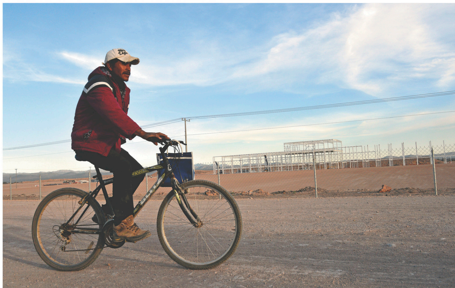
Le Mexique est l'un des pays qui risquent de pâtir des politiques protectionnistes que promet le président américain désigné, Donald Trump. À Villa de Reyes, au nord du Mexique, un gardien de sécurité patrouille dans les alentours d'un site de construction d'une usine que Ford a décidé d'abandonner.

Les entreprises technologiques prévoient des investissements moyens de 410 000 $