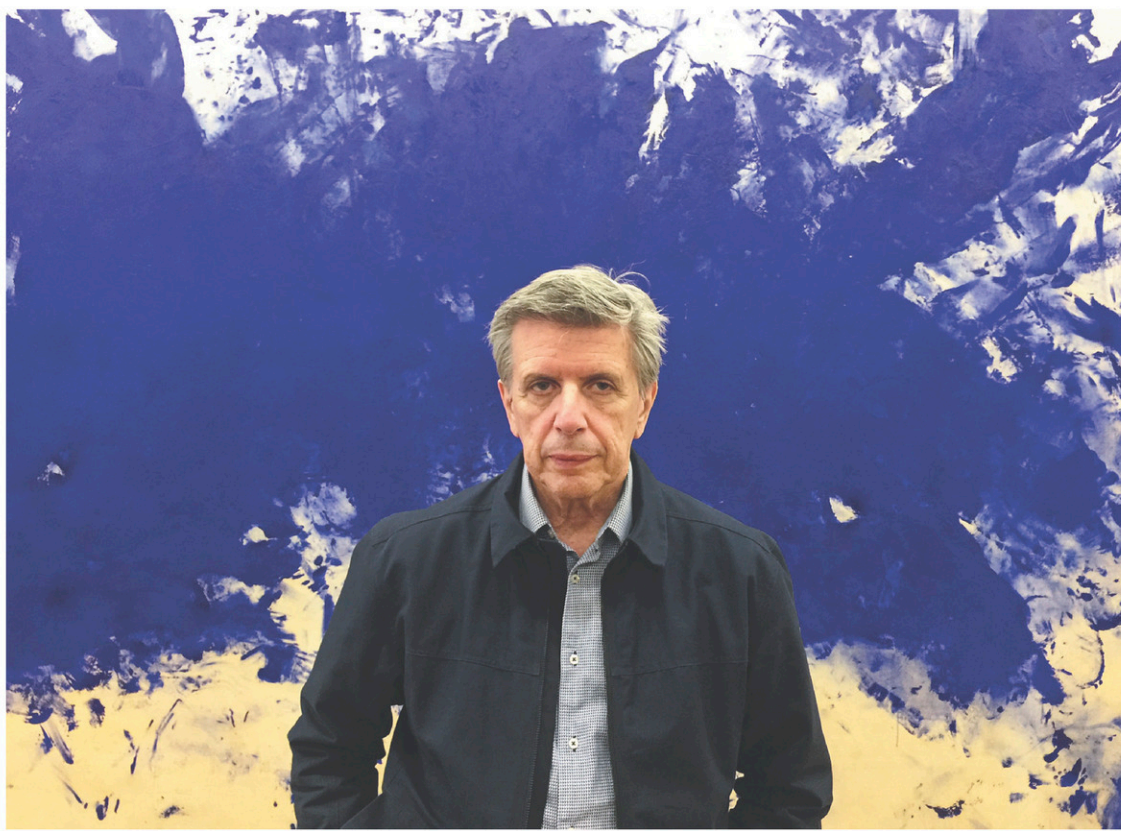
La place de l'Acadie dans l'espace public demeure encore à conquérir, regrette l'ancien lieutenant-gouverneur du Nouveau-Brunswick.

En s'installant à Moncton, le jeune homme né dans le village francophone de Saint-Simon