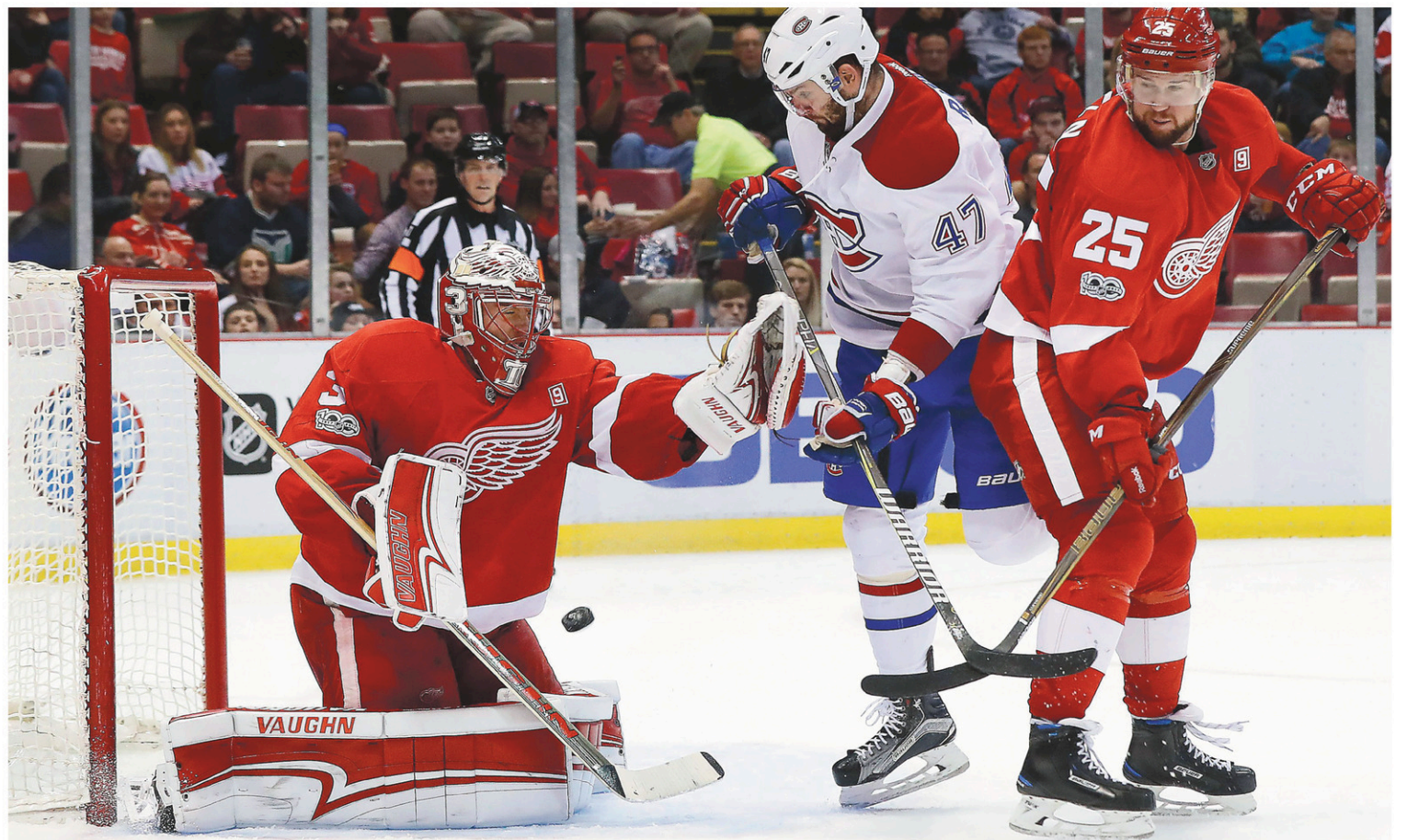
Le gardien de but des Red Wings, Jared Coreau, a bloqué un tir dévié alors que le n° 47 du Canadien, Alexander Radulov, gêné par le défenseur de Detroit Mike Green, tentait de lui obstruer la vue, dans le match de lundi disputé à 15 h à Detroit.