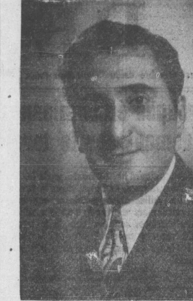
Jan Paere, ténor du Metropolitan de New-York, qui chantera avec Liy Pons dans "Lucia di Lammermoor"...