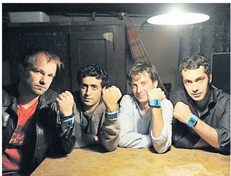
Les visages français de la distribution des Invincibles .

Par ailleurs, les efforts déployés par ARTE pour promouvoir les aventures des quatre superhéros risquent d'avoir une influence sur l'audimètre. En effet, l'insuccès de l'adaptation française des Bougon – diffusée il y a deux semaines sur M6 – a été en partie attribué à un manque de publicité pour faire connaître l'émission. En raison de l'accueil plutôt froid que lui ont réservé les téléspectateurs, la chaîne ignore pour le moment ce qu'il adviendra des six épisodes qui n'ont pas encore été diffusés.