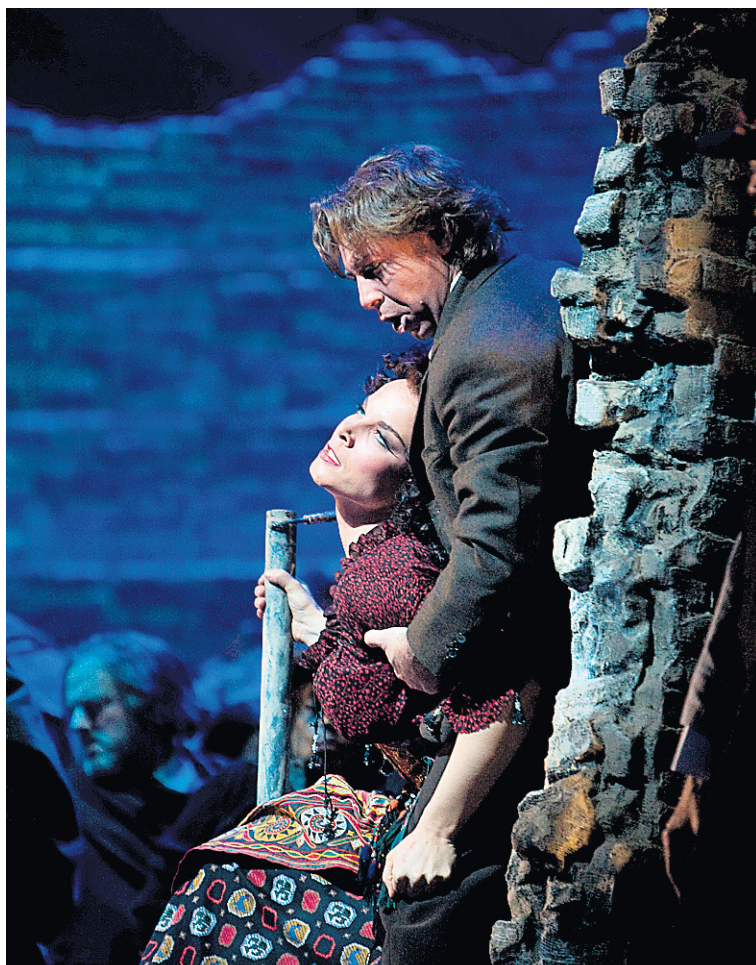
Dans le rôle de Carmen, Elina Garanca est convaincante. Roberto Alagna l'est tout autant dans celui de Don José.

La Carmen de Garanca est d'abord une femme extrêmement désirable qui joue de ses charmes avec l'art d'une diablesse, qui rend fous tous les hommes qui l'approchent (... dont elle s'approche serait plus juste) et qui sème le trouble partout où elle passe. Quels yeux!... En gros plans,