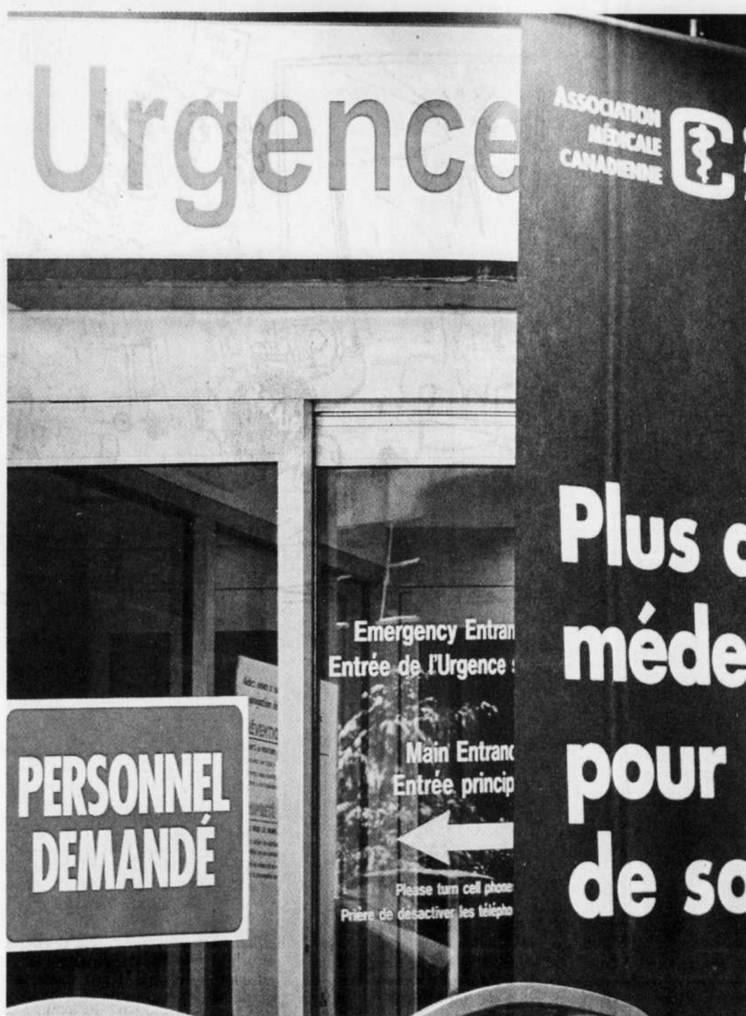
La crise économique ne doit pas servir de prétexte pour réduire le financement en santé puisque la conjoncture mettra davantage de pression sur l'ensemble du réseau.

Pour donner suite aux engagements gouvernementaux, il faudra aussi intervenir auprès de milliers d'enfants, de jeunes et de familles en difficulté et venir en aide aux personnes souffrant de problèmes de dépendance à la drogue, à l'alcool ou au jeu. Nous devons offrir soutien et services aux personnes vivant avec des problèmes de santé mentale, de déficience intellectuelle ou de troubles du développement. Cela demandera des investissements supplémentaires.