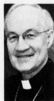
Le cardinal Marc Ouellet