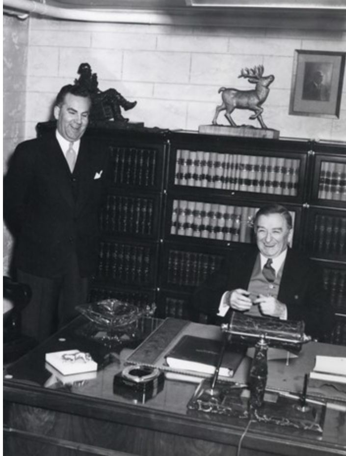
Image 1 : Maurice Bellemare et Maurice Duplessis, détail d'une photo représentant les membres du conseil de ville du Cap-de-la-Madeleine venus chez le premier ministre pour lui offrir leurs vœux de bonne année, 4 janvier 1954.

Le philistinisme du gouvernement de Maurice Duplessis est en quelque sorte un fait acquis de l'histoire québécoise. Cela s'explique par la conjonction de plusieurs phénomènes, à commencer par de nombreuses déclarations anti-intellectuelles du premier ministre et des membres de son gouvernement. À cela il faut ajouter le faible engagement du gouvernement Duplessis dans le développement de plusieurs secteurs des arts au Québec (notamment le théâtre 3 ), ainsi que l'opposition farouche que lui a servie une large part des artistes et intellectuels de l'époque. Le premier ministre Duplessis n'a pas eu à se donner une image de lettré ou d'esthète pour assurer le succès de son gouvernement. Il semblait plutôt croire le contraire. Par exemple, collectionneur d'art averti, possédant notamment des tableaux de Krieghoff, de Corot et de Boudin, il ne parla à peu près jamais, du moins publiquement,