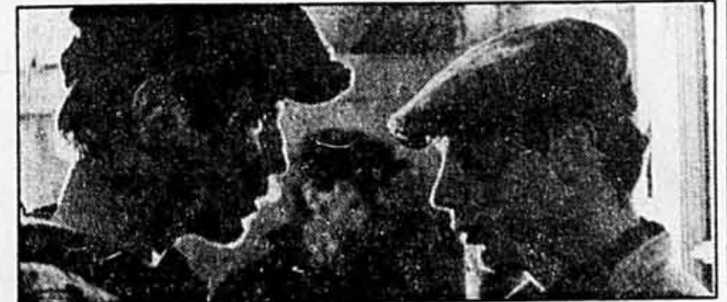
Michael York et Jacques Penot dans Au nom de tous les miens .

Un film marquant de l'histoire du cinéma puisqu'il s'agit du premier sonore. On y entend la voix d'Al Jolson. Cela date de 1927.