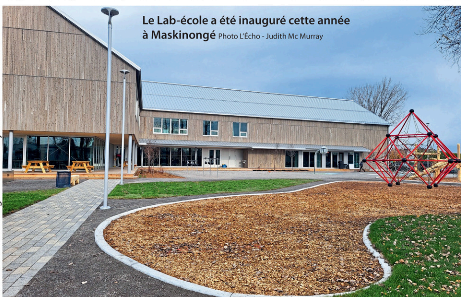
Le Lab-école a été inauguré cette année à Maskinongé

L'automne 2023 a aussi été l'occasion de découvrir le premier Mauricie arts vivants, festival qui avait lieu dans les municipalités de Saint-Mathieu-du-Parc, Saint-Élie-de-Caxton et Saint-Paulin. L'événement a mis en lumière des artistes aux pratiques artistiques diversifiées issus du domaine des arts vivants.