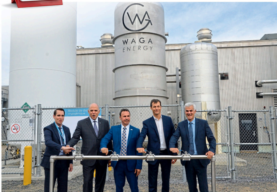
La mise en fonction officielle de la Wagabox s'est faite par une ouverture symbolique des valves