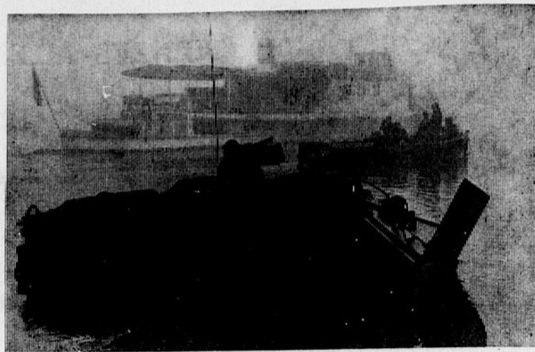
Un véhicule transport de troupes du 1er bataillon, Royal 22e Régiment traverse la rivière Weser durant un exercice du 4e groupement motorisé en Allemagne. A l'arrière plan un bateau-passeur et une péniche du génie qui patrouille la rivière.