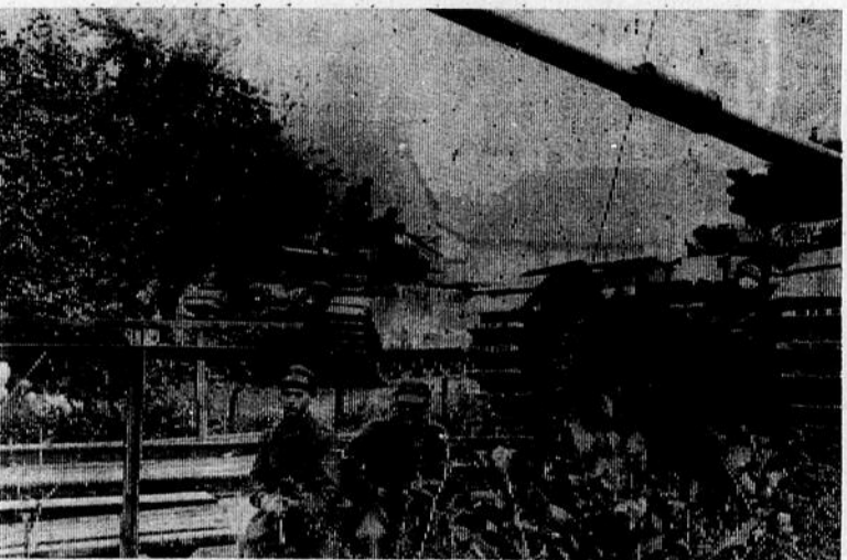
Deux fantassins supportés par deux chars blindés centurion sont sur le qui-vive près d'un pont durant une manoeuvre du 4e groupement motorisé Canadien en Allemagne.