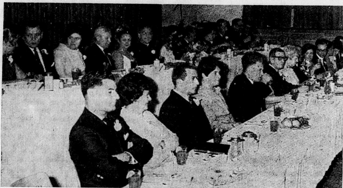
Une vue générale des deux tables d'honneur.