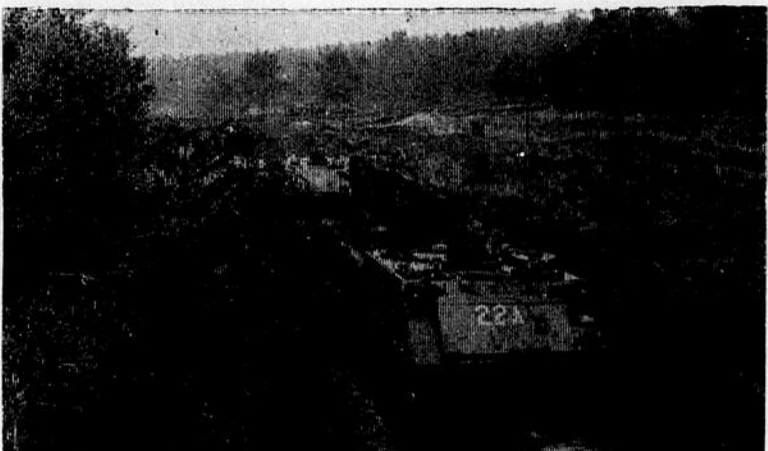
Une colonne de véhicules transport de troupe blindés avançant lors de manoeuvre à Soltau, entraînement qui s'est déroulé l'automne dernier.