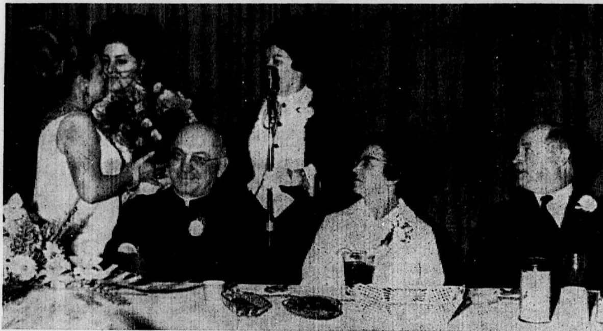
Remise d'une gerbe de fleurs à la Régente des Filles d'Isabelle.