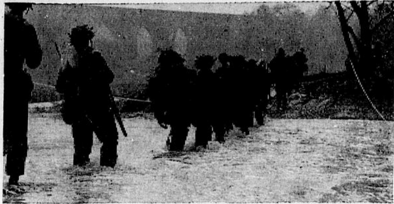
Des fantassins du 1er bataillon, Royal 22e Régiment traversant une rivière durant l'exercice "KEYSTONE", manoeuvre qui s'est déroulée du 21 au 30 octobre dans la région Einbeck, Meschede, Gottingen, et Kassel.