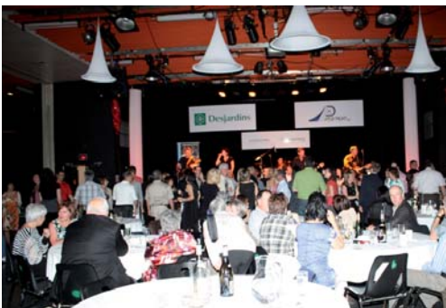
Archive : souper Homards 2010

Vous avez quelques heures à donner en échange d'un souper et d'une soirée dansante? Contactez Pauline au poste 1614 ou présentez-vous au bureau 3231C.