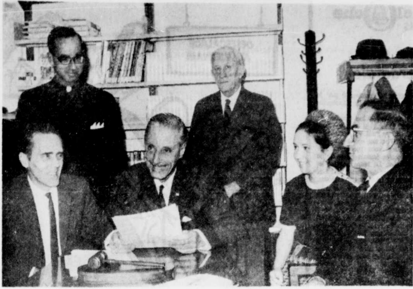
LE COMITÉ DE LA BIBLIOTHÈQUE MUNICIPALE a décidé d'organiser un salon du livre qui coïncidera avec l'inauguration officielle de la bibliothèque municipale de Victoriaville. Sur la photo, les principaux responsables de