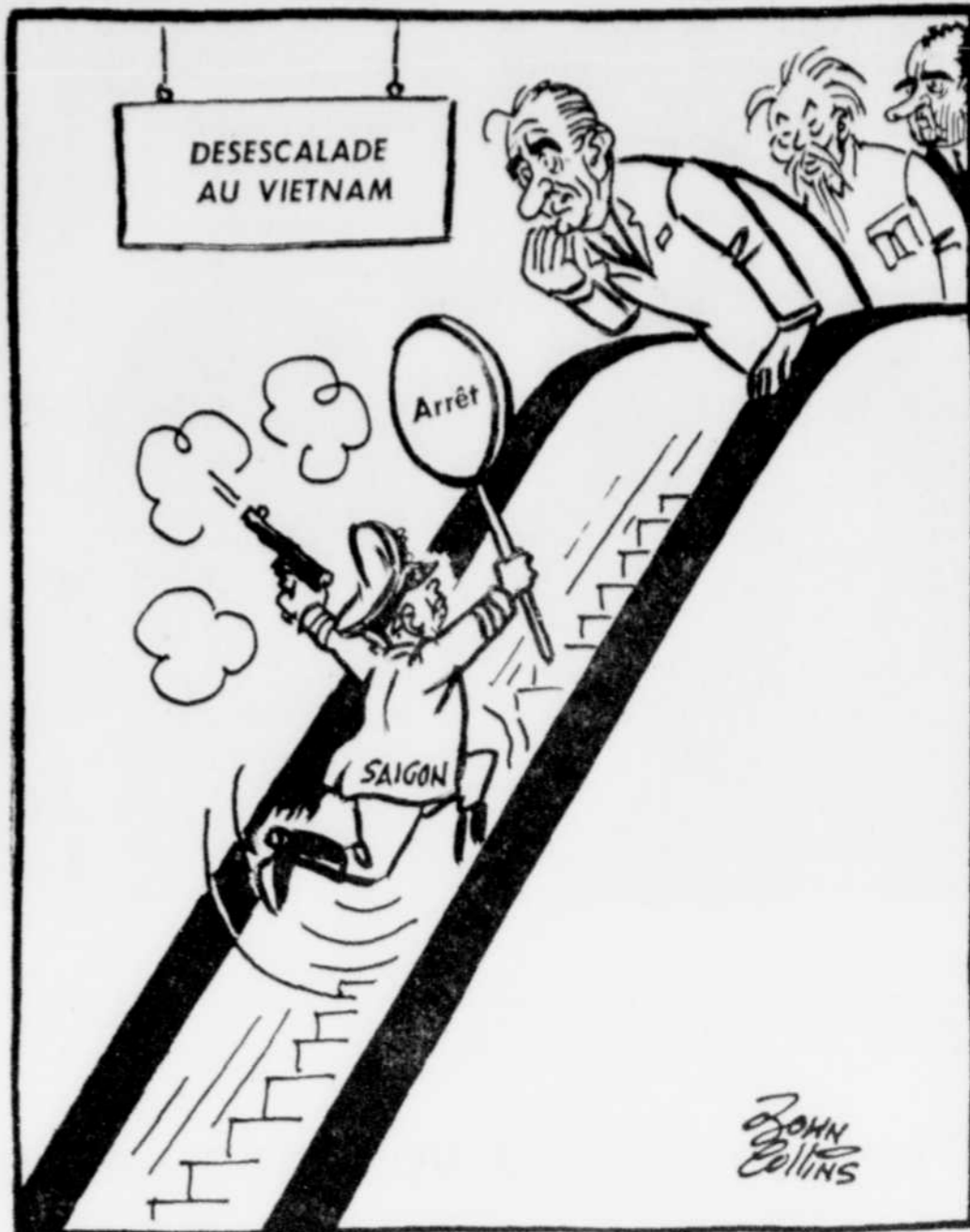
Grimpant l'escalier à l'envers