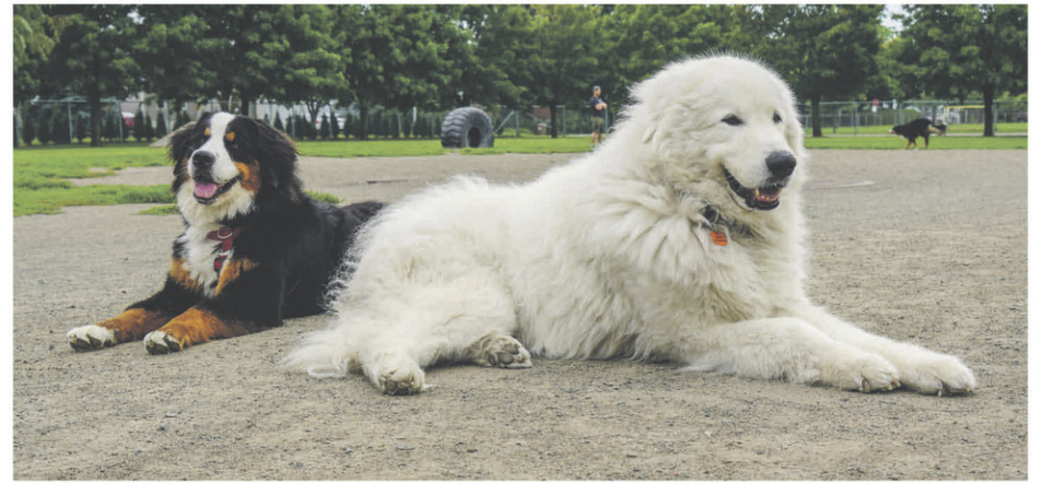
La Ville étudie la possibilité d'installer un deuxième parc canin sur le terrain longeant la bretelle de la sortie 112 de l'autoroute 20.