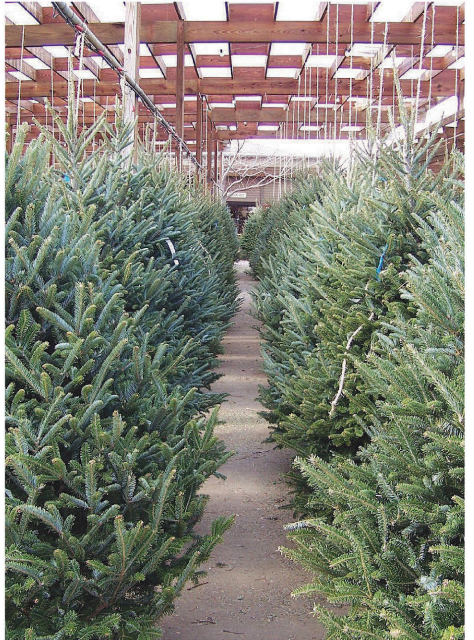
Le ramassage des sapins commence dès le lundi 9 janvier dans la région.

À Saint-Basile-le-Grand, les citoyens pourront se débarrasser de leur sapin naturel plus tôt en allant le déposer au garage municipal, du 2 au 6 janvier, ainsi que du 9 au 13 janvier, à l'édifice Léon-Taillon, situé au 200, rue Bella-Vista. Les conifères recueillis seront recyclés par une entreprise qui en fera des copeaux et d'autres produits issus du bois. Les lumières de Noël peuvent également être déposées lors des journées des rebuts encombrants et récupérables.