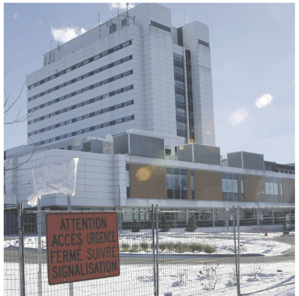
La nouvelle urgence à l'Hôpital Honoré-Mercier n'est pas encore prête à accueillir des patients.

L'agrandissement et le réaménagement de l'urgence ont été autorisés en décembre 2016. Le total des investissements devrait tourner autour de 69,1 M$. Les nouvelles installations s'étendent sur 6516 mètres carrés sur deux niveaux. On y trouve une aire de 26 civières, une unité de soins intensifs temporaires capable d'accueillir quatre civières, un espace ambulatoire de sept salles d'examen et une zone d'évaluation rapide. L'édifice est conçu de manière à permettre l'ajout d'un autre étage.