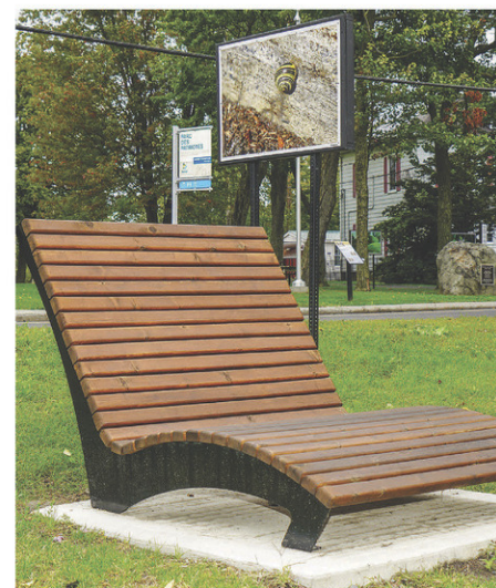
Ce sont les employés des travaux publics qui ont conçu les chaises comme celle-ci, qu'on trouve à différents endroits dans la ville.