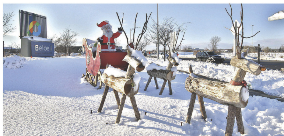
Les employés des travaux publics sont derrière la création de ces rennes sur la rue Serge-Pepin.