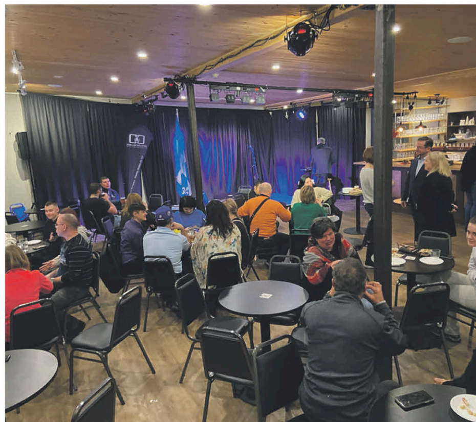
Une trentaine de personnes ont répondu à l'invitation.

Rappelons qu'en 2022, plus de 35 000 $ ont été amassés grâce à la campagne de solidarité du Bloc québécois pour l'Ukraine. Le gouvernement canadien s'est engagé à doubler le montant recueilli. Il est par ailleurs toujours possible de faire un don par l'intermédiaire de la Croix-Rouge au www.croixrouge.ca .