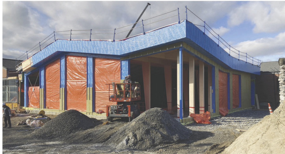
Les travaux de réfection du complexe aquatique ont débuté le 21 février 2022 et l'entrepreneur général devrait livrer le bâtiment complété vers juin.