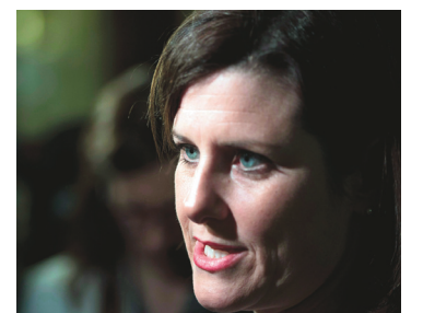
LA PRESSE CANADIENNE

Dans un volumineux avis soumis au comité il y a un an, le Conseil du statut de la femme (CSF) prônait pour sa part que