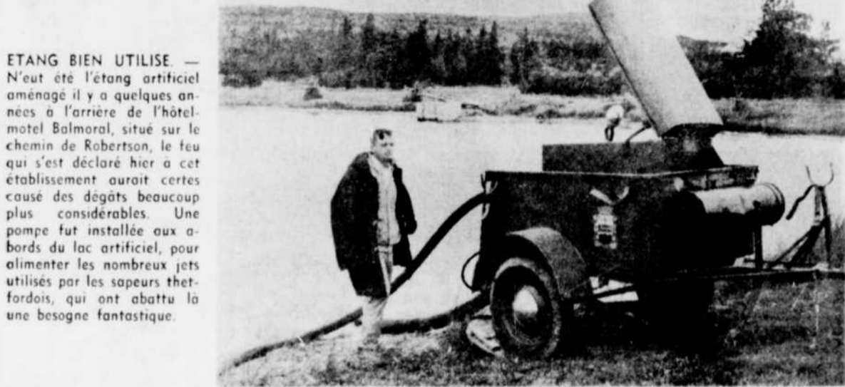
ETANG BIEN UTILISE. — N'eût été l'étang artificiel aménagé il y a quelques années à l'arrière de l'hôtel-motel Balmoral, situé sur le chemin de Robertson, le feu qui s'est déclaré hier à cet établissement aurait certes causé des dégâts beaucoup plus considérables. Une pompe fut installée aux abords du lac artificiel, pour alimenter les nombreux jets utilisés par les sapeurs thetfordois, qui ont abattu la vaine besogne fantastique.

Le feu qui a entièrement détruit la partie principale du motel Balmoral, hier à Thetford Mines, a pris naissance dans la cuisine, sise à l'arrière de l'établissement, dont on aperçoit le spectre ci-haut. Les sapeurs arrosent précisément au-dessous de l'endroit où l'élément destructeur a pris naissance.