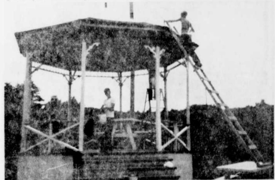
PREPARATIFS — Les otéjistes se préparent activement à fêter le couronnement de leur reine et roi pour la saison prochaine. On voit ici des jeunes peignant le kiosque qui servira au couronnement. Toutes les bâtisses du terrain porteront une nouvelle toilette lors de la fermeture. La peinture est une gracieuseté de la Co. Domtar.

Au cours de l'après-midi, on exécuta plusieurs jeux de société, entre autres, ballon mexicain, danses mexicaines et plusieurs autres jeux mexicains, après quoi on fit un feu d'artifice.