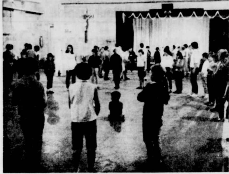
DES JEUX A BROMPTONVILLE. — Les jeunes de Bromptonville ont maintenant des jeux organisés deux après-midis par semaine. Hier marquait la première journée de jeux. Plus de 250 enfants de 4 à 13 ans ont envahi la salle paroissiale Ste-Praxède, à cause de la pluie. Une douzaine de moniteurs et monitrices ont dirigé leurs jeux. Par beau temps, ces activités seront tenues à un nouveau terrain, sur la rue Ponton.

STATION DE SERVICE CHAMPLAIN Louer avec tout l'équipement prêt à travailler. Établi depuis 12 ans. Garage, machine, Lourd Perceuse, 2200 soudeuse, Mercuro, angle boulevard des Châteaus, Drummondville-6pt. Tél. 422-4728