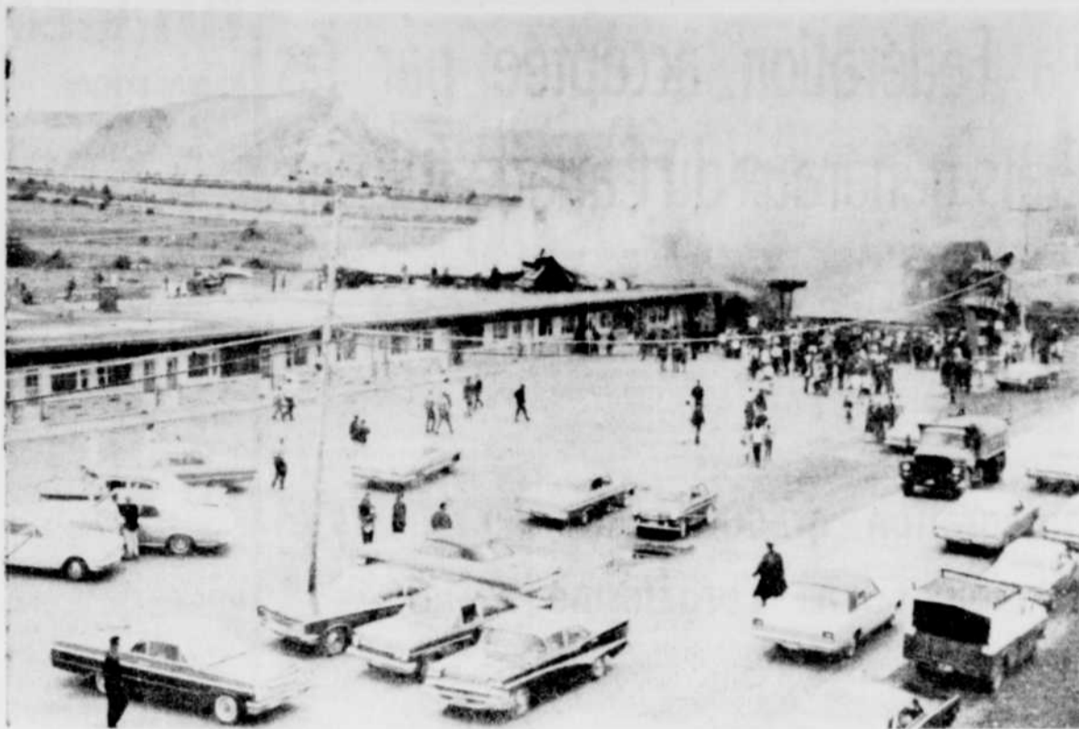
VUE AERIENNE. — Les curieux n'ont pas tardé à accourir sur les lieux de l'incendie au Balmoral. La photo ci-haut donne une vue aérienne du sinistre.