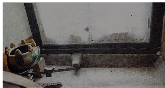
Évier en pierre

On y trouve aussi une cave au plancher de terre irrégulier où l'on pouvait accommoder le bois de chauffage pour l'hiver, une « fournaise » dite à air chaud et quelques secteurs séparés où l'on pouvait garder certains légumes au frais afin de les préserver l'hiver durant. Mais on n'y a pas trouvé de cadavre lors des réfections du XX e siècle! Au rez-de-chaussée, une grande et profonde cuisine pouvant aussi servir de salle à manger, flanquée d'un grand foyer ou fourneau qui fut plus tard muré et équipé de latrine pour usage durant l'hiver, ce avant l'arrivée d'eau courante. Deux autres petites chambres se partageaient cette section, l'une servant de garde-manger et l'autre, de chambre à coucher à l'occasion. En y regardant de près, un détail attire l'attention dans la cuisine,