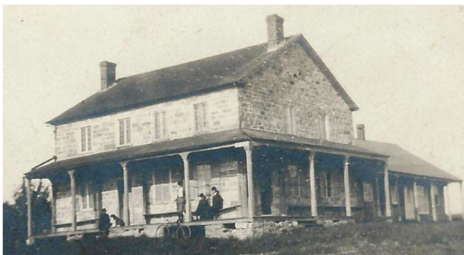
La maison Douglass avec sa galerie d'alors et sa rallonge (vers 1900)