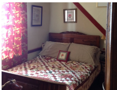
Une chambre à l'étage

chaleur qui en émanait ; en particulier, les petites aimaient voir, sentir, leurs jupons flotter sous l'effet du courant d'air chaud. D'un côté de l'escalier se trouvait une grande salle qui, du temps des Péron, était toujours fermée ; elle était alors meublée en style grand salon et son foyer placé sur le mur extérieur en imposait. De l'autre côté se trouvait une grande pièce avec