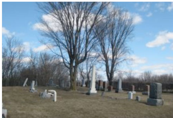
Le cimetière Douglass

Et tout au fond de ce jardin était aménagé en cimetière un grand terrain, pris sur une section de la terre. Ce cimetière fait donc partie intégrante de l'histoire,