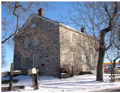
La Maison Douglass

C'est donc là que nous trouvons de nos jours l'imposante maison de pierre des Douglass, bâtie en 1816. Par sa présence, son architecture, la maison Douglass en impose et se présente visuellement comme étant le centre dudit Coin. Le hameau où elle se situe se trouvait et se trouve encore à la jonction de trois grands chemins