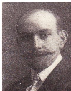
Vers 1911 à Pointe-aux-Trembles