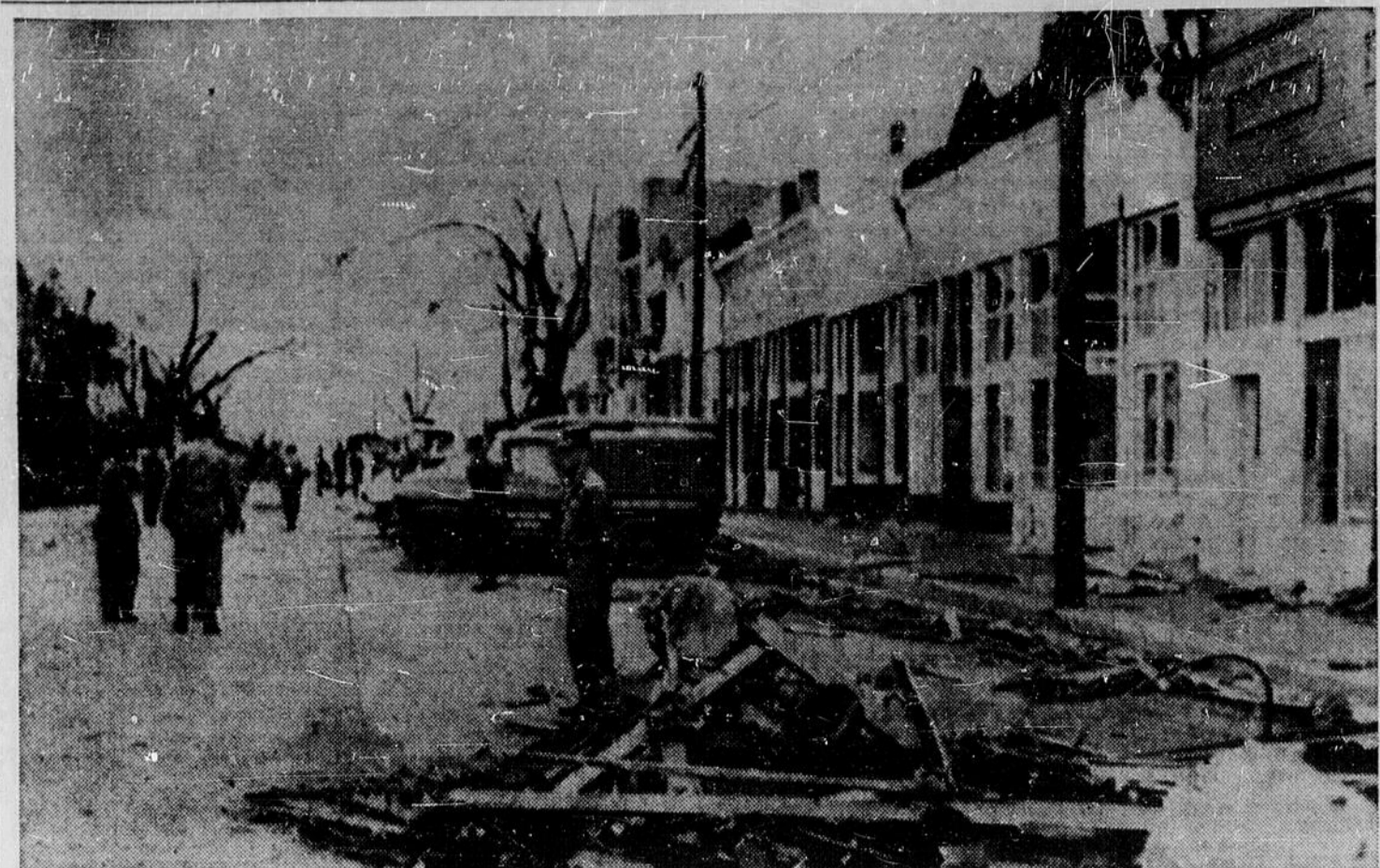
VILLE DEVASTÉE — La ville de Meriden, dans l'Etat américain du Kansas, a été fortement ébranlée jeudi soir par une tornade qui a causé la mort d'une femme et des blessures à plusieurs autres personnes. La photo ci-dessus nous montre une partie du secteur commercial de la ville, après le passage des éléments déchainés.

Desmarais & Parisien COMPTABLES AGREES 311, édifice Mackey 202, rue King SUDBURY STURGEON FALLS OS. 4-1939 685