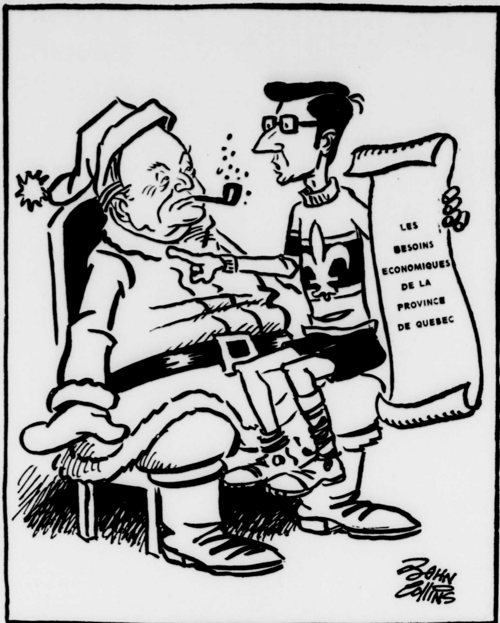
"Un peu moins de 'ho! ho!'" et plus d'argent"