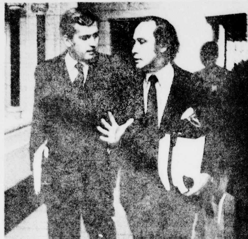
Durant toute la journée à Ottawa, le premier ministre du Canada M. Pierre-Elliott-Trudeau et le ministre de la Justice, M. John Turner étaient tenus au courant de ce qui se passait dans la métropole. M. Trudeau a même pu converser avec M. Cross.

MONTREAL — Le premier ministre du Québec, Monsieur Bourassa, est arrivé à Montréal en soirée hier afin de rendre visite à James Cross au pavillon Canadien de Terre des Hommes. Ce pavillon, on le sait, a été proclamé temporairement extension du territoire Cubain et Monsieur Cross y restera détenu jusqu'à ce que l'avion de ses ravisseurs atterrisse à Cuba. Monsieur Cross a reçu le premier ministre dans une salle du pavillon, où il regardait la télévision. Il portait les mêmes vêtements qu'il avait hier matin en sortant de la maison de ses ravisseurs, rue Des Récollets à Montréal Nord. Monsieur Cross a déclaré qu'il n'avait cessé de regarder la télévision depuis sa capture et qu'entre autres il avait pu voir le film des funérailles de Pierre Laporte, assassiné le 17 octobre. Il a dit à Monsieur Bourassa que sa détention n'était probablement pas aussi pire que la prison, mais qu'il était constamment surveillé, même lorsqu'il se rendait à la salle de bain. Il semblait de bonne humeur et en bonne santé.