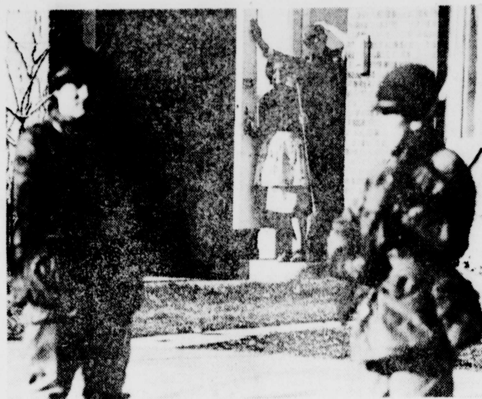
Les résidents de la rue des Récollets se demandaient bien se qui se passait, tôt hier matin, lorsqu'ils ont vu les policiers et soldats envahir le secteur.

M. Bourassa a rencontré James Richard Cross