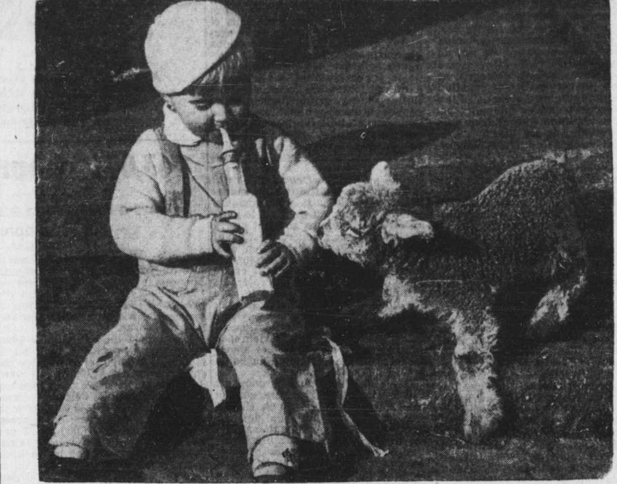
Est-ce que ce gentil petit compagnon, un tout jeune agneau, va réussir à partager le repas de ce gros bébé?