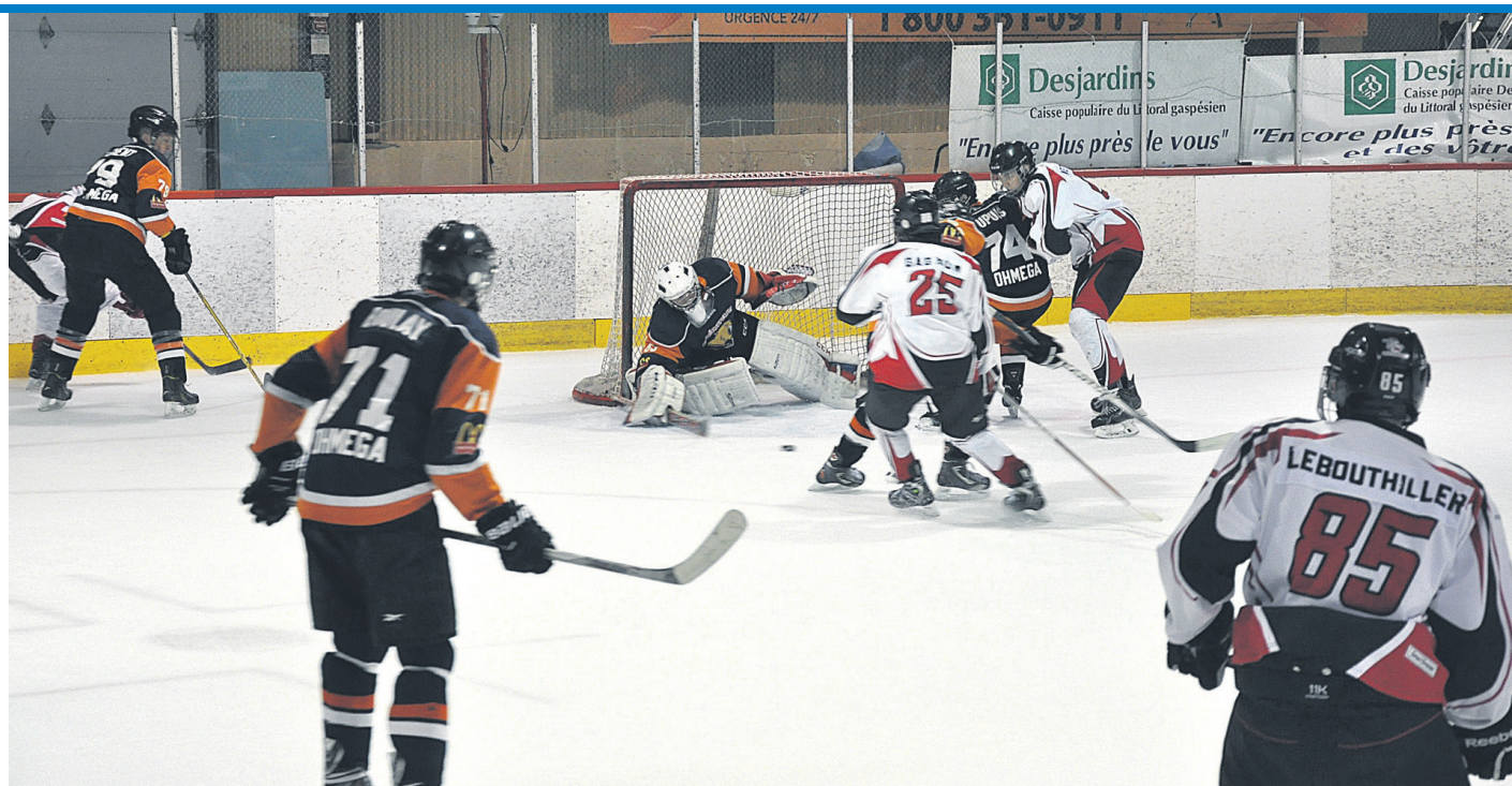
Lors du dernier match de la Coupe, la formation Forillon a écrasé celle de la Baie-des-Chaleurs par le pointage de 10 à 1.