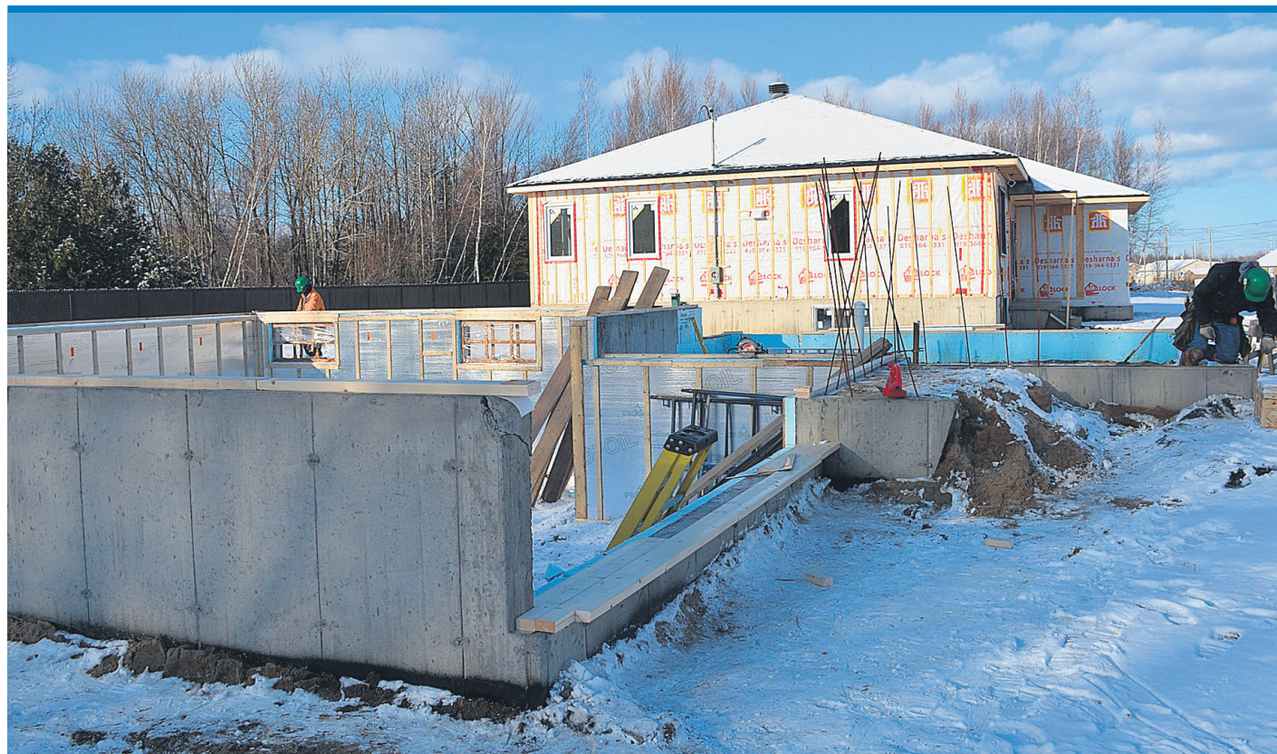
Un projet important est sur la glace présentement à Port-Daniel.

L'assemblée générale annuelle du Fonds Michel Lancup Inc. se tiendra le mercredi 20 avril 2016 à 19 h à la salle du conseil municipal de l'Hôtel de ville de Chandler. Les points suivants seront à l'ordre du jour : lecture et approbation du procès-verbal de la dernière assemblée générale, tenue le 4 mars 2015; présentation et approbation des états financiers annuels et élections. Les membres pourront prendre toute décision réservée à l'assemblée générale. Une période de questions aux administrateurs est également prévue. Tous les membres sont cordialement invités à participer à cette assemblée. Sincères remerciements aux membres, aux généreux donateurs, bénévoles et organismes, pour le support apporté en 2014. (A.L.)