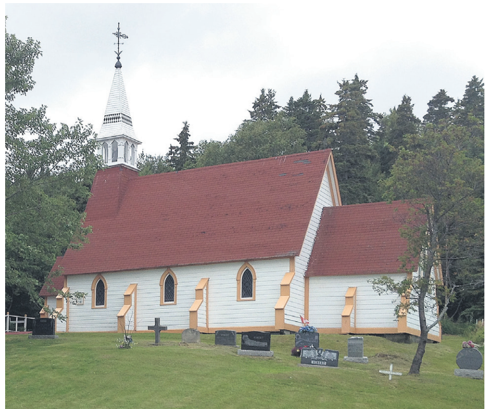
Voici une fort belle photo de l'ancienne église anglicane St Luke, maintenant Musée Culturel de Coin du Banc par la Société historique de Coin-du-Banc/Historical Society.

Les participants au camp seront logés dans une maison récemment rénovée, Auberge La Voisine du Coin, située directement sur la plage de Coin-du-Banc.