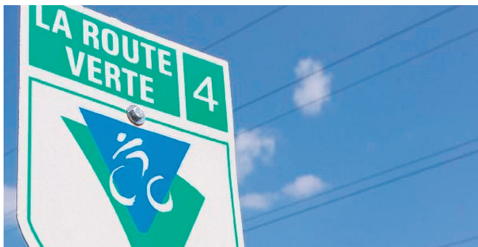
Moins de 2000 $ pour les pistes cyclables de la région.