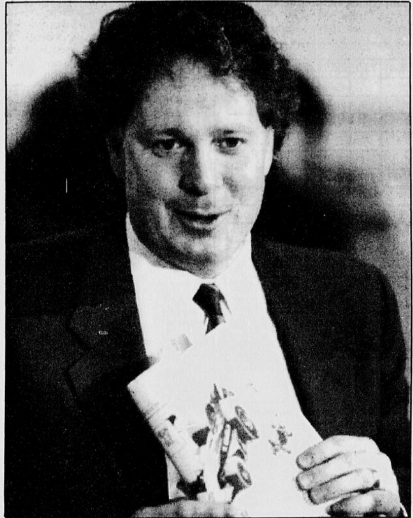
Devant les journalistes, le candidat Jean Charest a fait quelques blagues sur une caricature du Globe and Mail (voir en page A6) qui le dépeint en «go-kart» au côté de Kim Campbell en rutilant bolide.

Il cite en exemple les changements que son gouvernement a apportés au régime des allocations familiales, en en privant les familles à revenu élevé pour les laisser aux familles à revenus moyen et moindre. «C'est le genre de chose qu'il faut regarder».