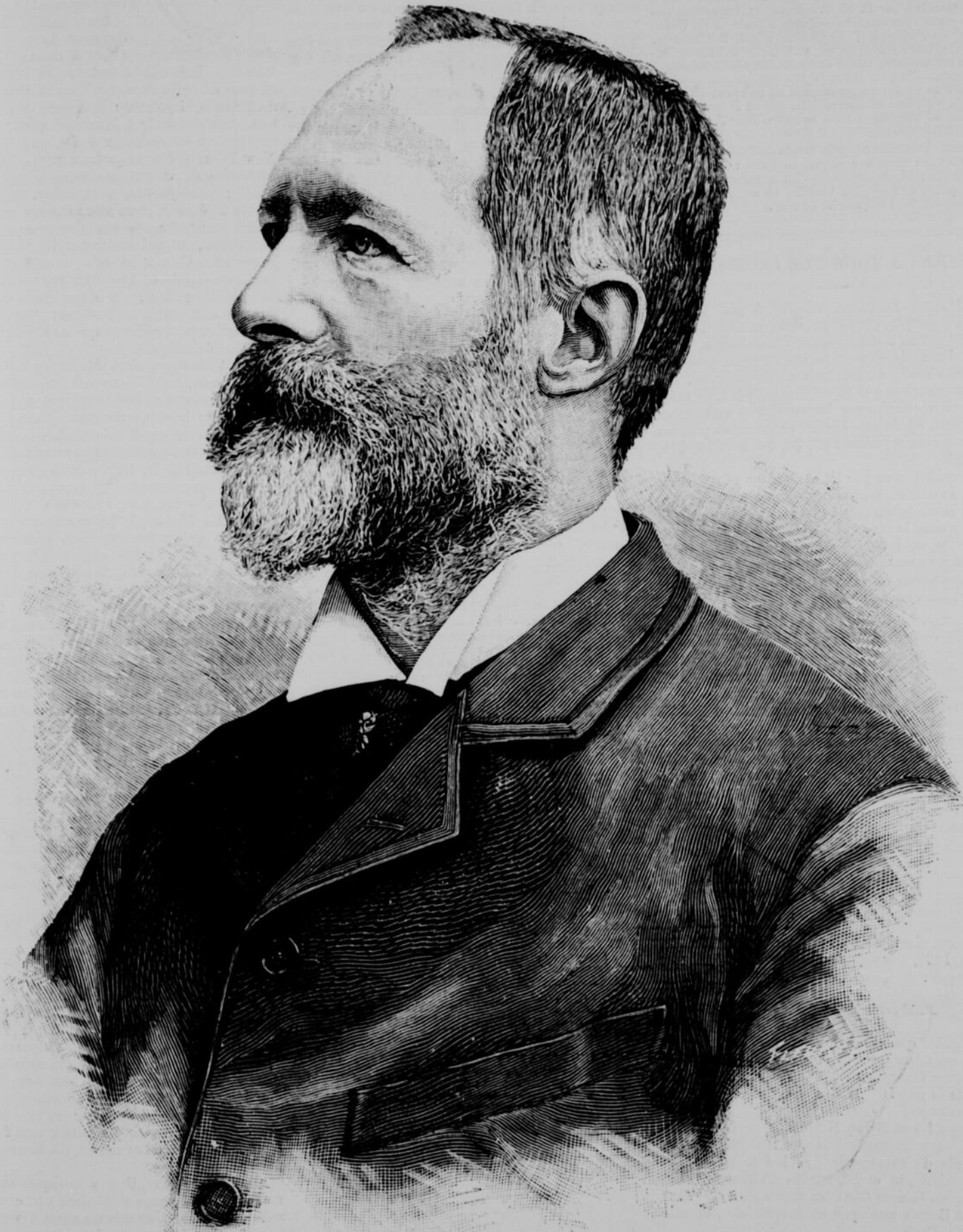
MGR LE COMTE DE PARIS, DÉCÉDÉ LE 8 SEPTEMBRE 1894

La ligne, par insertion - - - - 10 cents Insertions subséquentes - - - - 5 cents Tarif spécial pour annonces à long terme