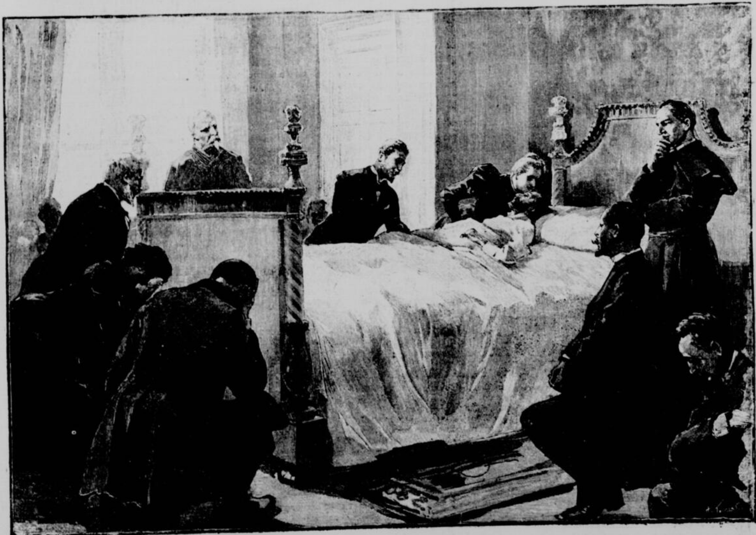
LA MORT DU COMTE DE PARIS