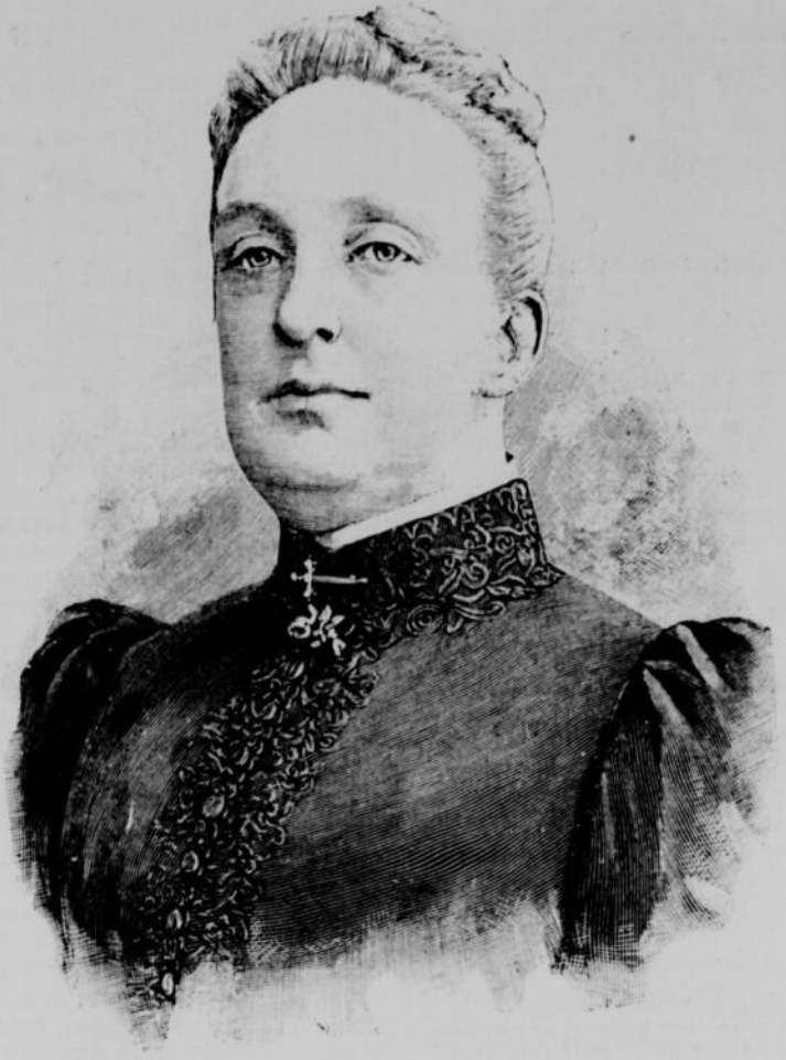
LA COMTESSE DE PARIS