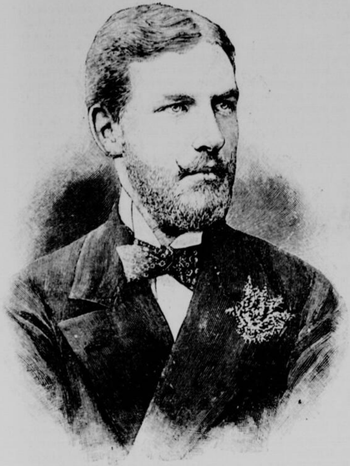
LE DUC D'ORLEANS