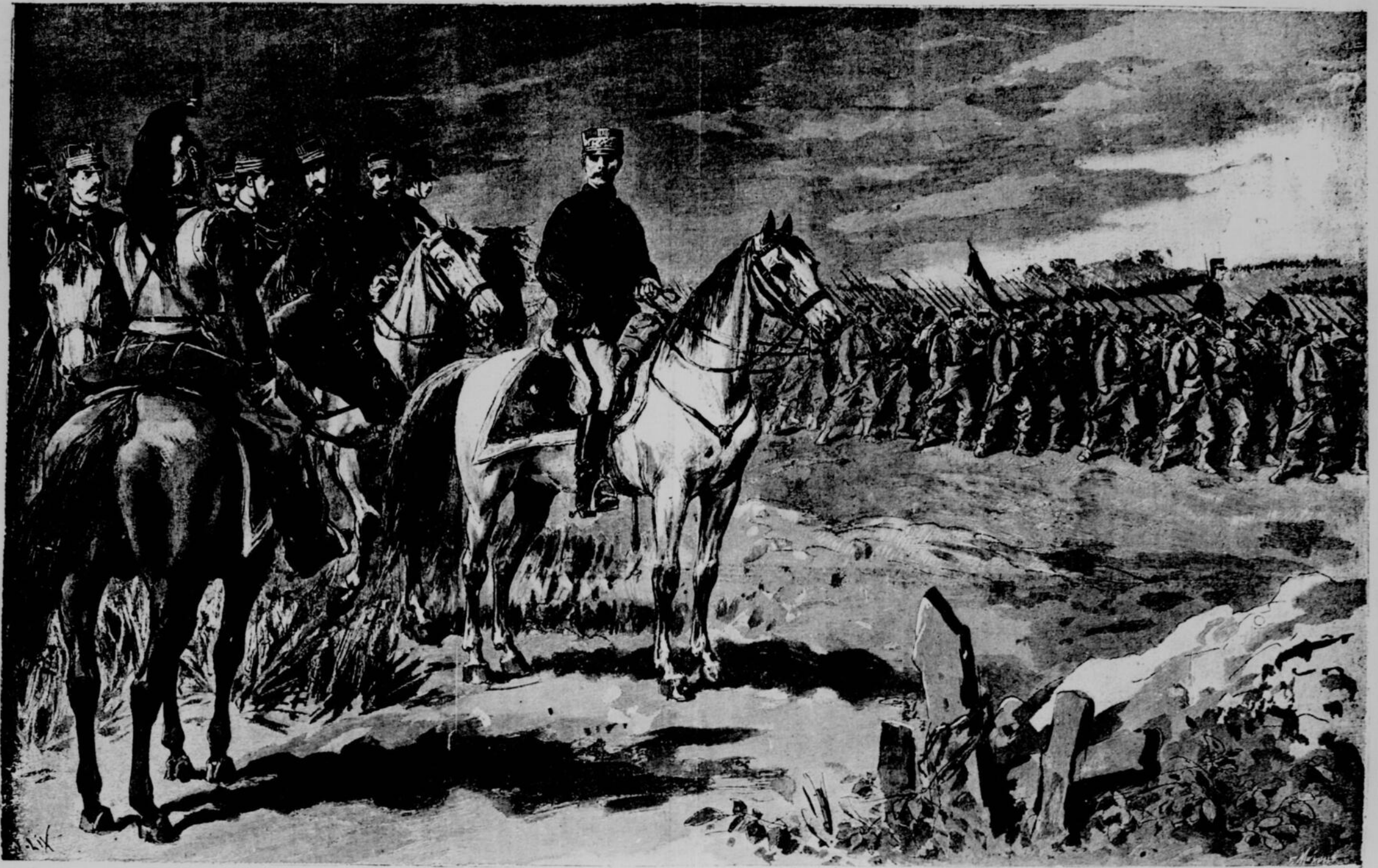
FRANCE. — LES GRANDES MANŒUVRES : LE GÉNÉRAL GALLIFET ET SES OFFICIERS