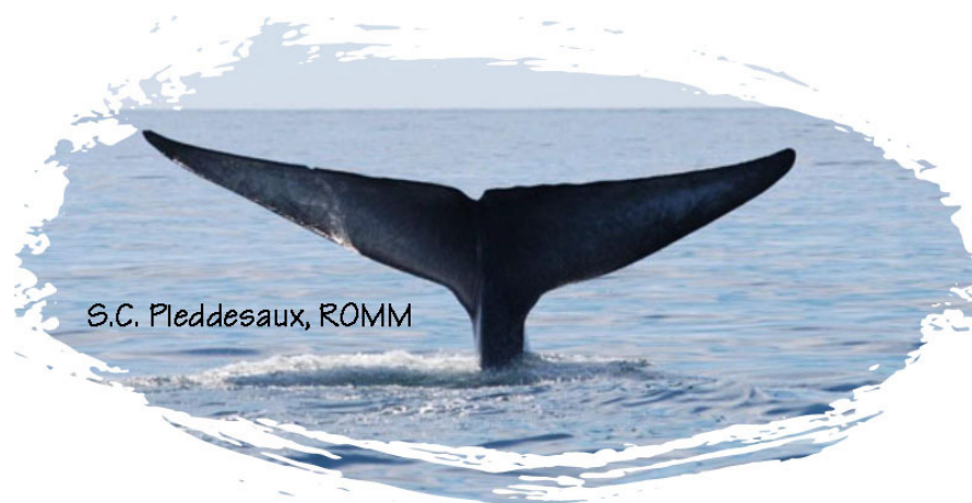
S.C. Pleddesaux, ROMM