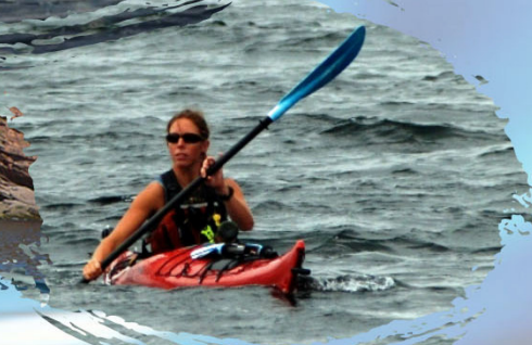
Kayak de mer

Rapport de sorties en mer Saison d'observation 2009