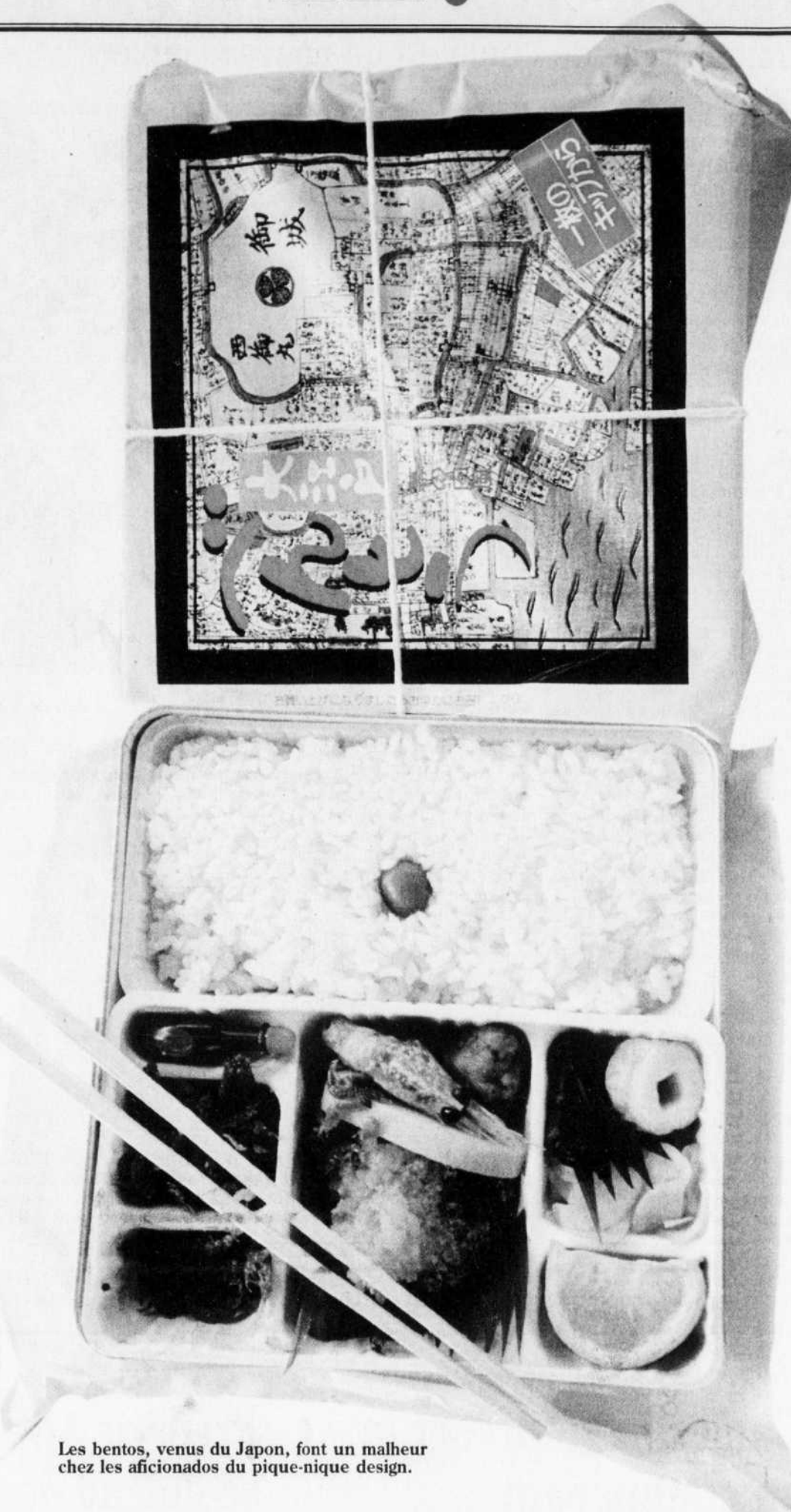
Les bentos, venus du Japon, font un malheur chez les aficionados du pique-nique design.

Les mariages interculturels, les produits disponibles, l'exotisme des saveurs, nos connaissances en nutrition, l'achat local, le bio et les saisons, notre sens de l'esthétisme, sans compter les préoccupations écologiques, font de la préparation des repas de boîtes à lunch un exercice à la fois complexe et ludique.