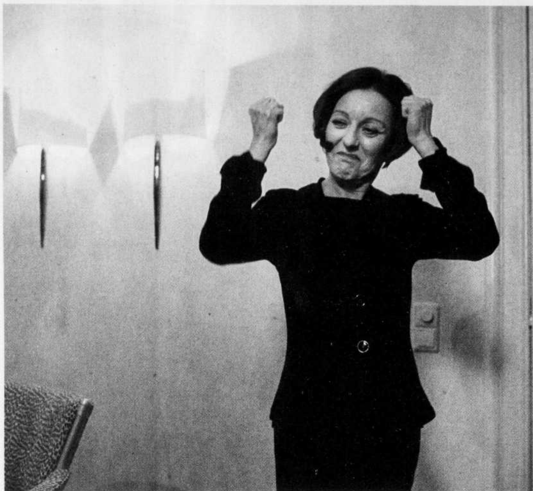
La femme de lettres allemande Herta Müller s'est dite encore hantée, 20 ans après, par la dictature communiste roumaine, un sujet omniprésent dans son œuvre, et a confié hier à Berlin son immense étonnement d'avoir reçu le prix Nobel de littérature.

Bien qu'elle vive depuis 1987 à Berlin, Herta Müller continue néanmoins d'écrire sur son expérience roumaine. «En ce qui me concerne, l'expérience essen-