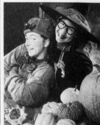
MICHEL TREMBLAY JARDIN BOTANIQUE