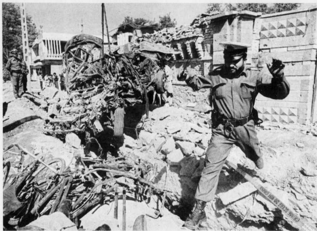
Un morceau de châssis carbonisé: voilà tout ce qui restait du véhicule du kamikaze.

Le président afghan Hamid Karzaï a dénoncé «un acte de terreur haineux». Le représentant