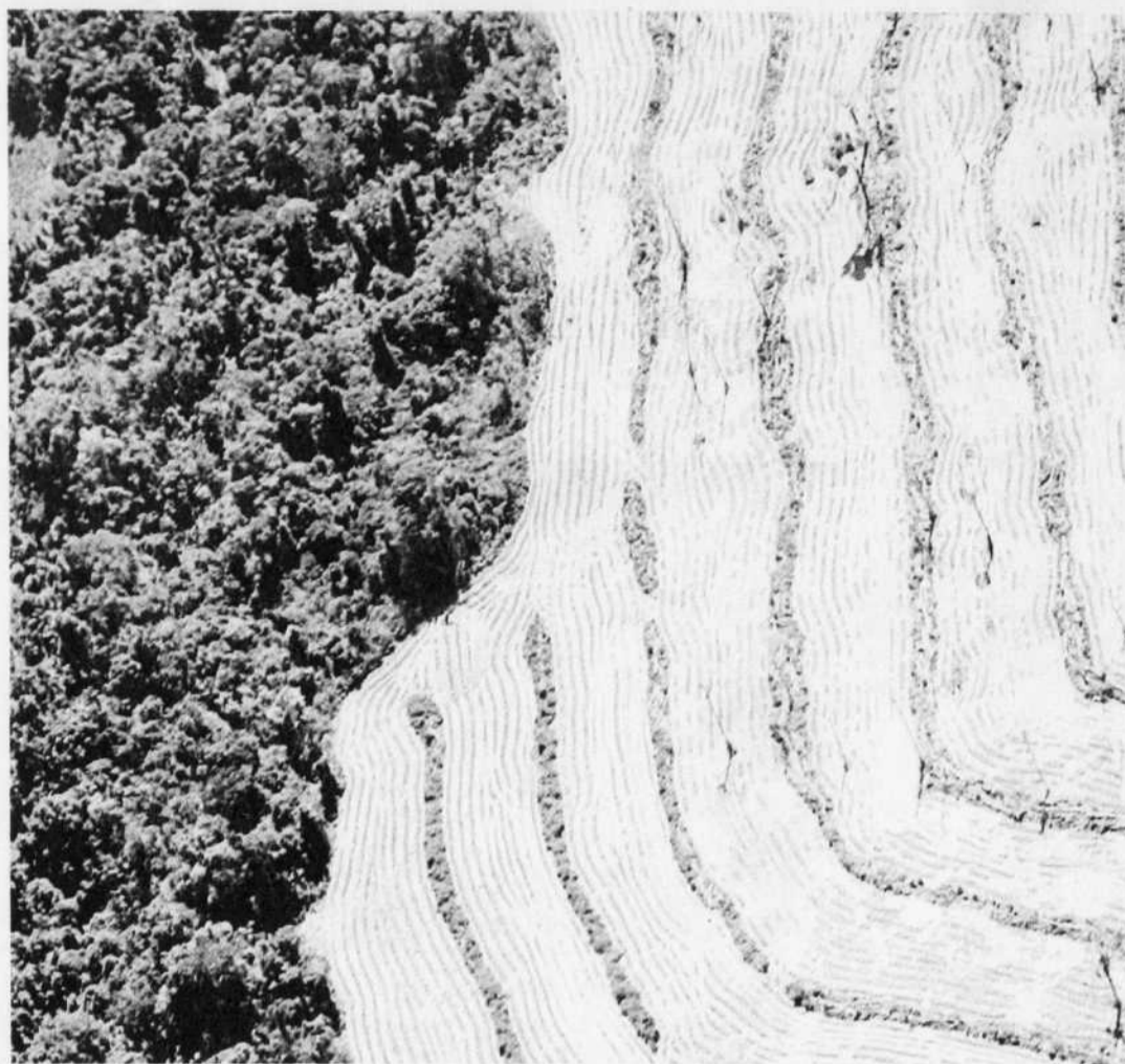
Vue aérienne de la forêt amazonienne. À gauche, la forêt intacte. À droite, une zone rasée pour permettre des activités agricoles. Depuis 1992, la destruction des forêts humides tropicales, le bastion principal des espèces vivantes, a dépassé en surface celle de la Californie.

Vice-présidente du programme international Diversitas, qui organise la conférence du Cap, Georgina Mace, du Collège impérial de Londres, déclare que «nous allons certainement rater la cible de réduction du taux de disparition des espèces fixée à 2010, et ainsi rater d'autant plus les objectifs de la conférence du Millénaire, soit d'améliorer la