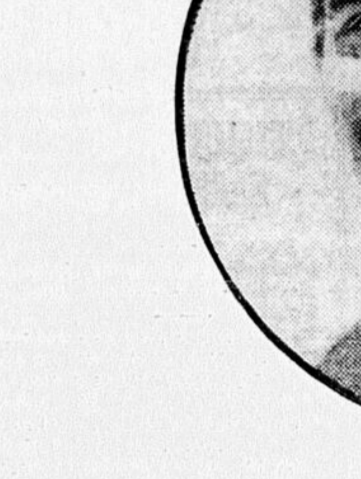
Une scène de "BECKY SHARP", le premier film photographié par le nouveau procédé Technicolor mettant en vedette MIRIAM HOPKINS et ALAN HOWE.