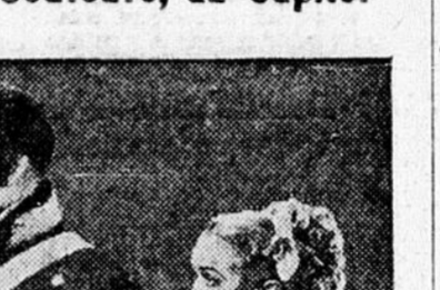
Une scène de "BECKY SHARP", le premier film photographié par le nouveau procédé Technicolor mettant en vedette MIRIAM HOPKINS et ALAN HOWE.